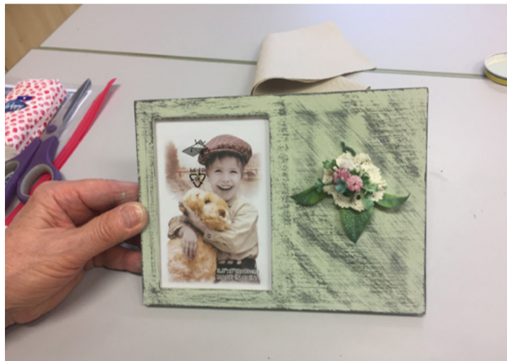
Nem csak emlék, így más stílusa is van

Amikor megszáradt a munkadarab, akkor jöhetett a legizgalmasabb rész, a csiszolás. A visszacsiszolás az antikolász lényege, hiszen így kapjuk meg a mintát. Itt szükség volt a jó memóriára is, mert csak