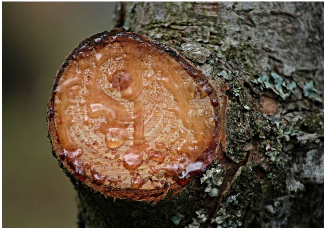
Amikor működésbe lép a gyümölcsfa önvédelmi rendszere, megindul a gyantásodás

■ A tavasz beköszöntével minden szorgos gazda nekilát a tél utáni első teendőnek, a gyümölcsfák metszésének. Erre a feladatra nem szabad sajnálni sem időt, sem energiát, hiszen a metszéssel alapozzuk meg a gazdag termést. Díszcserjéknél színes virágok lehetnek jól végzett munkánk gyümölcsei. A metszés kulcsszerepet játszik az új hajtások kialakulásában, és a fák koronájának szellősebbé tételében, ami lényeges a termőegyensúly fenntartásában. Ilyenkor a vágások során szó szerint egy nyílt seb keletkezik amit sebzáró szerekkel kell kezelni.