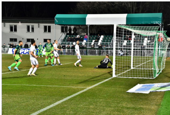
Az egyenlítés pillanata