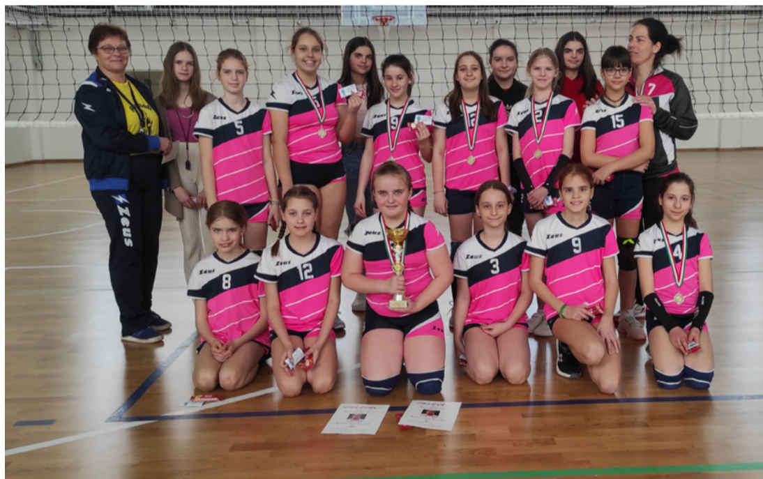
Az ajkai lányok edzőikkel