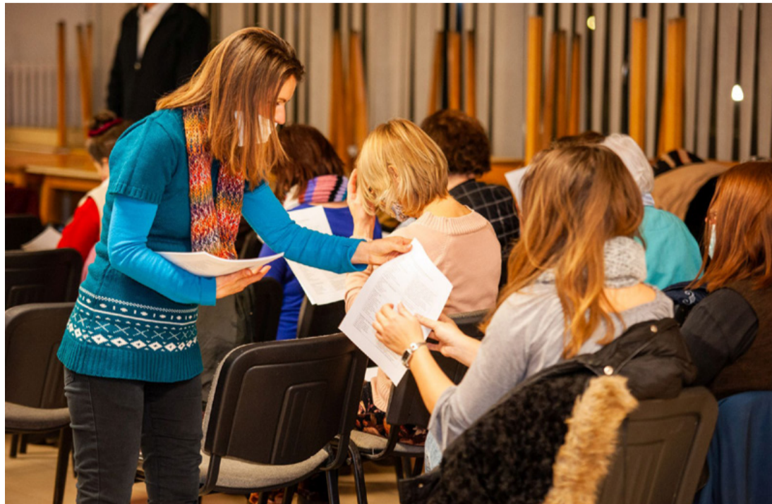
Az egészségesebb életmódot választókat számos témába vágó kiadvány segíti