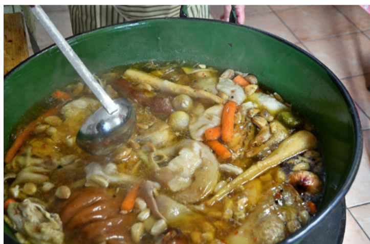
Így néz ki egy nagy kondér kocsonya. Van, amit csak nagy mennyiségben lehet (kell) készíteni

■ Tósokberéndért Egyesület kihasználta az utolsó hideg napokat és a márciusi hosszú hétvégére elkészítette a közösségi kocsonyát, főként a VIII. Dezsőnek köszönhetően.