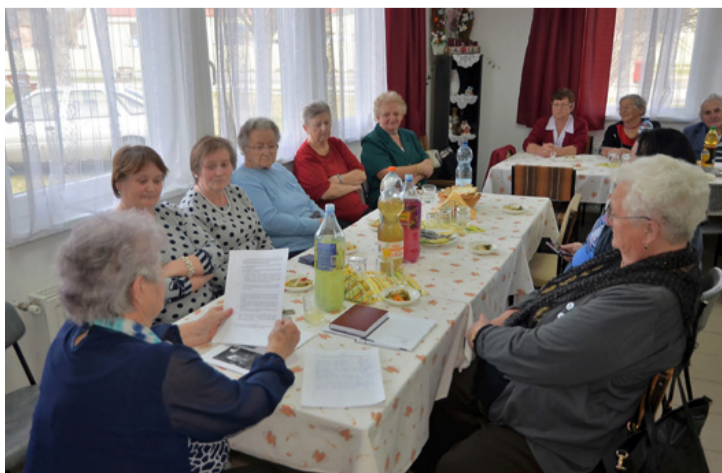
Beszámoló a Nostalgia nyugdíjas klubban