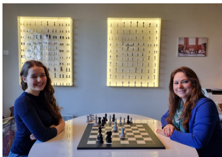
Királynők egymás között