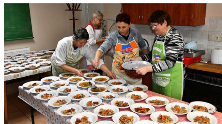
Minden tányérba kerül mindenből – készülnek az adagok