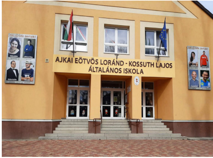
Az Eötvös Loránd-Kossuth Lajos Általános Iskola homlokzata március 9. óta