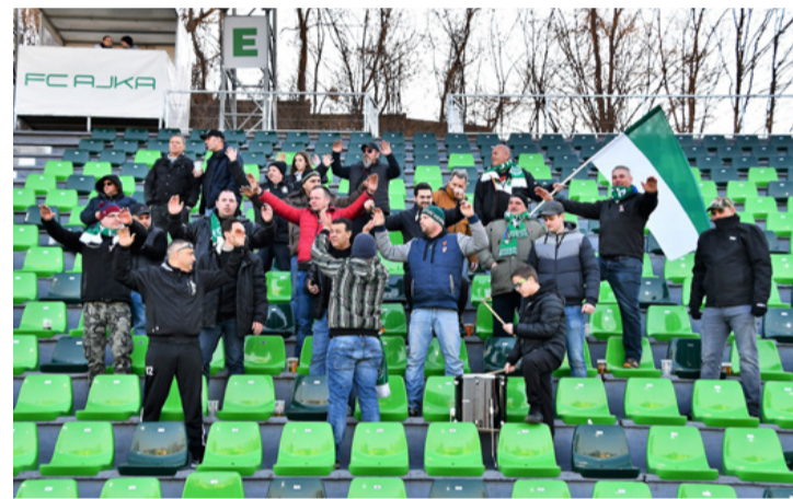
Most sem a B-középen múlt a győzelem