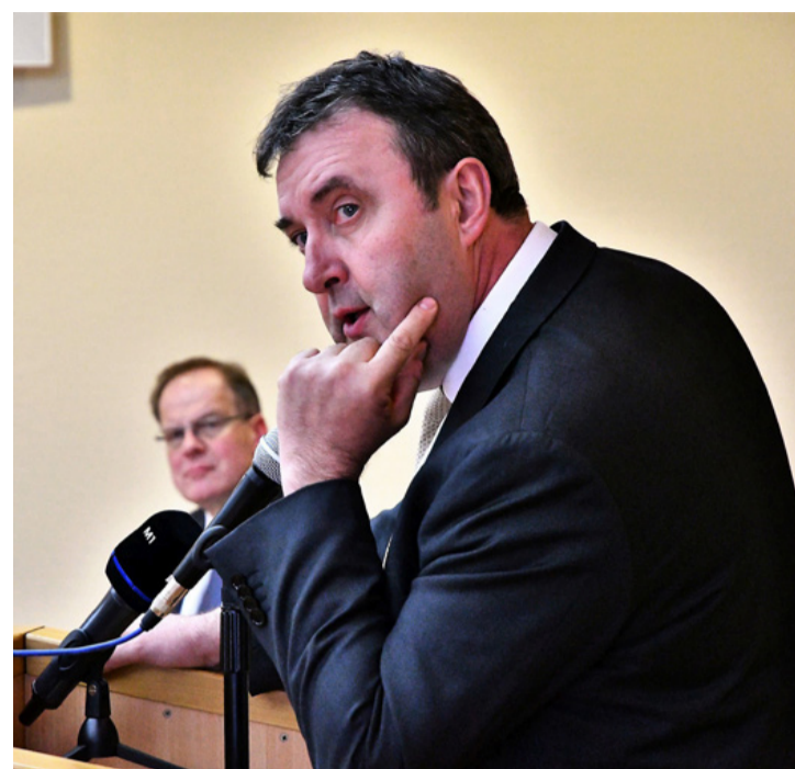
Palkovics László ITM miniszter

A hallgatóság soraiban túlnyomó részt az Ajkai Főnix Ipari Parkban található vállalkozások vezetői foglaltak helyet, de a városháza is