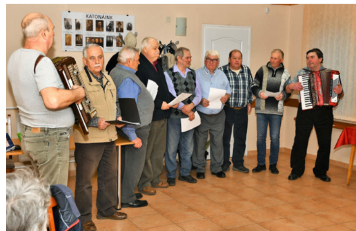
Az egyesület dalköre egy kellemes nótával köszöntötte a hölgyeket