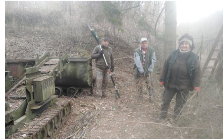
A mellékelt kép is jól jelzi, hogy szinte háborús viszonyok uralkodnak a régi bányaépületek körül. Szerencsére egyre többen érzik úgy, hogy önkéntesként hozzájárulhatnak a helyzet rendezéséhez, még ha néha emberfeletti munkát kell is végezniük.