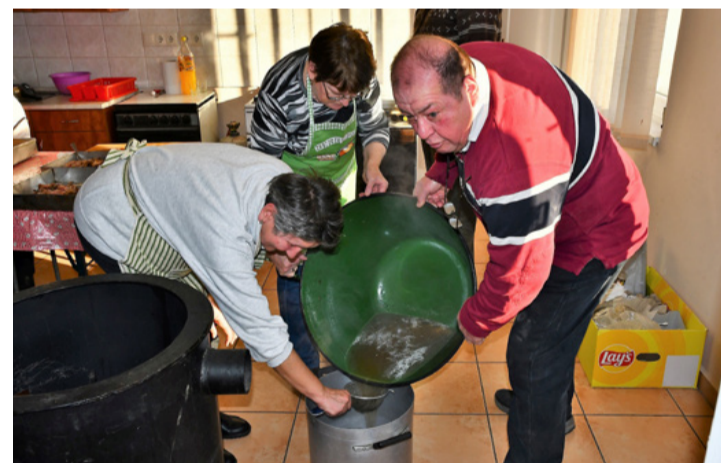
Gondos kezek szűrik a levet

A gasztronómiai élménnyel egybekötve az egyesület felkö-