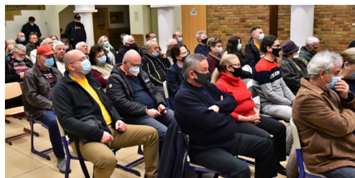
A tóskberéndiek kíváncsiak az országgyűlési képviselő-jelölt programjára