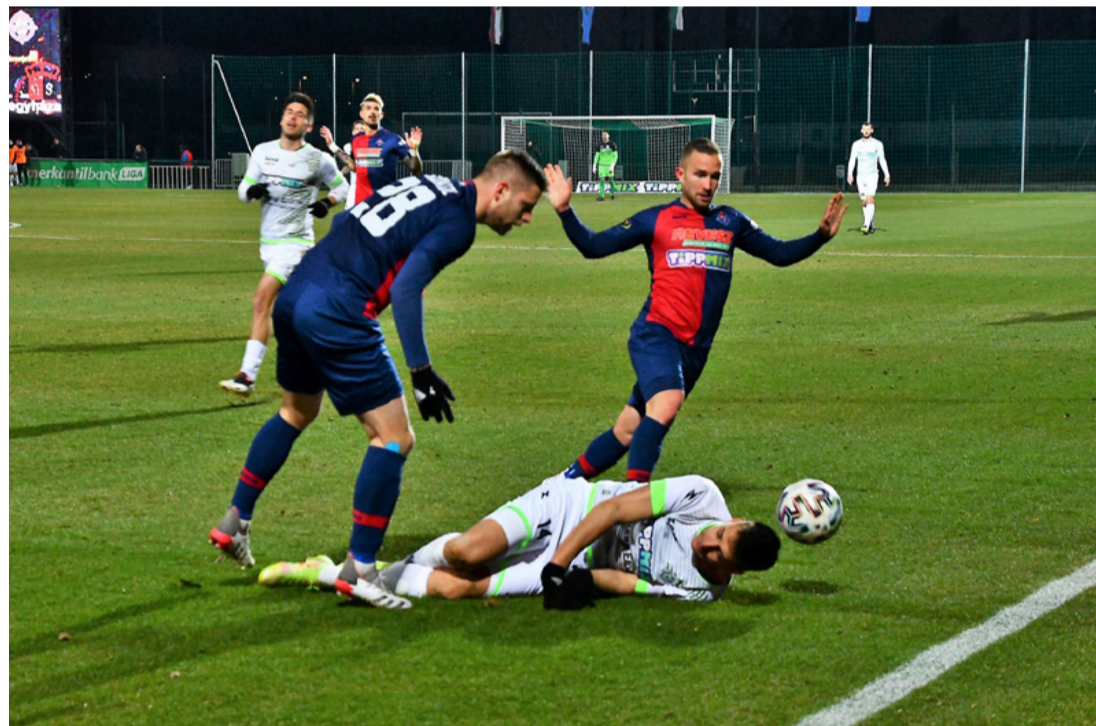
Emberhátrányban sem adta fel a Spartacus