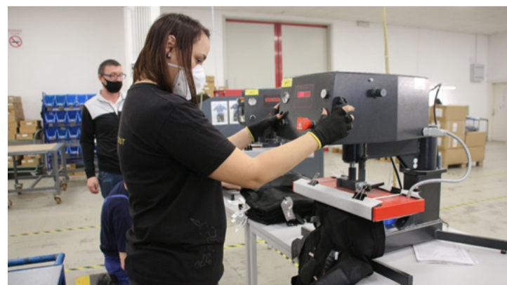
A Schwa-Mediconál tiszta környezetben, korszerű gépeken készülnek az orvostechnikai eszközök. Az okos tréningruhákat egyelőre csak Németországban kaphatók