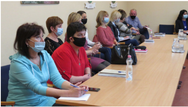
Csatarendben az intézményvezetők