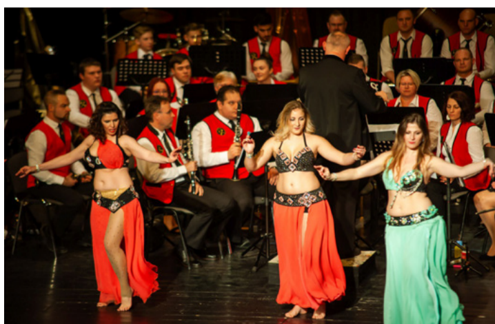
Az idén is színesítették táncukkal a koncertet a Bahar-os lányok-asszonyok

A rendezvény második részében a szórározatás volt a főszerep, amiből kihagyhatatlan a popzene egyik legnagyobb hatású és legsikeresebb angol beatzenekara. Beatles: „Ob-La-Di, Ob-La-Da” című, talán legnépszerűbb dalát – Naohiro