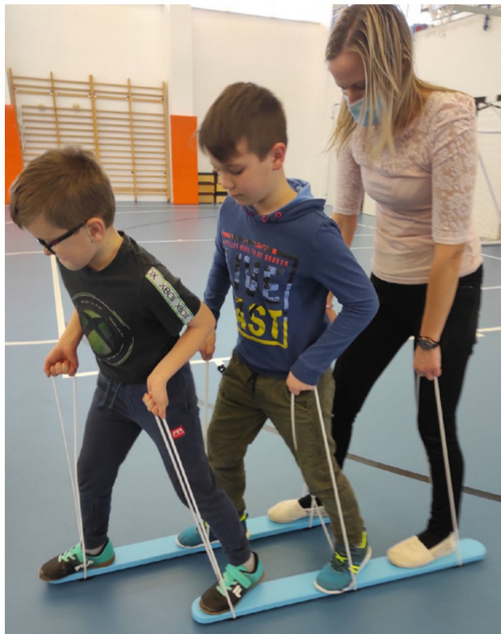
Együtt könnyebb, vagy mégsem?

■ A gyermekek nevelése sok együtt töltött idővel jár, de nem mindegy, hogy az idő küzdelemmel vagy örömmel van megtöltve. Az ajkai védőnők a közösségi szinten irányított helyi fejlesztés a CLLD, a TOP-7.1.1-16-H-ESZA-2020-01843 projekt megvalósításának keretében azt a célt tűzték ki, hogy a generációk egymással eltöltött ideje minél kellemesebb legyen és ehhez a játékos vetélkedőt választották eszközként.