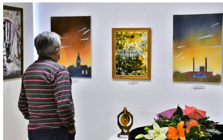
Látomások a falon

– Szeretek ezeket a belső képeket, szobrokat, mert beszélnek, élnek. Egyetlen pillanatra röpké megállítása mindegyik, amelyekből azt érezzük, hogy mégiscsak van lehetőség az élet számtalan mozzanatának száguldozó iramát rögzíteni. Sándor a vágató időben