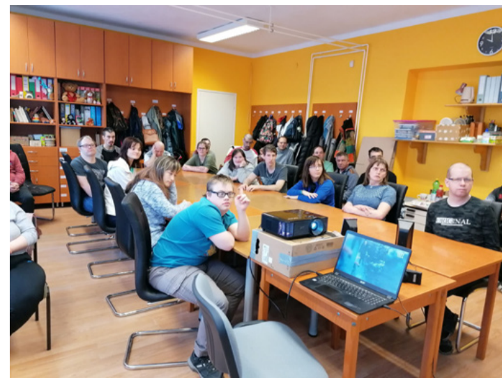
A Molnár Gábor Műhely Alapítvány fiataljait fokozottan kell óvni a világ durva megnyilvánulásaitól

Bármelyikünket képesek átvérni, ha nincs kellő jártasságunk a témában. Sajnos leginkább az érzelmeinkkel, érzéseinkkel élnek vissza az elkövetők. A közölt rossz hír