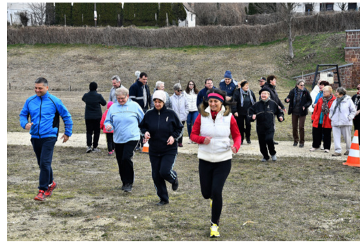
Indul a futás: ezúttal vegyes korosztállyal, élükön az ötletgazdával