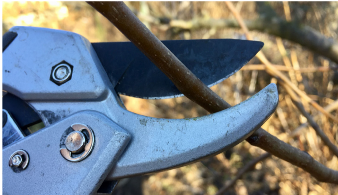
Kétszer is gondoljuk meg, fajtának, időjárásnak, elvárásainknak megfelelően metszünk-e?

A szőlőmetszés, így leírva lehet, hogy elsőre kissé bonyolultnak tűnik, de némi gyakorlattal, nem is olyan nagy ördögösség. F. P. T. ■