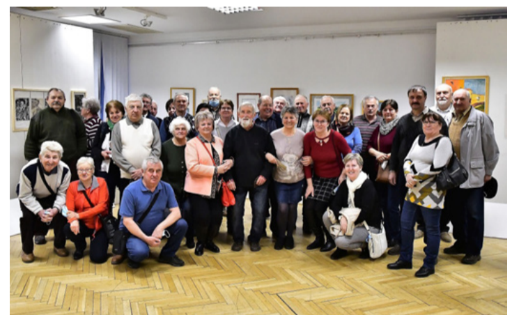
A Tósokberéndért Egyesület népes csapata is megtisztelte az alkotót

megérint egy pillanatot, és az a pillanat a képein, szobrain kivirágzik. Az alkotó érzi, mi is érezzük, a vászon is érzi, az anyag is érzi: ez a pillanat soha többé vissza nem jön, de éppen ezért örökített meg az alkotó által – jellemezte az alpolgármester Ozorai Sándor munkásságát megnyitó beszédében.