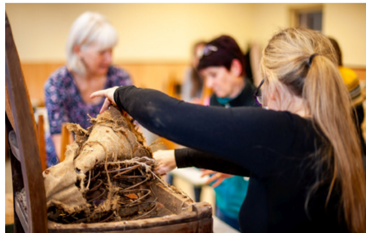
Nincs elveszett darab, csak ismerni kell a javítás módját