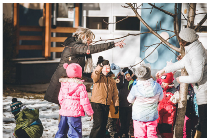
A madáretetést is tanulni kell