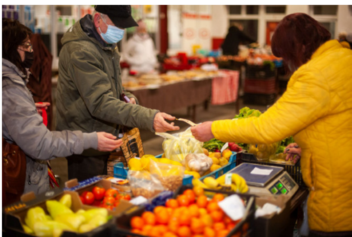
Hónap végén már kevesebb az árus és a vásárló is az ajkai piacon

■ Üresen maradt több árus helye a január 29-i piaci napon. A megszokottnál kevesebben kínálták a portékát a hűvös téli napon délelőtt, igaz vásárló is lényegesen kevesebb volt. Hónap vége volt, és ez meg is látszott. Január a legnehezebb hónap, karácsonykor az emberek többsége feléli a tartalékait, a tél közepén, amikor éjszaka fagyok vannak, a fűtés sem olcsó dolog.