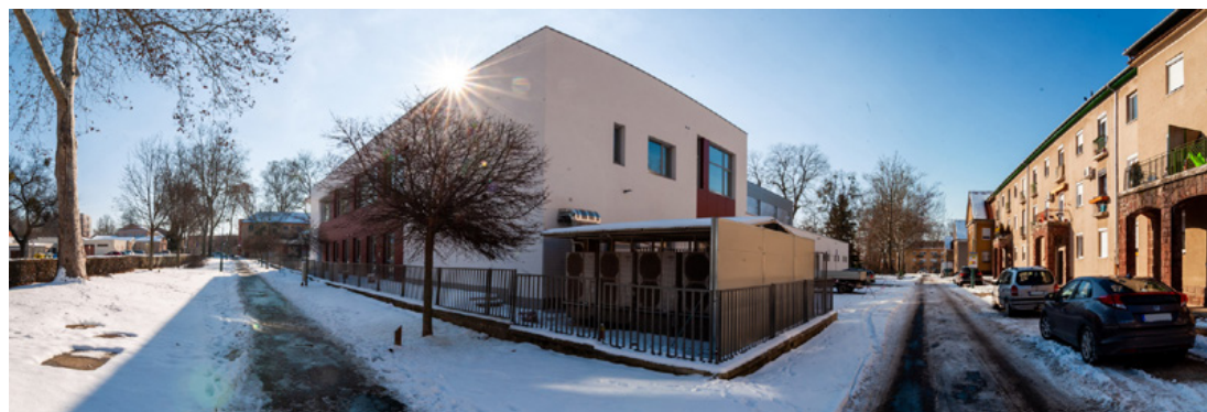
A kosárlabda gyakorlócsarnok a Semmelweis utca és a Mikes Kelemen utca sarkán