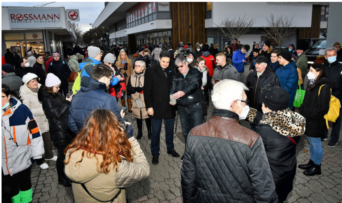
Több százan voltak kíváncsiak Márki-Zay Péterre az ajkai sétálóutcán tartott találkozóján

■ Az elmúlt tizenkét évben soha nem volt még a mostanihoz hasonló esély Magyarország legkorruptabb kormányának leváltására – állítja Márki-Zay Péter, a Mindenki Magyarországa Mozgalom elnöke, az egyesült ellenzék közös miniszterelnök-jelöltje. Szerinte nem múlik el nap, hogy a kormányoldalról ne támadná hamis állításokkal, kiforgatva szavait és megmásítva mondanivalóját lényegét. Az Ajka TV-nek adott interjújában elismerte azt is, hogy bár módszerei valóban nem mindig nevezhetők hagyományosnak, de az általa eddig Hódmezővásárhelyen megnyert választások igazolják állításait és állításainak stílusát is.