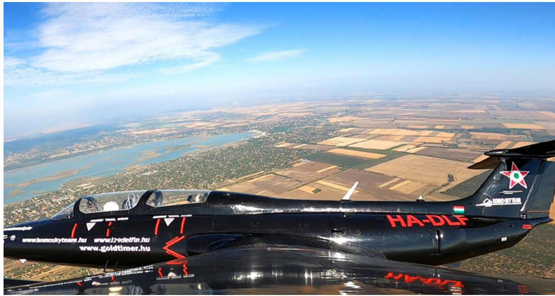
A Velencei-tó a Delfin oktatógép szárnyáról nézve