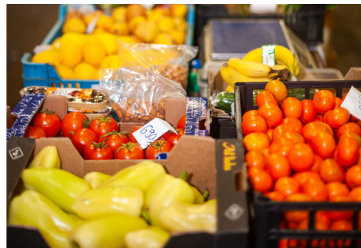
Az árak még nem adnak okot aggodalomra