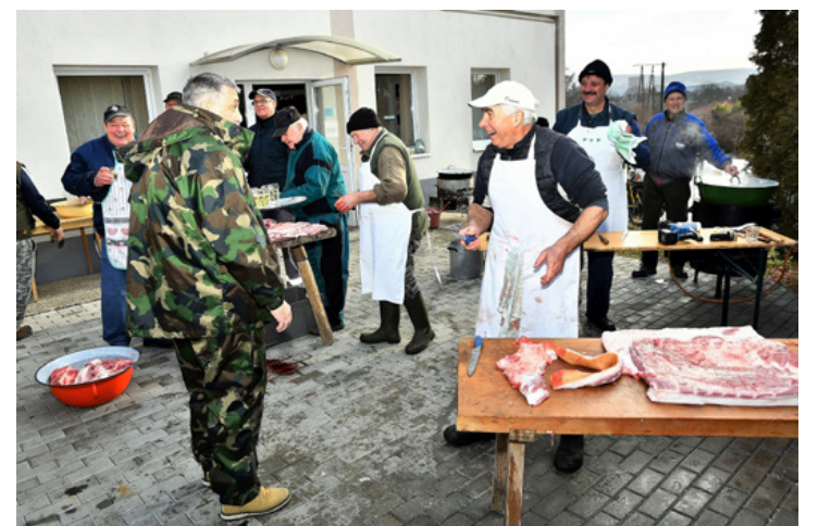
Forgatag a közösségi ház udvarán