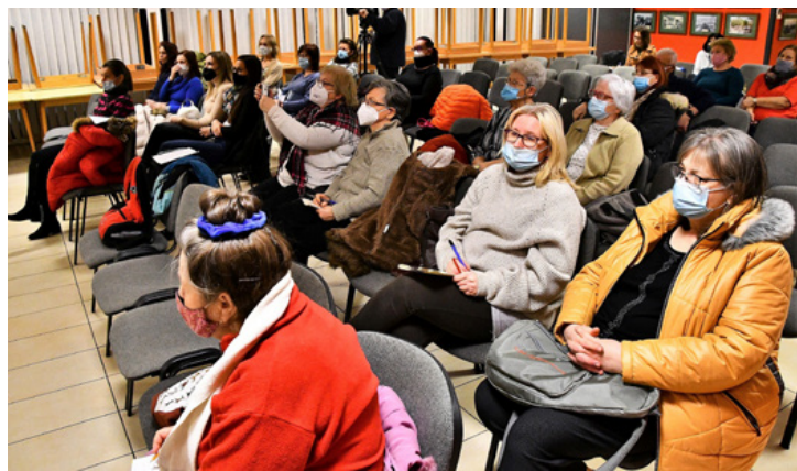
Akik elsősorban felelnek családjuk étrendjéért

Nagyon fontos, hogy a gondolkodásmód is gyógyíthat, de meg is betegíthet. Az életmód orvoslás a táplálkozással, a mozgással gyógyít. Ez egy magyar, tudományos bizonyítékokon nyugvó megközelítés, melynek célja a krónikus betegségek megelőzése, kezelése, esetleg visszafordítása azáltal, hogy az embereknek segít az egészségkárosító szokásaikat egészségtámogató életmódra cserélni. Az életmód alapú or-