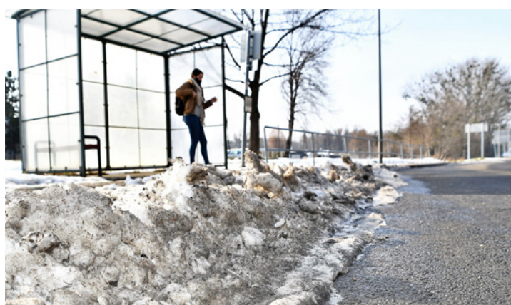
A buszmegálló tisztán tartása gépi eszközökkel nem egyszerű feladat