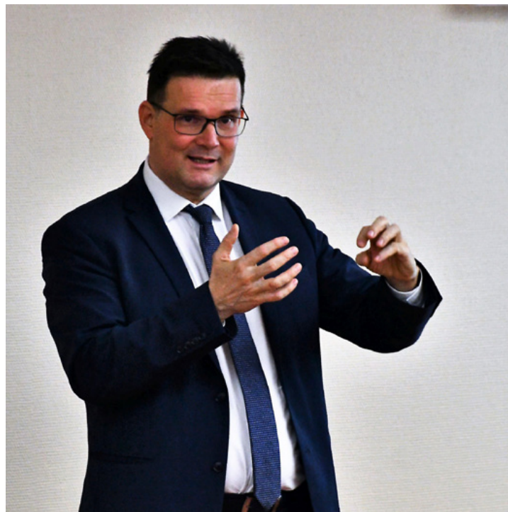
Birkner Zoltán nagy hévvel érvelt az innovációs folyamatok fontosságáról

■ – Mit nevezünk innovációnak? – kérdezte egy résztvevő a csütörtöki fórumon, amire Ajka vállalkozói és vállalatvezetői mellett hivatalosak voltak az önkormányzat és a Pannon Egyetem képviselői is, szemléltetve azt a „teret”, amiben az innovációs folyamatok szereplői egymásra találhatnak. A fórum előadója Birkner Zoltán, a Nemzeti Kutatási, Fejlesztési és Innovációs Hivatal (NKFIH) elnöke volt, aki korához méltóan fiatalos hévvel irányította a megjelentek figyelmét a terület fontosságára.