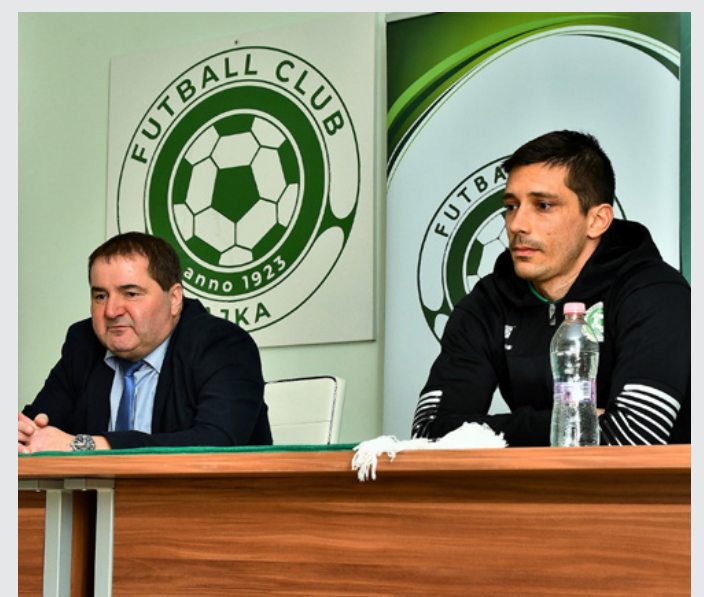
A mester és „tanítványa”