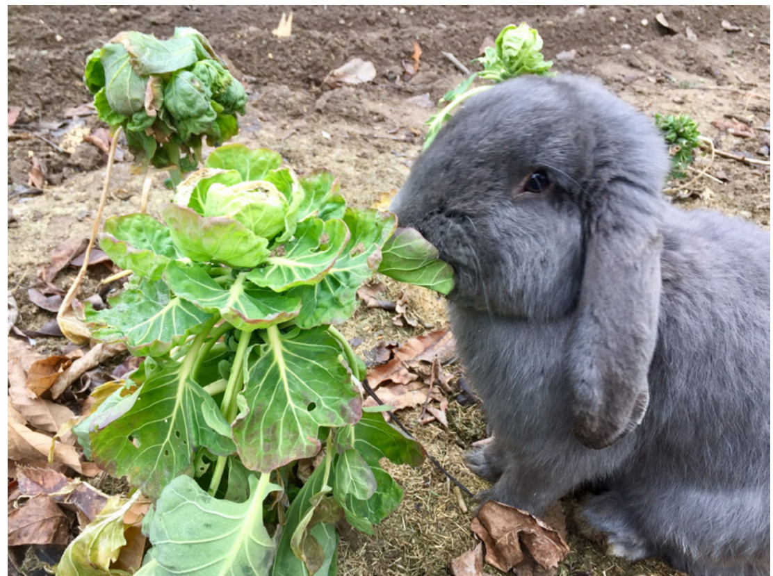
Eriknek, a lógófülű kosorrú nyuszinak elnézik, ha dézsmálja a termést

De mit is találunk ilyenkor a kertben? A következőkben egy rövid kertmustrára hívom az olvasókat. Az egyik ilyen, amit szinte mindenkinél fellelünk, az a bimbóskele. Sokan szeretik sültve vagy főve, esetleg rakottan ezt a sokoldalúan elkészíthető, egész télen szedhető zöldséget. Különlegességét az adja, hogy a tél folyamán alakul ki édeskes aromája, ami miatt olyan szerethető. Mivel évelő, így teljesen téltűrő, és egész februárig szedhetjük – persze ha jut belőle. Nálam nagyon szeretik a nyuszik is, ezért különösen vigyázni kell rá, hogy ne jussonak a kelbimbó közelébe.