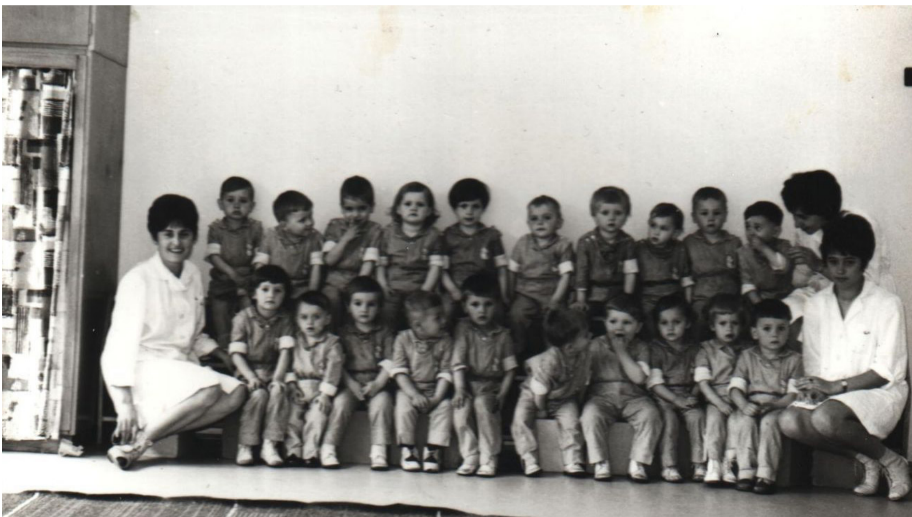
Az első csoportok egyike egy 1967 májusában készült fotón.