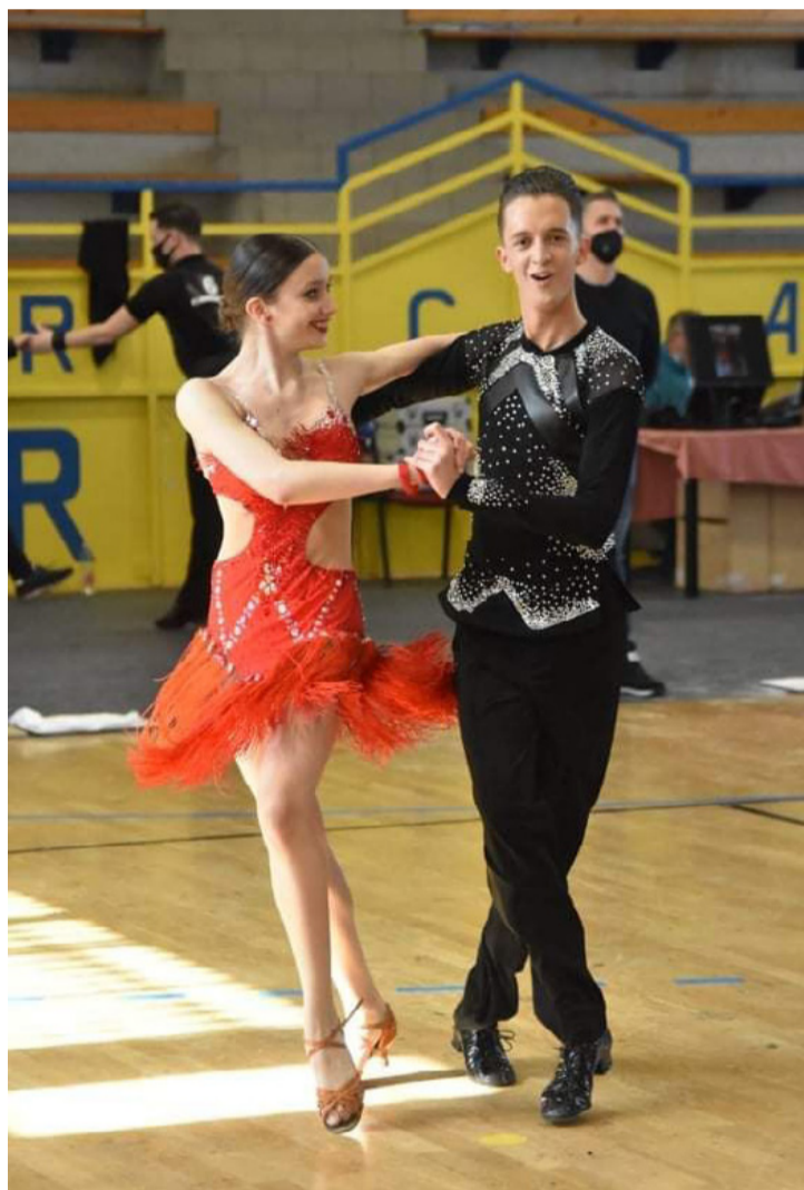
Egymástól távol is gyakorolnak

A tánc iránti szenvedélyük gyorsan meghozta a kiemelkedő eredményt: idei versenyszerezőjüket Ifjúsági C osztályosként kezdték meg, majd tavasszal, két alkalommal is, a latin táncokkal állhattak a dobogó felső fokára: a Közép-Magyarország Területi Bajnokságon, és a IV. Sundance Kupán, Jánoshalmán. Ez utóbbi megméretetés május 8-án zajlott, ahol Felöltött C osztályban is szép