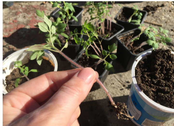
A megnyúlt paradicsom palántát mélyebbre ültessük

vetés ritkán jó, a késői vetés mindig rossz.”