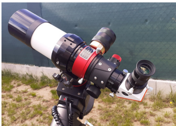
A sokat tudó naptávcső