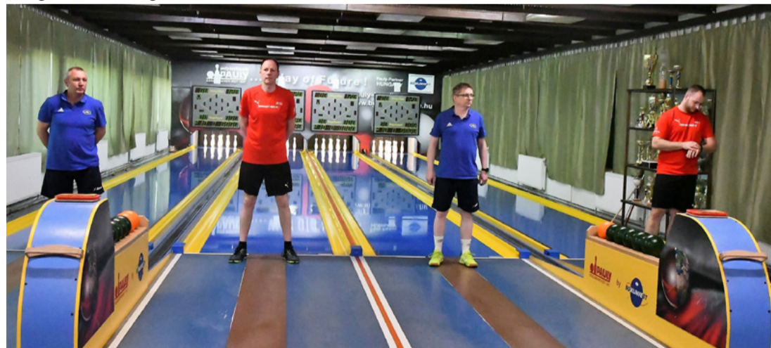
RE ■ A négy „mesterlövész”