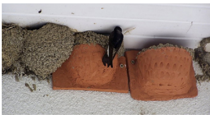
Van úgy, hogy a fecskék csak „alapnak” tekintik az emberi gondoskodást

nek: nyár elején és végén. A költés végeztével nádasokban gyülekeznek, hogy tartalékot képezzenek az utazásra.