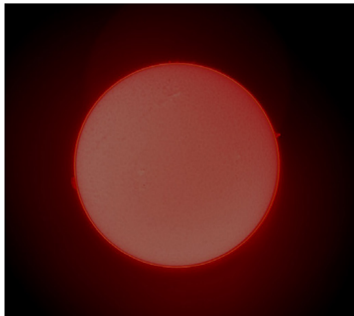
Központi csillagunk a távcsövön keresztül szemlélve (Fotó: egyesület)

*** A napkoronában lebegő vagy mozgó, környezeténél sokkal sűrűbb és hűvösebb felhő.