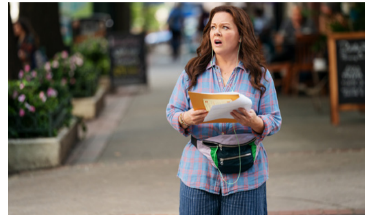
Melissa McCarthy a Szuperagy egyik jelenetében

Szuperagy 2D - amerikai akció-vígjáték, 106 perc (12) - vetítési időpontok: minden nap 16:30 és 20:30.