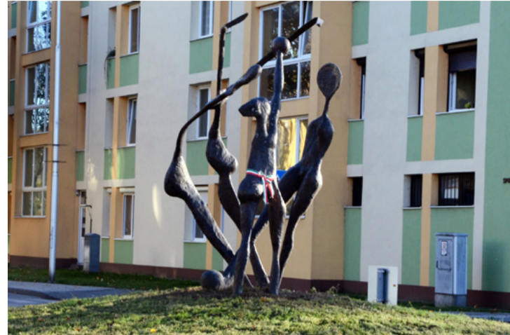
A Sportszobor a képzeletet is megmozgatja. Legyőzte az ellenérzéseket