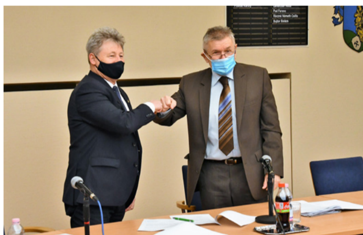
Aláírás után, közös csaták előtt?

2020-ban befizetett vállalati adók összege 1,2 milliárd forinttal marad alatta a tervezettnél. Az ennek kompenzálására csaknem ugyanekkor összegű kiadáscsökkenés vált szükségessé. Voltak