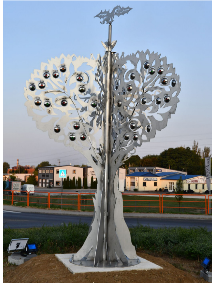
Ajkai legszebb almafája. Tovább viszi az életfa kultuszt