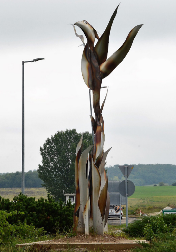
A viharvert tűzmadár. Ha eltörik újraéled

■ Ajkai köztéri alkotásai közötti kalandozásunk utolsó állomásához érkezünk, ezúttal azokat a modern, városképet meghatározó új szobrokat járjuk körbe, melyeket a város 60. születésnapjára kapott.