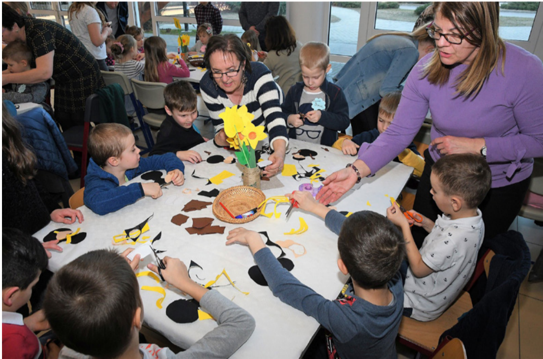
Egy izgalmas foglalkozás a Szent Istvánban