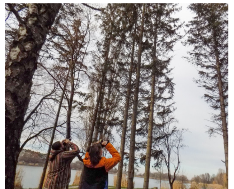
Bagolyszámlálók akció közben. Nő a létszámuk