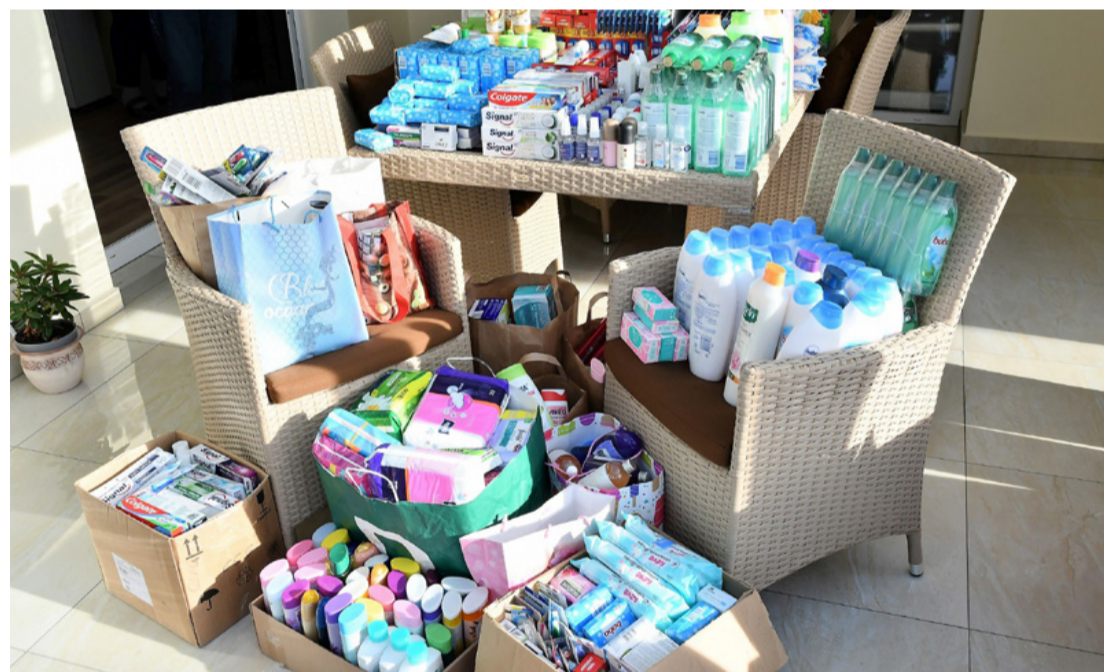
Se szeri, se száma az adományoknak