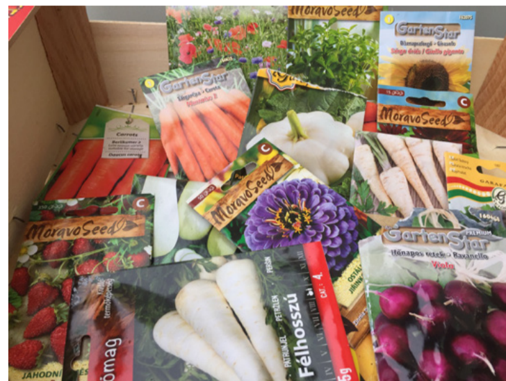
Kerti vetőmagok garmadája. Figyeljünk a jelekre

már, hogy elkapott bennünket a hév és jól bevásároltunk vetőmagokból. Egy részüket persze elültettük, a többit viszont jól elraktuk. A következő évben, vagy akár évekkel később aztán megtaláljuk a kis tasakokat és eltöprengünk azon, vajon elültethetjük-e még a régi magokat? Természetesen igen. Függetlenül tehát a vetőmag csomagolásán feltüntetett lejárat dátumától, a régi magok csíráztatása mindenképpen megéri egy próbát. Három fontos dolog befolyásolja a vetőmag csírázását: a kora, a fajtája és a tárolási körülménye. Minden mag legalább egy évig életképes marad, de a legtöbb két évig is használható. Az első év után a lejárt szavatosságú magok csírázóképesége csökkenésnek indul. A kukoricaszemek vagy a paprikamagok például igen nehezen élik túl a kritikus két évet. Más növények, mint például a bab, borsó, paradicsom vagy sárgarépa esetén a magok akár négy évig is életképesek maradhatnak. Az uborka vagy a saláta magjai pedig akár