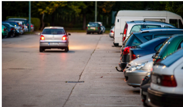
Talán lesz hely annak is, aki későn ér haza

Ingyenes tárolóparkolókat is alakít ki az önkormányzat