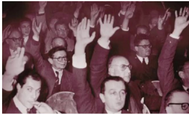
Amerikai pszichiáterek szavaznak: Legyen betegség a hiperaktivitás! (Egy kép a kiadványból)

Magát a tünetegyüttest (ADHD) amerikai pszichiáterek egy csoportja szavazással (!) nyilvánította betegséggé, szubjektív alapon megalapozva ezzel egy sokmilliárdossá növekedő gyógyszeripari szegmens jövőjét és megágyazva sokezernyi szerencsétlen kisgyerek (és családjuk) tragédiájának. Nagyon valószínű ugyanis, hogy a manapság egyre gyakoribb, akár késelés, vagy lövöldözéssé, fajúló iskolai konfliktusok hátterében is orvosok által felírt pszichoaktív szerek állnak, amelyeknek vagy mellékhatása az agresszivitás,