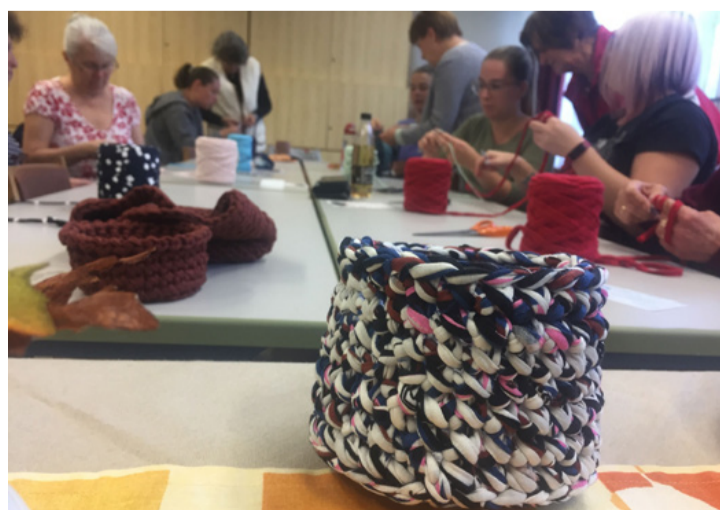
Praktikus horgolmányok készültek

sok-sok türelemmel modern horgolmányok szülehetnek, amelyek jól beilleszthetők