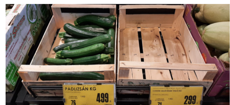
Apát küldték vásárolni. Vajon milyen lehet a saláta padlizsánból? (A kép illusztráció)