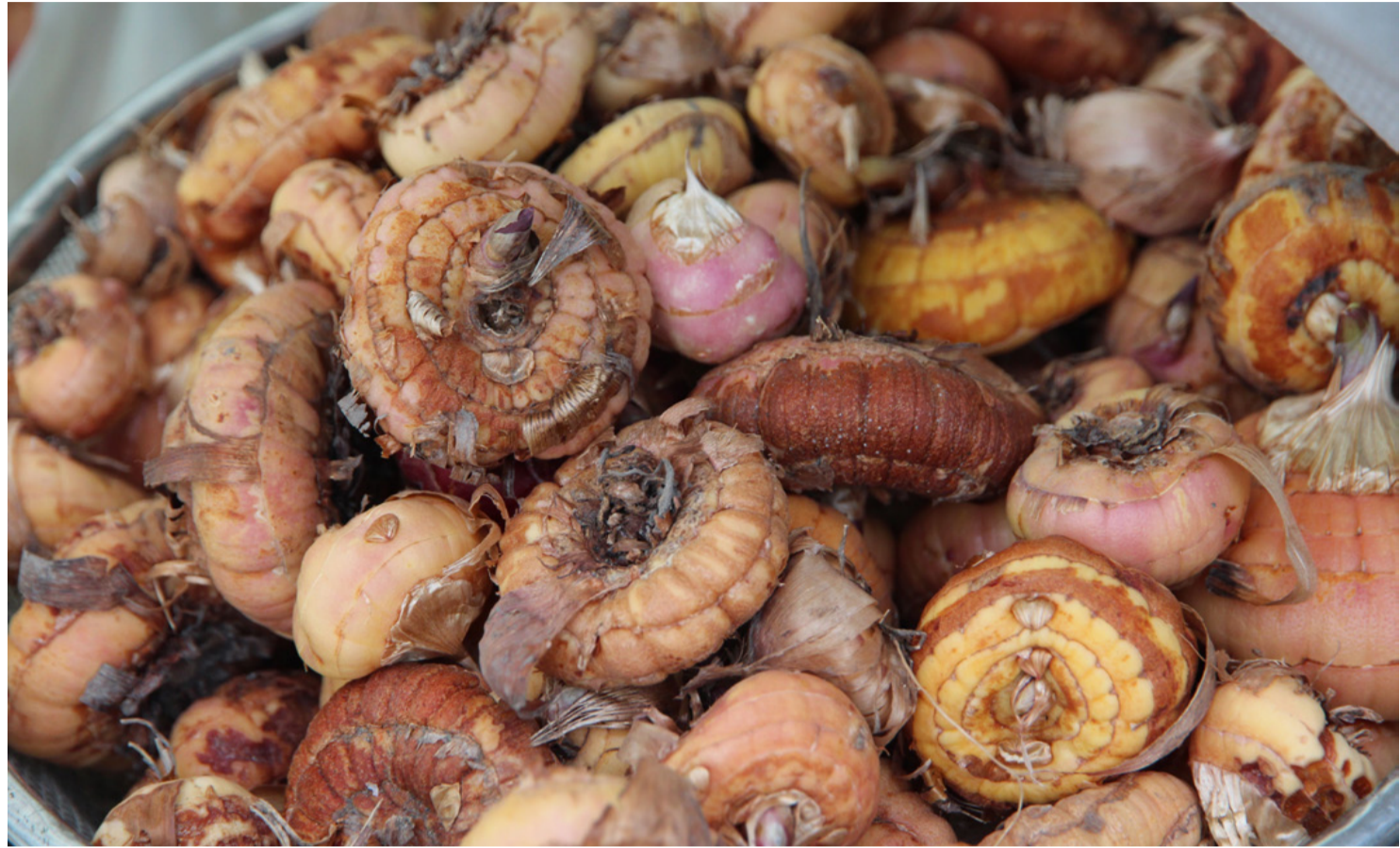
A virághagymák télre készülnek