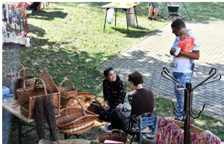
A kosárfonás ősi mesterség

■ A Padragkúti Művelődési Házban hétről hétre követik egymást a programok. Egy héttel korábban a magyar dal napját ünnepelték, szeptember 26-án pedig a „Roma Nemzetiségi Nap Padragkúton” elnevezésű projektet bonyolították le nagy sikerrel a szervezők. A romák szeretnék megőrizni, ápolni, továbbadni hagyományait és nem minden eredmény nélkül. Kézműves termékeik, táncaik, zenéjük iránt ezen a programon is nagy érdeklődés nyilvánult meg.