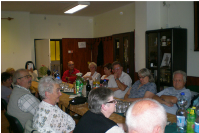
Jó hangulatban zajlott a találkozó