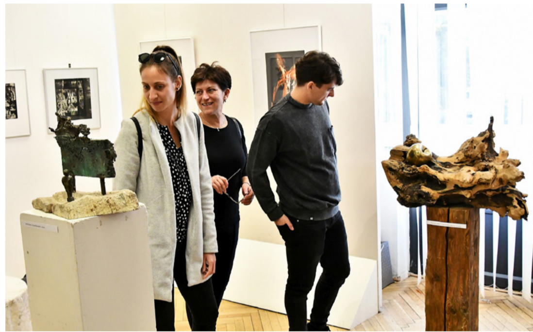
A kiállítástól derű sugárzott

pont, művelődési ház és közösségi színtér várta az érdeklődőket - országszerte, illetve határon túl is - változatos és értékes programokkal. Az esemény-sorozat célja, hogy minél többen legyenek részesei a közművelődési intézmények által nyújtott kulturális sokszínűségnek, értékeltségnek. A „Minden nap értéket adunk” szlogenel a szervezők azt üzenik, hogy a közművelődés a hétköznapiakban is értékes kultúrát közvetít és teremt. A kezdeményezéshez csatlakozott az ajkai intézmény is többféle kulturális rendezvénnyel. Művészeti csoportok nyílt próbákat tartottak, így az érdeklődők közelebről nyervehettek betekintést az Ajka-Padragi Bányász Fúvószenekar munkájába. RE