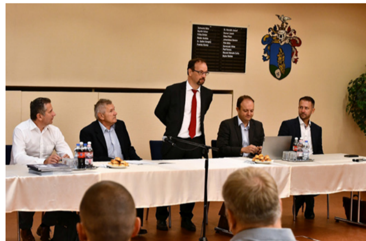
A miskolciak is várják az ajkai hallgatókat (Fotó: Györkös)