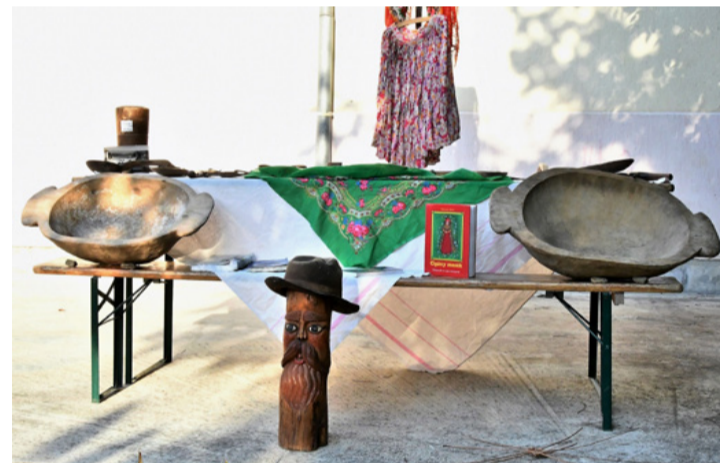
Minikiállítás használati tárgyakból