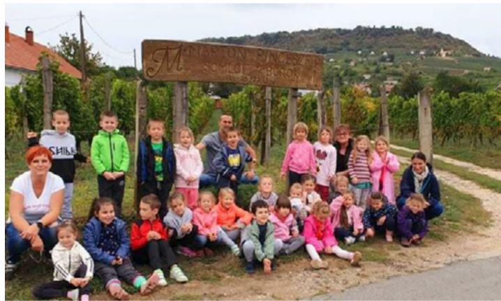
Csoportkép a Somlón tett kirándulásról

magyar népi kultúra, amelyet évszokról évszakra követünk. Megismerkednek a gyerekek a magyar néptánc alapvető lépéseivel, páros és kórtánc formáival. A projektben résztvevő pedagógusoknak lehetőségünk volt tehetséggondozással kapcsolatos szakmai továbbképzésen részt venni, illetve a két intézmény nevelőtestülete szakmai nap keretén belül intézményi továbbképzésen vett részt, mely lehetőséget adott az Így tedd rá! program és a Lippogó program megismeré-