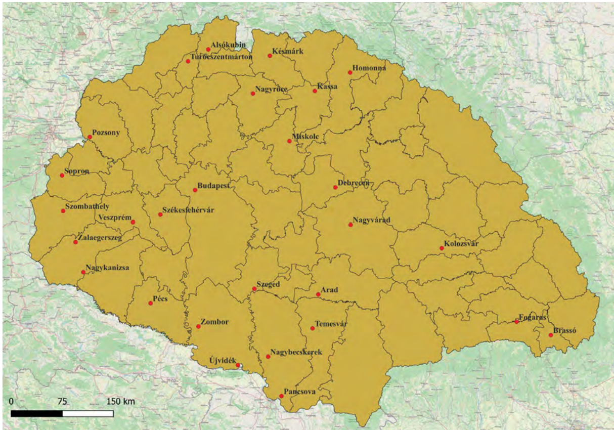
■ A kataszteri szervezetbe belépésre jogosító – a Pénzügyi Közlönyben közzétett – iskolák települései (a szerző saját tervezésű térképe)

hattuk, hogyan működött ez a gyakorlatban. Az utánpótlás biztosításában kiemelkedő szereppel bírt a pécsi iskola, amely a térség legtöbb későbbi mérnökét engedte útjára. A kataszteri képzettség megszerzéséhez alkalmas további központok felderítése még a tudományos kutatás feladata lehet.