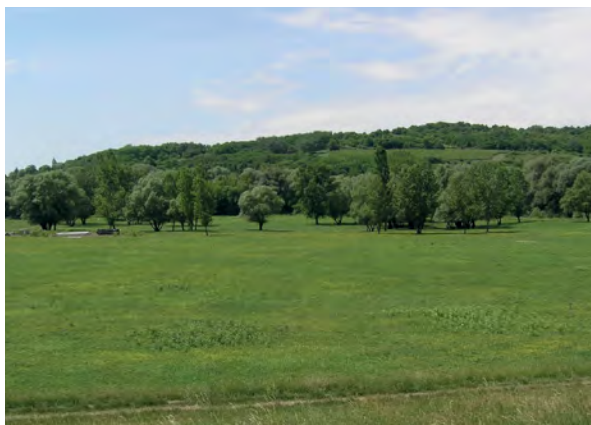
■ 7. Helemba, Órhegy (2022)

A poltári Órhegyről két középkori oklevél is szól. Károly Róbert 1332-ben adományozta el a király és családja ellen merényletet elkövető Zách Felicián poltári birtokát – és leíratta