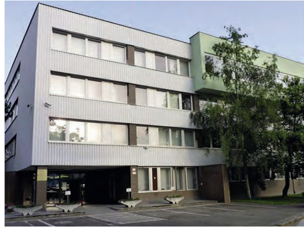
■ A Pozsonyi Geodéziai és Kartográfiai Intézet (Geodetický a kartografický ústav Bratislava) épülete a Chlumecký utcában, ahol a Geodézia és Kartográfia Központi Levéltára (Ústredný archív geodézie a kartografie) működik