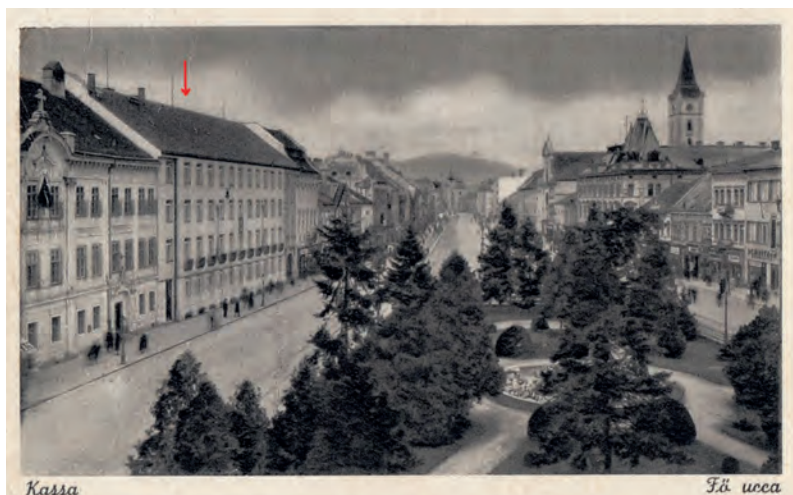
■ A Fő utca (Hlavná ul.) Kassán, piros nyíl jelöli a volt Kassai Pénzügyigazgatóság épületét, 1943