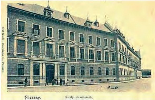
■ A Pozsonyi Királyi Törvényszék Kapucinus utcai korabeli épületének képe