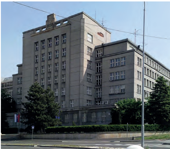
■ A pénzügyi hivatalok épülete, itt működött a kataszteri térképtár 1932 és 1981 között (Pribina utca), ma a szlovák Belügyminisztérium székhelye