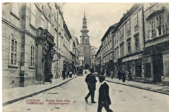
■ A pozsonyi Mihály utcai (ma Michalská ul.) volt Királyi Táb-labírórság épülete a kép bal szélén