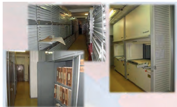
■ A Geodézia és Kartográfia Központi Levéltára (Ústredný archív geodézie a kartografie) raktártere