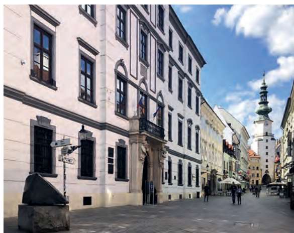
■ A pozsonyi Mihály utcai (ma Michalská ul.) egykori bírósági épület, ma a Pozsonyi Egyetemi Könyvtár központi épülete