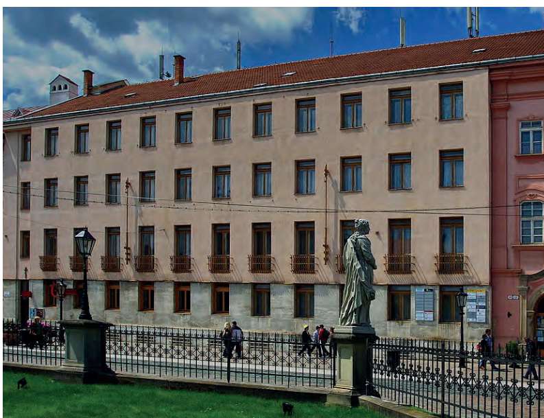
■ A volt Kassai Pénzügyigazgatóság Fő utcai (Hlavná ul. 68.) épülete ma

főmérnök nyugdíjba vonult, majd más állami szolgálatot vállalt, amelyhez nem kötötte az új államhoz való hűség és lojalitás esküje.