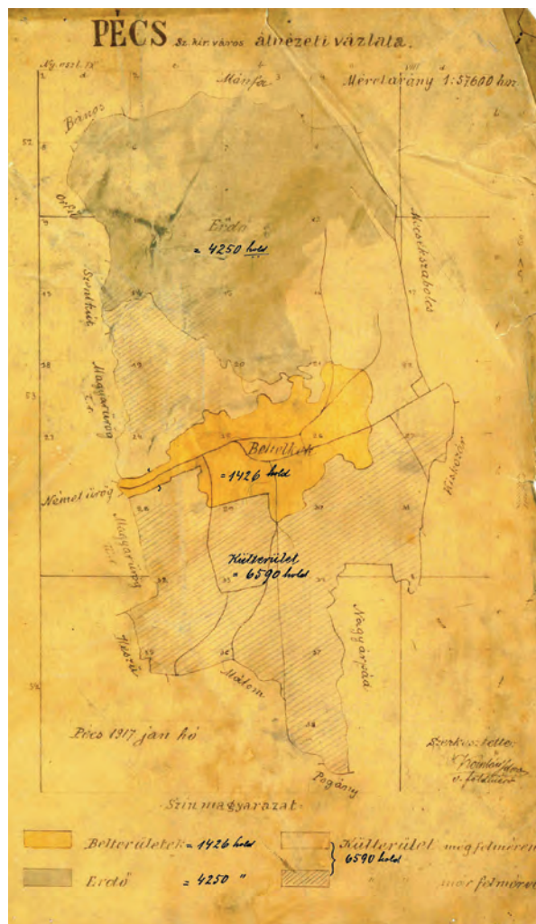
■ Pécs szabad királyi város átnézeti vázlatja (MNL BaML IV. 1406. e.1088/1916.)

Komlói a háború alatt számos munkával keverte meg a pécsi felmérési felügyelőséget. A