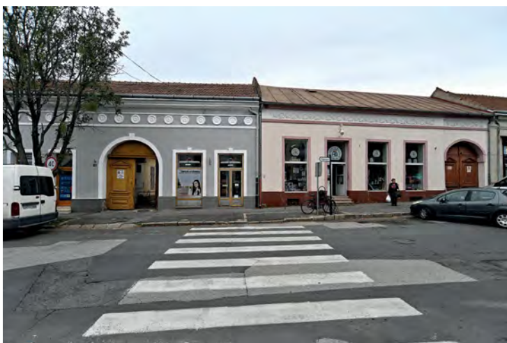
■ A Kossuth utca keleti házsorának részlete a Patika köz torkolatánál. Az eredeti fésűs beépítésű házakat keresztzárnyak emelésével zárt utcai homlokzatúvá építették át, és boltok, vendéglők számára kínáltak alkalmas elhelyezést. A szomszédos épületek egyikében működött az a vendéglő, ahol a főiskolai ifjúság alkalmanként szórakozott, és ahol később az öregdiákok találkozóinak ünnepi ebédeit tartották