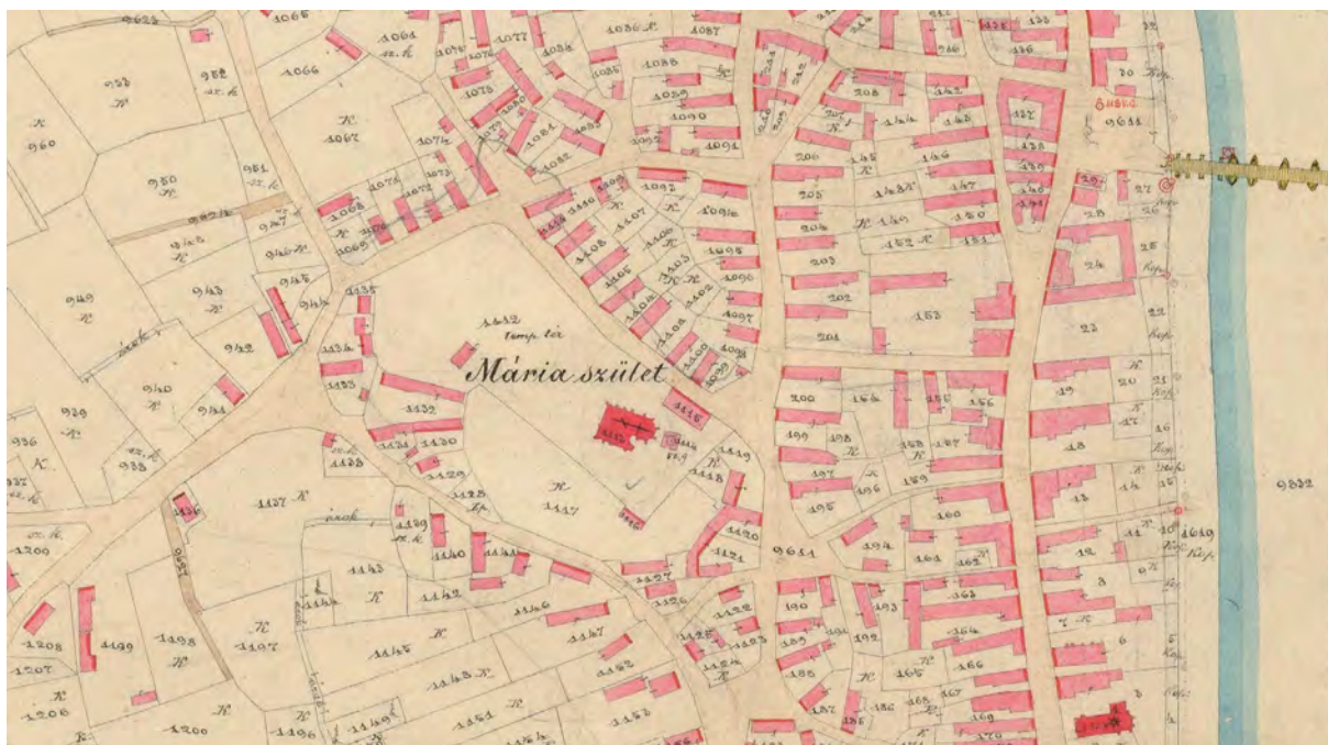
■ Ráckeve kataszteri térképének belterületi részlete a pravoszláv, szerb templom, a református templom és a híd fő között. Feltűnő a telkek területének szűkösége. A kép bal oldalán a gazdasági tartozéktelkek övezetének széle látható

a Csepel-szigetet keletről ölelő Duna ágának jobb partja közvetlen közelében kialakult, természetes földhátat ülték meg. Véleményem szerint korábbi földtörténeti periódusban a Duna övzátonyként építette ezt a nem túl széles, a történeti időszakokban már árvízmentes kiemelkedést. Egykor a folyam vízhozama lényegesen nagyobb volt, és a meder vízmagassága a jelenleginél szintén sokkal nagyobb lehetett. Erre vall, hogy a viszonylag nem túl széles, a Dunával párhuzamos, észak–déli irányú földhát nyugati oldalát eléggé kiterjedt laposabb, belvíznek kitett, olykor árvízjárta terület kíséri. Ezzel függ össze, hogy a belterületet nyugatról határoló Öreghegyi úton felül és az Öreghegyi úton alul a dűlőkben és a szálláskertként is szolgáló Lencse kert területén sok felé elágazó árokhalózatot rögzített a felmérés. Az említett helyektől délnyugatra a „Telek allja” [így!] osztatlan határrészen (minden bizonnyal gyepes területet jelöl a helynév) „Czigány domb” és a már említett Lencse kert nyugati határvonala mellett az árkok végpontján túl jelentékeny tavat, vízállást örökített meg a kataszteri mérnök. A laposabb területen az árvízvédelmi töltések kiépítése előtt csak úgy lehetett biztonsággal épülete-