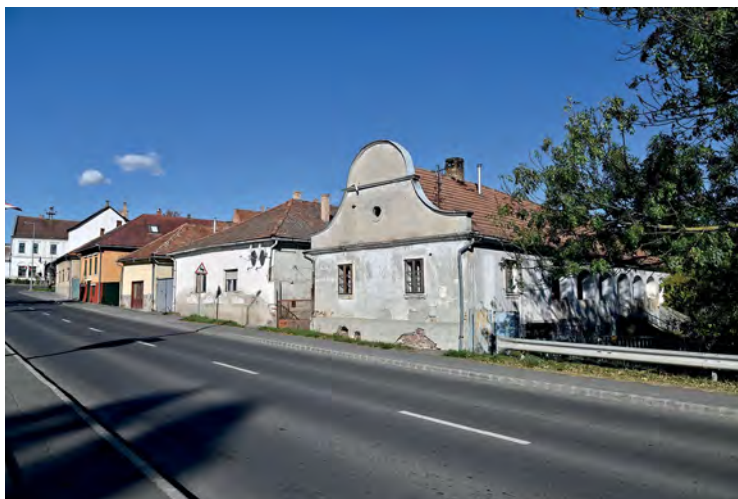
■ A Híd utca (ma Attila út) északi házsora részben ma is őrzi az eredeti fésűs beépítést. A Bodrog felől a szélső műemléki védettségű lakóház barokk homlokzatával, boltíves tornáccával a táj általános háztípusához mérten erősen városi jellegű

A középkori város a Perényiek betelepülésével uradalmi birtokközponttá is vált. A 17. századtól, az allodiális gazdálkodás megszi-