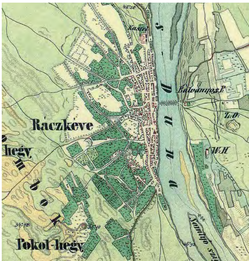
■ Ráckeve a második katonai felmérés térképlapján. A Duna-part árvízmentes sávjában a 15. században megtelepedett város észak-déli tengelyre kiépült utcás település. A zsúfolt belső magban csak lakóépületeket emelhettek. A gazdasági rendeltetésű épületeket a város nyugati-déli előterében kialakított tartozéktelek szálláskerti övezete fogadta be. Ezeket itt és a tágabb környezetben következetesen erős zöld szímmel jelezték a térkép készítői

Ráckeve történeti településmagját a kataszteri térkép segítségével írhatjuk le, mutathatjuk be. Az 1880-ban készült kataszteri térképnek sajnálatos módon csak a település északi részét ábrázoló szelvénye áll rendelkezésünkre. Szerencsénkre ez magában foglalja a hajdani szerb egyházközség különösen értékes templomát is, de rajta van még (a szelvény déli széle közelében) a reformátusok újabban épített temploma is, amelynek természetesen volt 16. századig