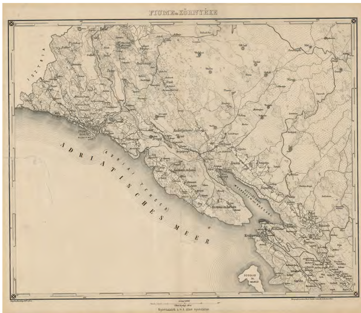
■ A Hátsek Ignác által 1862-ben rajzolt Fiume és környéke-térkép, amelyet 1870 után adott ki az Államnyomda (HM HIM, HT G I h 176.)