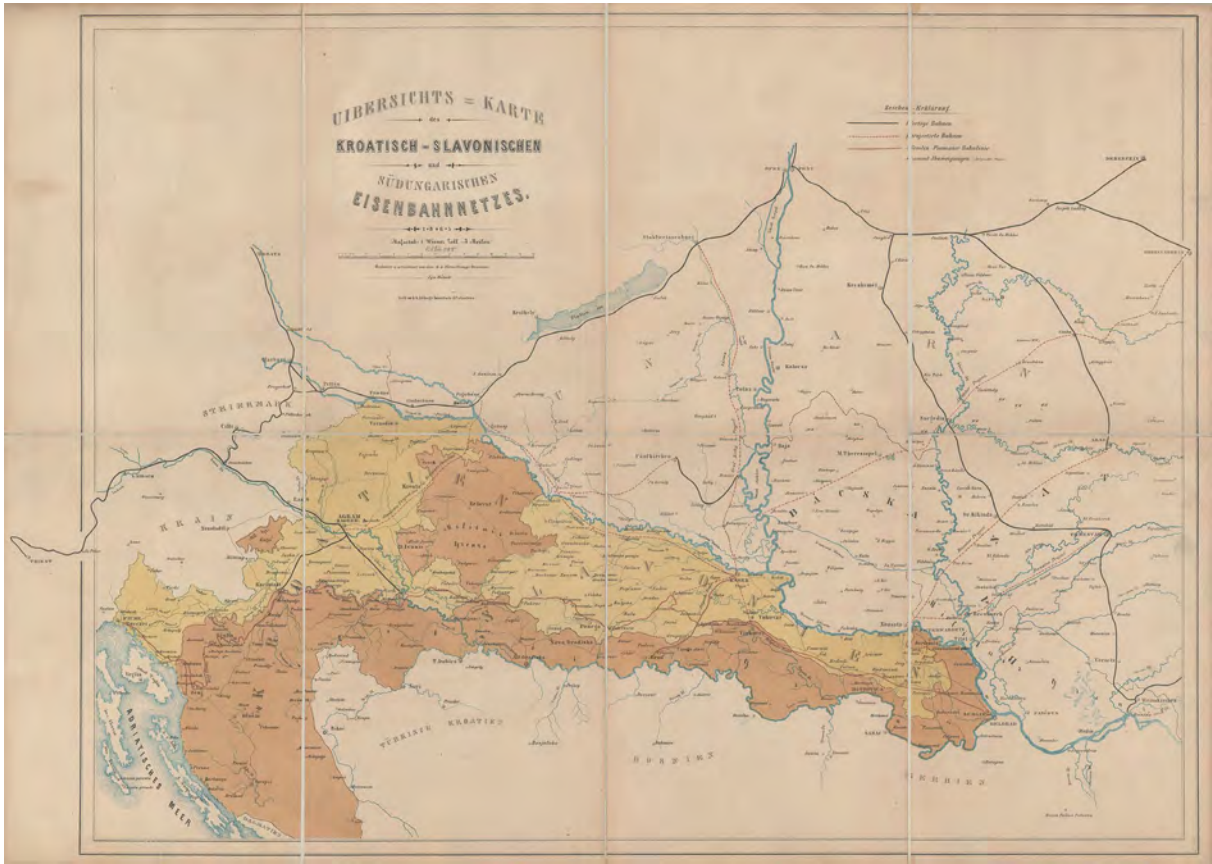
■ A horvát-szlavón vasúthálózat térképe Hátsek Ignáctól, amelyet 1865-ben a bécsi kataszteri litográfiai intézet adott ki (HM HIM, HT B IX c 788.)

a kataszter központi térképtárába, augusztus 20-tól 1. osztályú segédként dolgozott. Galíciai mérőföldlapok másolását kapta feladatul, ez azonban csak néhány hónapot vett igénybe. 6