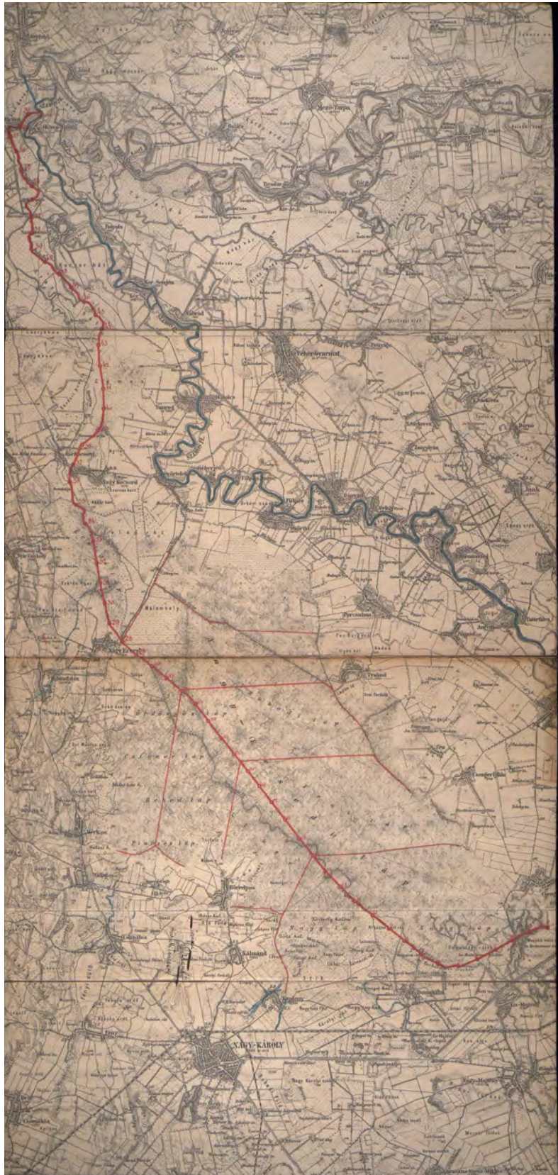
■ Az Ecsedi-láp lecsapolási terve, 1894 (MNL OL, S 118-528/1.)

ga. A kataszteri felmérések, a földadó-kataszter kiigazítása és a földadó kivetése nyomán több reformjavaslat is született, így például az országosan kötelező kataszteri kiigazítás gondolata a kisbirtokosság védelmében vagy a mezőgazdaság fejlesztése a kataszteri biztosok segítségével, akiknek a felméréseknél szerzett tapasztalatai a Földtani Intézetben (is) hasznosíthatónak tűntek. A túl magas földadó miatt annak ellenére is érkeztek panaszok, hogy azt a kormány az 1909.V. tc.-ben leszállította, és ennek következtében bevételkiesése keletkezett, amely az állami zárszámadások adataiból is kitűnik.