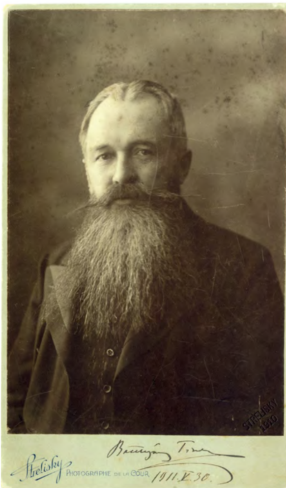
■ Némétújvári gróf Batthyány Tivadar (1859–1931) politikus, országgyűlési képviselő, 1917-ben és 1918-ban néhány hónapig a király személye körüli miniszter, 1918. október 31. és december 12. között belügyminiszter (MNM TF, 1585/1963)

Kovács Gyula általánosságban sérelmezte azt, hogy a földadó minden más adónál sokkal magasabb, ráadásul a földbirtokos az adóalapot eltitkolni sem tudja, miként történik az más foglalkozási ágaknál. 23 Hasonlóképpen vélekedett gróf Batthyány Tivadar (Tolna vármegye, Szekszárd) is, igaz, ő nem csupán a földadó, de minden más adó esetében is nehezményezte az