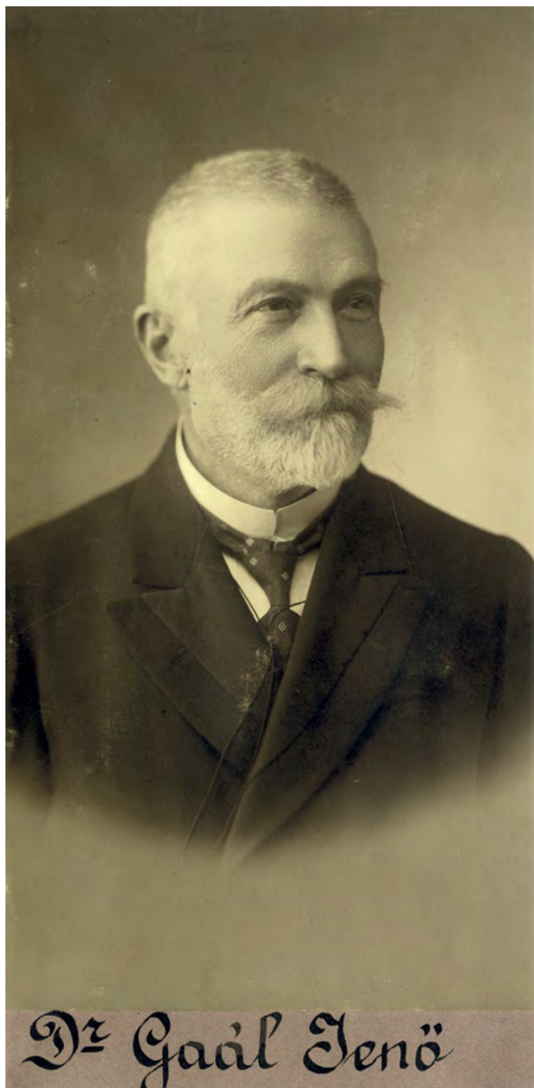
■ Gaál Jenő (1846–1934) közgazdász, jog- és államtudományi doktor, miniszteri tanácsos, műegyetemi tanár, politikus, az MTA tagja

szólalásban is előkerült. A Magyar Földhitelintézetek Országos Szövetségéről és az 1894.V. tc. némely rendelkezéseinek módosításáról, illetve kiegészítéséről szóló törvényjavaslat tárgyalása során Gaál Jenő, a főrendiház pénzügyi, közgazdasági és közlekedésügyi bizottságának tagja és előadója felvetette: „Milyen szoros összefüggésben vannak a telekkönyvek a kataszterrel! A kataszteri felmérések oly hátralekös állapotban vannak, hogy illetékes szak-