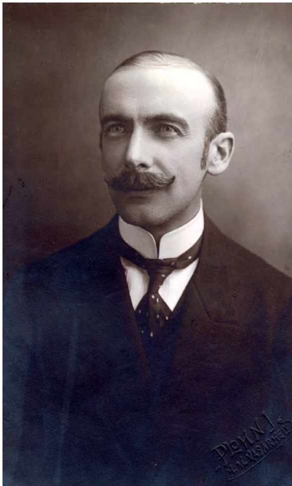
■ Kún Béla (1878–1954) újságíró, lapszerkesztő, főispán, Hódmezővásárhely kezdetben Justh-párti, majd kisgazdapárti országgyűlési képviselője (MNM TF, 2325/1951 16 )

Elsősorban a kisbirtokosokat szerette volna segíteni az országosan kötelező kataszteri kiigazításra vonatkozó javaslatával Bikádi Antal. Kidobott pénznek tartotta a pénzügyminiszter elnökletével létrejött országos földadóbizottság utazó küldöttségeit, és azt javasolta, hogy a kormány inkább rendelje el a kötelező