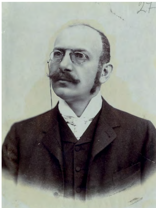
■ Sándor Pál (1860–1936) az Országos Magyar Kereskedelmi Egyesülés alapítója, 1910 és 1918 között a Nemzeti Munkapárt politikusa (MNM TF, 6643/1957)

állandó emelést: „Mindenütt, ahol legutóbb a kataszteri kiigazításoknál már keresztülvitték a kataszternek és ezzel kapcsolatosan az adóknak kiírását – még ott is, ahol új osztályozások történtek –, látom a kincstár részéről a felfelé való emelés tendenciáját, ami arra mutat, hogy a pénzügyi kormányzat nagy tervszerűséggel, ügyességgel és nagy szakavatottsággal el fogja érni azt, hogy az állam bevételei tetemesen fokozódni fognak. És itt kérem az igen t. miniszter urat, hogy a kereseti adónál és különösen a kisemberek földadójánál utasítsa közegeit, hogy túlbuzgóságukból egy kissé engedjenek, s egyúttal arra is kérem a miniszter urat, hogy vagy most, vagy máskor legyen kegyes az országot felvilágosítani arról, minő célokra szánja ezeket a kiadásokat.” 24 Sándor Pál (Budapest, V. kerület) sem hitt az adócsökkentésben: „Én nem úgy látom a helyzetet e tekintetben, amint a pénzügyminiszter úrtól vagy mástól hallottam,