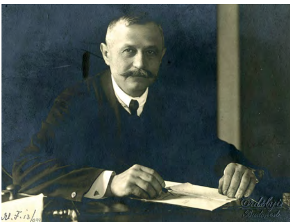
■ Nagyatádi Szabó István (1863–1924) az első országos magyarországi parasztpárt megalapítója, az első paraszti származású képviselő a magyar parlament történetében, 1919 augusztusában földművelésügyi miniszter