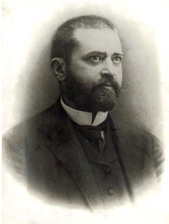
■ Teleszky János (1868–1939) jogász, pénzügyi szakember, 1913–1917 között pénzügyminiszter (MNM TF, 2439/1957)

helyezkednék, hogy ezeket a tartós esőzéseket ilyen károknak minősítsenék, amelynek címén adóelengedés adható, tulajdonképpen egy rendkívüli igazságtalanság követtetnék el, mert azok túlnyomó részének, akik ilyen kárt szenvedtek, nem adhatnánk meg, miután a bejelentési határidők elteltek és ma meg sem állapítható, hogy tulajdonképpen hol voltak e károsodások, és ott adnánk esetleg leengedést, ahol a károsodás kisebb mérvű volt, úgyhogy azt hiszem, hogy ilyen intézkedéssel a törvény intencióinak nem felelnék meg, másrészt pedig nem meglepő, hanem ellenkezőleg, inkább sok helyen elégedetlenséget idéznék elő.”