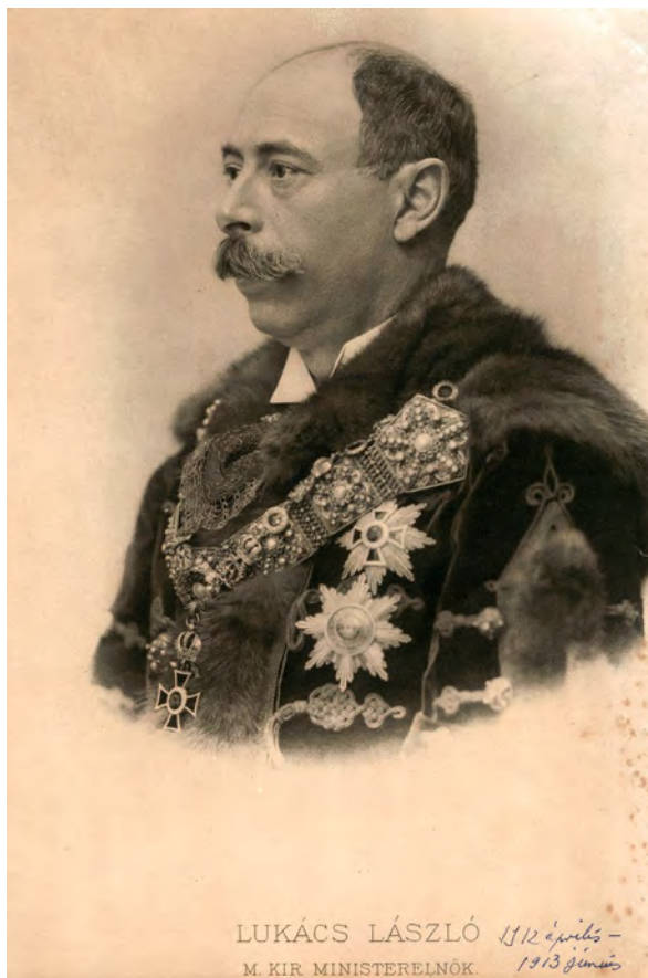
■ Lukács László (1850–1932) pénzügyminiszter 1895–1905 és 1910–1912, majd miniszterelnök 1912–1913 között

szólalásban is előkerült. A Magyar Földhitelintézetek Országos Szövetségéről és az 1894.V. tc. némely rendelkezéseinek módosításáról, illetve kiegészítéséről szóló törvényjavaslat tárgyalása során Gaál Jenő, a főrendiház pénzügyi, közgazdasági és közlekedésügyi bizottságának tagja és előadója felvetette: „Milyen szoros összefüggésben vannak a telekkönyvek a kataszterrel! A kataszteri felmérések oly hátralekös állapotban vannak, hogy illetékes szak-