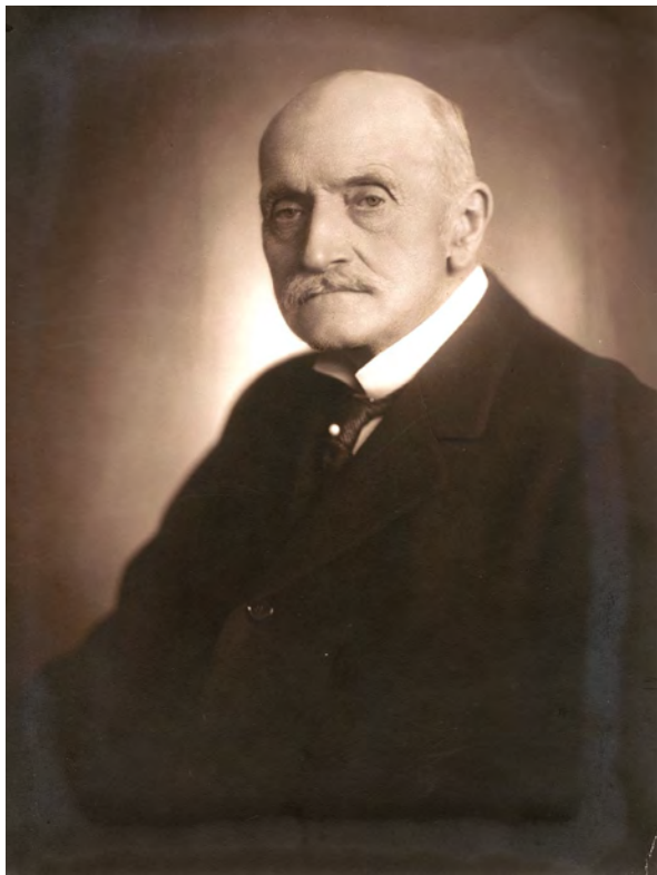
■ Dessewffy Aurél (1846–1928) a főrendiház tagja, 1917–1918 között országbíró