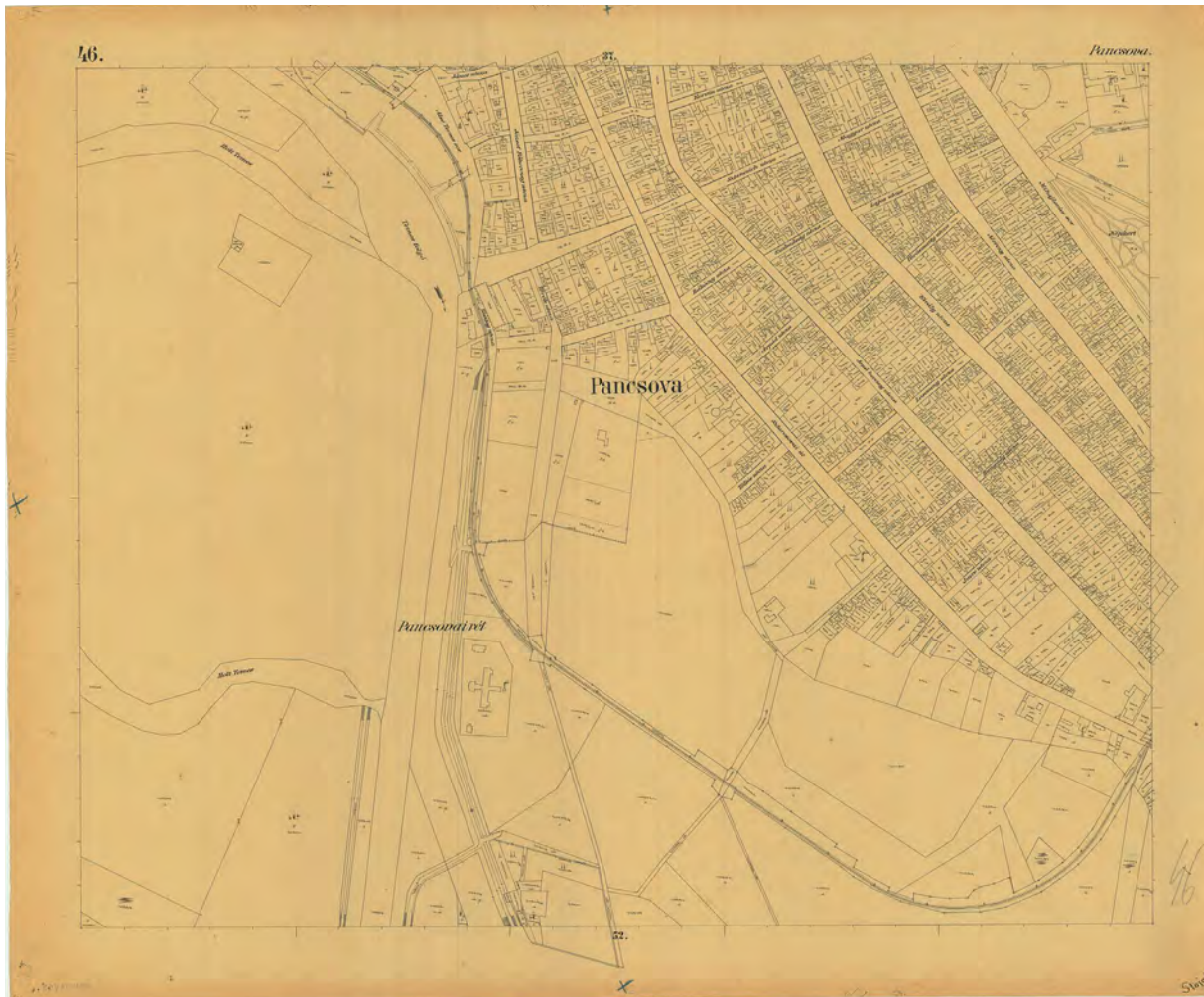
■ Pancsova Torontál vármegyei törvényhatósági joggal felruházott város kataszteri térképének másolata az 1902. évi mérnöki nyilvántartás szerint, 1902 (MNL OL, S 76-979/46.)

lett a közigazgatási személyzet nem tudta ilyen rövid idő alatt elvégezni, másrészt a törvények megalkotása után, különösen pedig azok végrehajtási utasításainak előkészítésekor olyan hibák és hiányosságok merültek fel, amelyek az egyes törvények alapelveibe ütköztek, ráadásul célszerűtlen voltuknál fogva egyébként is tarthatatlannak bizonyultak. 34