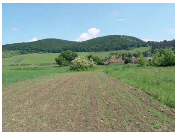
■ 4. Kettős Órhegy Bánfalván