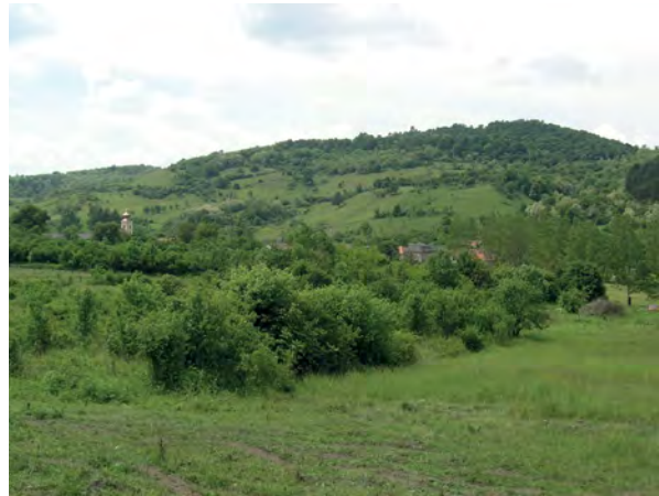
■ 2. Órhegy Sajómercsse mellett

Öt esetben a térkép szerkesztője a dűlőnév mellett földmérési jellel megjelölte és megnevezte a magaslati pontot is. Így történt Sajómercsse (1–2. kép), Alsószuha és Felsőtárkány esetében, valamint az Északi-Bükk hegyei között fekvő két falu, Borsodbóta és Sáta közötti határ közös pontjánál, mindkét település térképén. Alsószuhán a dűlő „Órhegy alja” neve, Sátán pedig a magaslat „Órhegy tető” neve bizonyítja azt, hogy nem azonos helyet írtak fel kétszer a térképre. 5