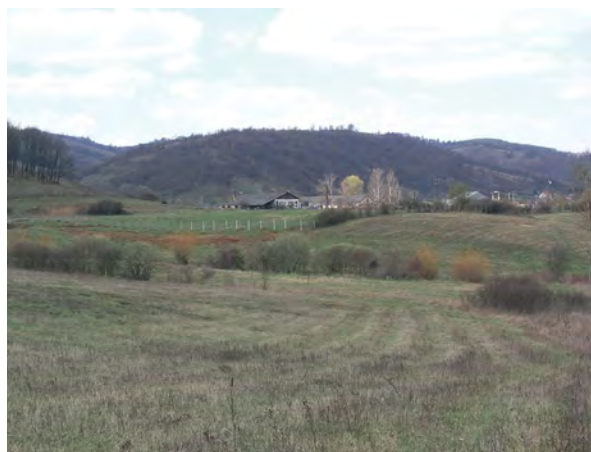
■ 16. Őrhegy Perkupa mellett

még két vármegye (Borsod és Gömör) közös határpontját jelölő különleges, egyedi magaslatnév az Őrhegyekhez hasonló eredetű volt és hasonló funkciót jelzett. 12