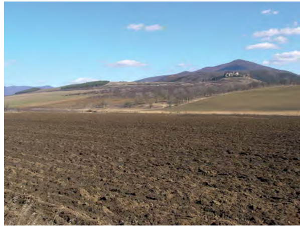
■ 10. Órhegy Boldogkőváralja és Arka határán