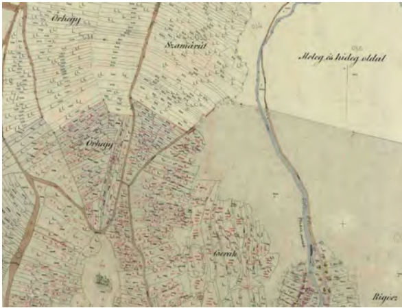
■ 9. Boldogkőváralja–Arka, 1867 (LTK)