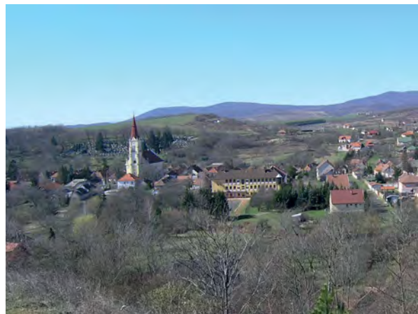
■ 12. Órhegy Cserépfalu mellett

egy-egy a két település területére esik, a határ vonala pedig a közöttük lévő mélyedésben húzódik. Boldogkőváralján erdős terület, Arkán kisparscellás szántóföldi dűlő kapta az Órhegy nevet. 9