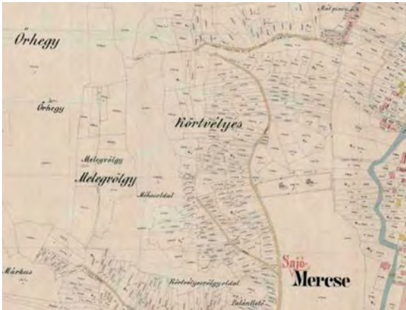
■ 1. Sajómercsse, 1891 (MNL OL, S 78 - 83. téka - Sajómercsse - 9.)