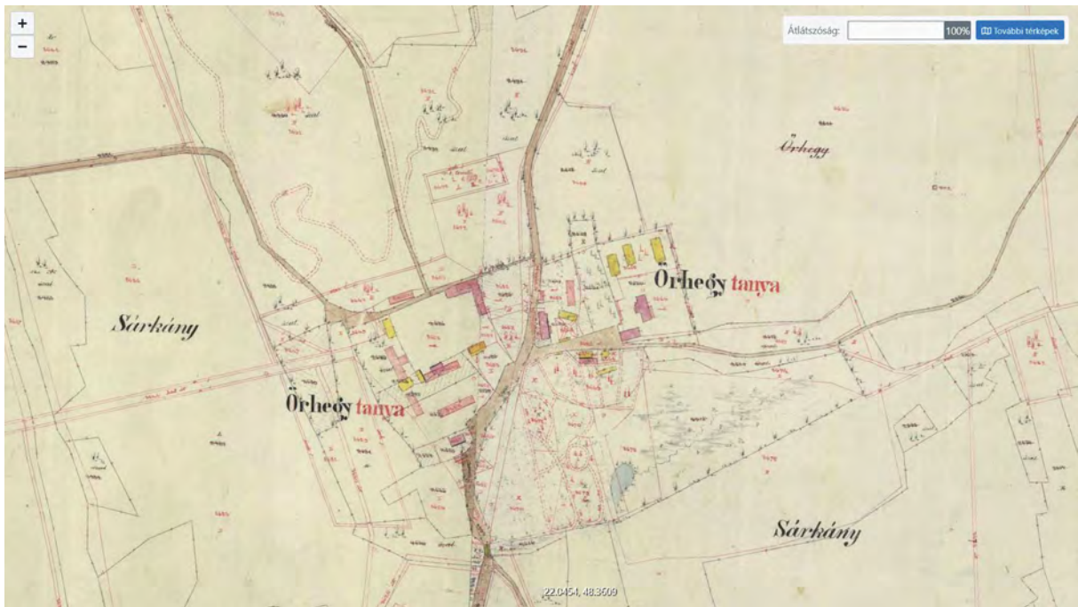
■ Órhegytanya Láca kataszteri térképén, 1866 (elérhető a www.mapire.eu oldalon, az eredeti szelvényt az LTK őrzi)

térképei a hadászati szempontokat előtérbe helyezve Órhegyként minden esetben kizárólag magaslatokat jelöltek. A kataszteri térképek, fő céljuknak megfelelően, a birtokhatárokat és a tájhasználatot mutatták be, aminek az azonosításához, a tájékozódáshoz fontos támpontot nyújtottak a dűlőnevek, ezért többségükre azok megnevezéseként kerültek fel az Órhegyek. A cikkben három észak-magyarországi megye Órhegy helyneveinek számbavételét térkép-kivágatokkal és néhány Órhegy magaslattal bemutató saját fotóval illusztráltam.