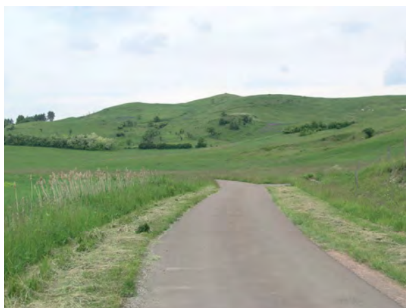
■ 6. Örhegy Borsodbóta–Sáta határán Sáta felől