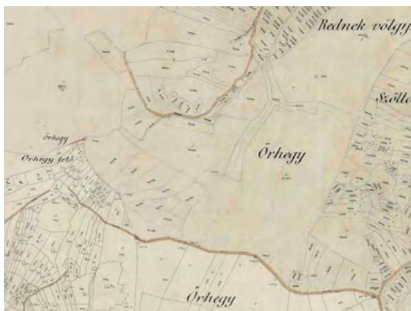
■ 5. Borsodbóta–Sáta, 1891 (MNL OL, S 78 - 84. téka - Sáta - 7., 73. téka - Bóta - 12.)