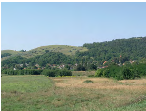
■ 14. Őrhegy Mikófalva mellett