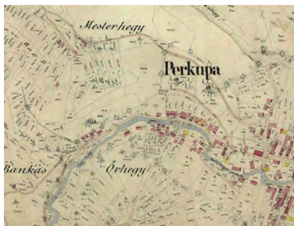
■ 15. Perkupa, 1868 (LTK)