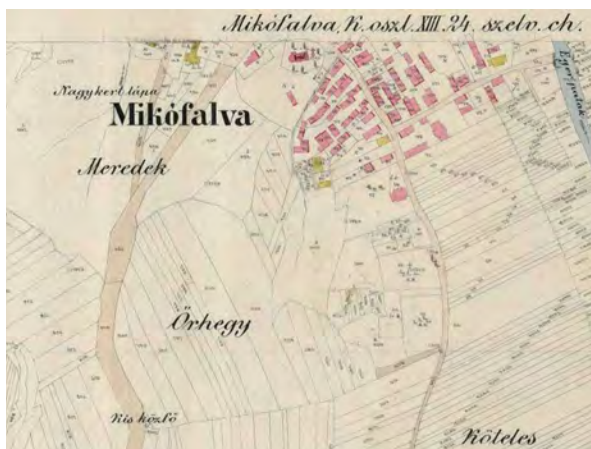
■ 13. Mikófalva, 1888 (MNL OL, S 78 - 120. téka - Mikófalva - 5.)