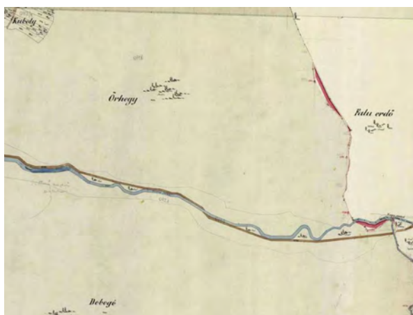
■ 7. Gönc–Telkibánya, 1867 (LTK)