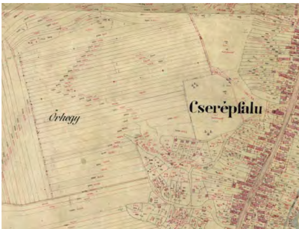
■ 11. Cserépfalu, 1888 (LTK)