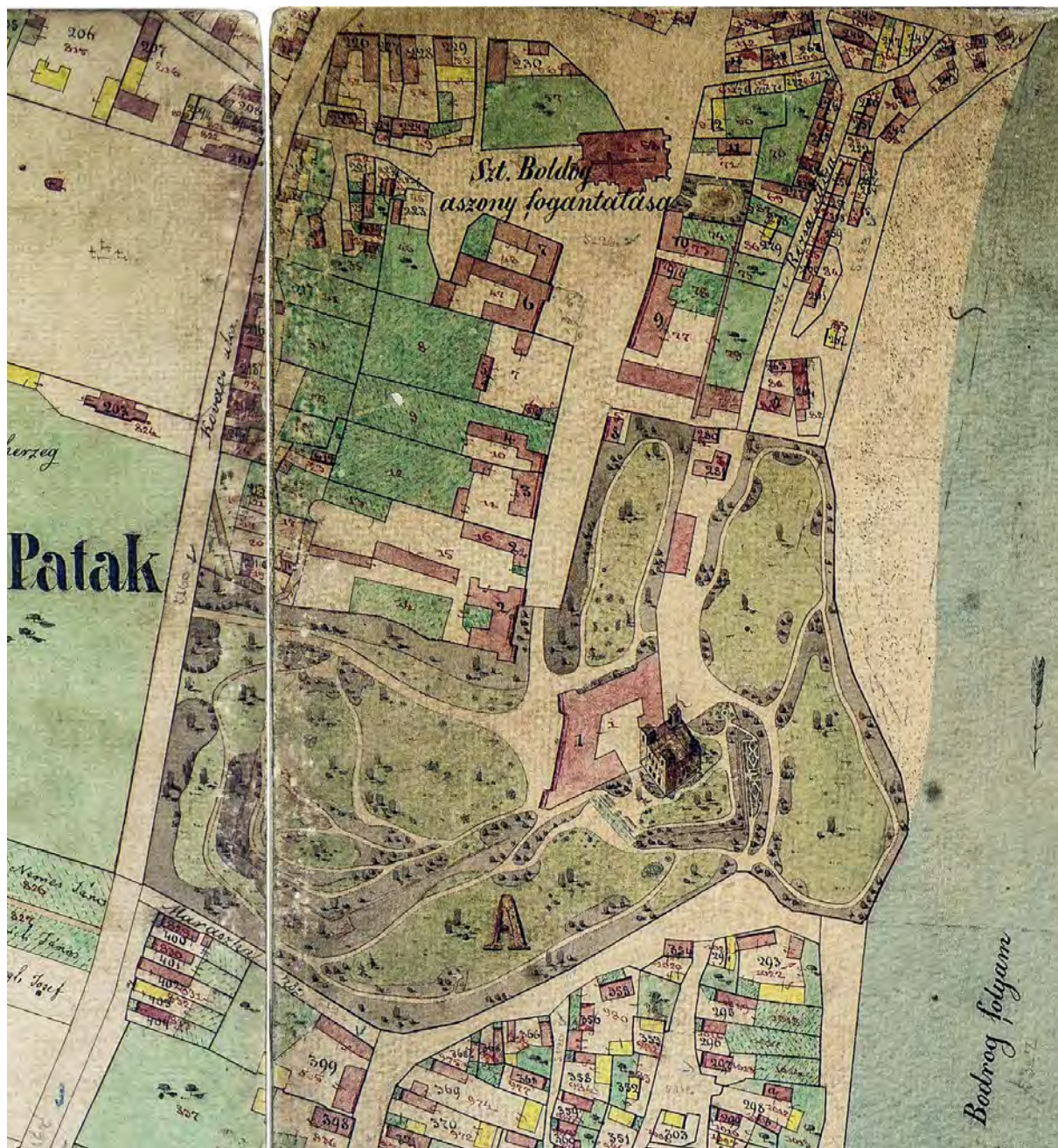
■ Sárospatak belterületének részlete, a Várkastély és tágabb környezete az 1866. évi kataszteri birtokvázlaton