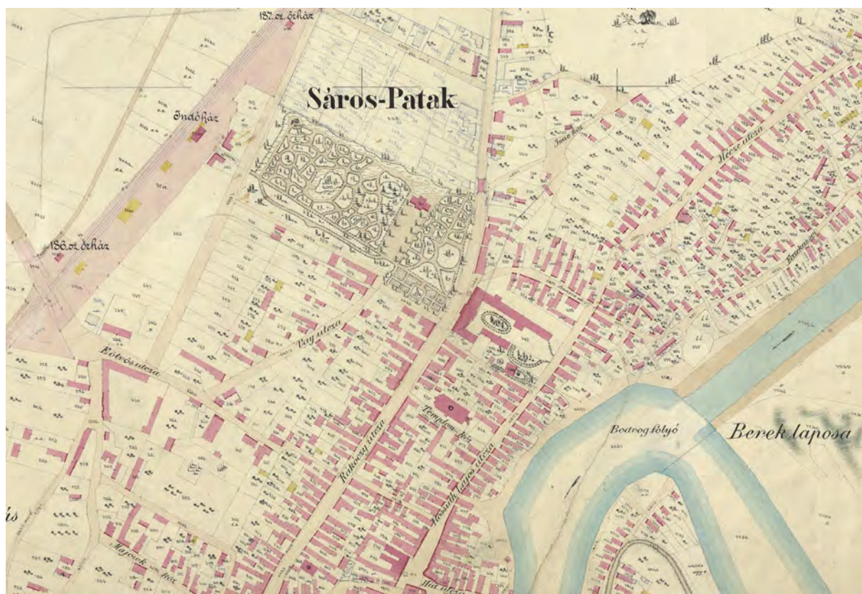
■ Sárospatak belterületének északi része az 1896. évi új kataszteri térképen (LTK)

nyílt. A kapuköz déli oldalán az ötvenes évek végén helyreállított lőréses védőfolyosót tártak fel, állítottak helyre. A kapuköz nyugati oldalát a templom végfala zárta. A templom falában is kőkeretes lőréseket alakítottak ki, ahonnan a kapuközt szintén védőtűz alá vehették. (A kapuköz keleti oldalát még nem tárták fel.)