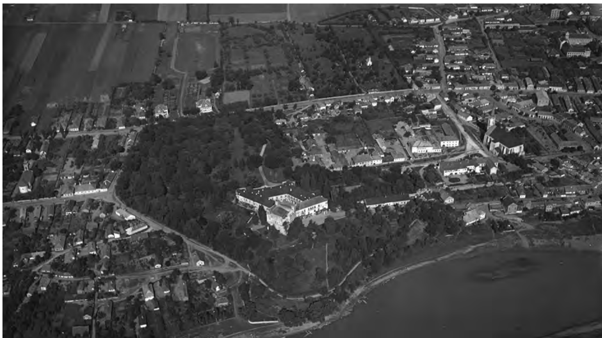
■ Sárospatak, a Várkastélynak és a középkori városnak az 1540-es években befejezett erődítés falai közé foglalt részéről keleti irányból készített korai légi fénykép. Különösen jól látszik, hogy a Vizikapu körül megőrizték az erődítés falának eredeti magasságát. Jól kivehető az északkeleti sarokbástya rejtett tömbje

A Várkastély délnyugati sarkától az Olaszbástyára másodlagosan épített átjáró szélességével azonos az ábrázolás mérettévesztése. Ennek a járatnak az utolsó rövid szakasza a Lorántffy-erkély alatt még az 1960-as évekig állt. Egy ajtót védett, amely a hajdani üvegházba vezetett a Várkastélyból.