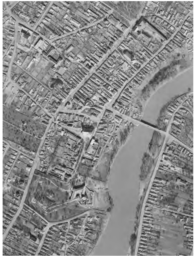
■ Sárospatak légi felvétele 1965-ből. A Várkastély, a középkori város erődített déli része és a csak sánccal védett északi, a Szemere utca és a Görbe utca külső telekvégeiig terjedő, északi negyede jelenik meg előttünk. A város úti település jellegét meggyőzően tükrözi. Az 1866. évi birtokvázlathoz nagyon hasonló települési viszonyokat látunk. Az északkeleti sarokbástya körvonala a tökéletes körülépítés ellenére is jól látszik. A Szent Erzsébet utca nyugati oldalán épült házak kertjeiben a várfalat kiegészítő földsánc maradványait megörökítette a légi felvétel

Várkastély északi végétől kissé távolabb, már a külső erődítés fala elé építették. Nagyobb, színtelen, vörös színű téglalap jelzi. A hercegi birtok határán belül még két kisebb épületet rögzített a felmérés 280. és 281. házszám alatt. Ezek a hercegi udvartartáshoz tartozó személyek lakásául szolgáltak. A 280-as házszámú épület északi falsíkjánál ábrázolta felmérőnk a kora újkori, erődített városmag védőfalának egyetlen, szekerezésre alkalmas kapuját, amely a gyalogkapujával együtt szerencsénkre ma is áll. A helyi köznyelven Vizikapu, régeb-