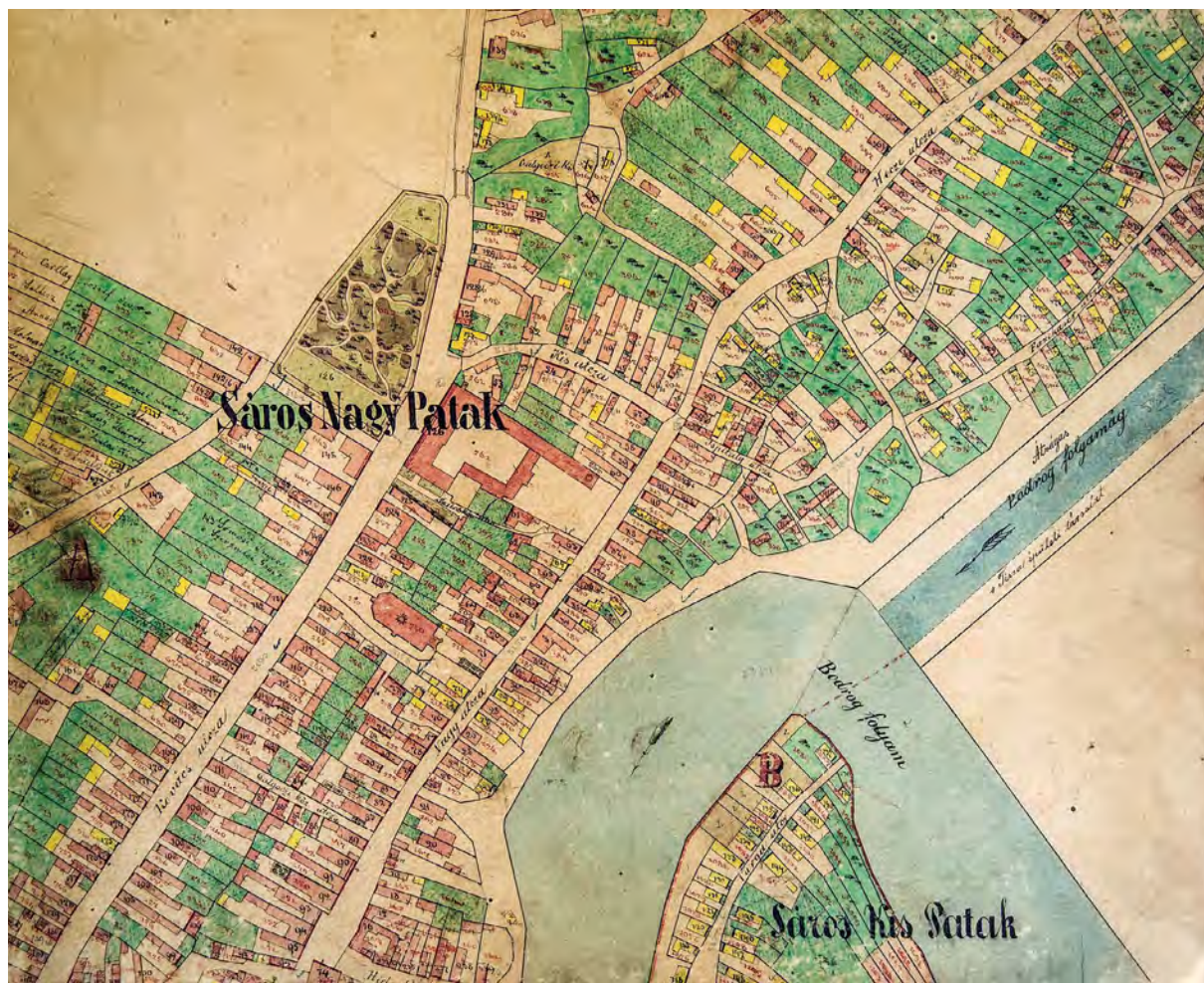
■ Sárospatak belterületének északi része, a Nagy utca és a Héce utca az 1866. évi birtokvázlaton

Sajátos, hogy az 1896. évi térkép a hercegi tulajdon határát még a Bodrog sodorvonaláig is határozottan kijelölte (203. hrsz.).