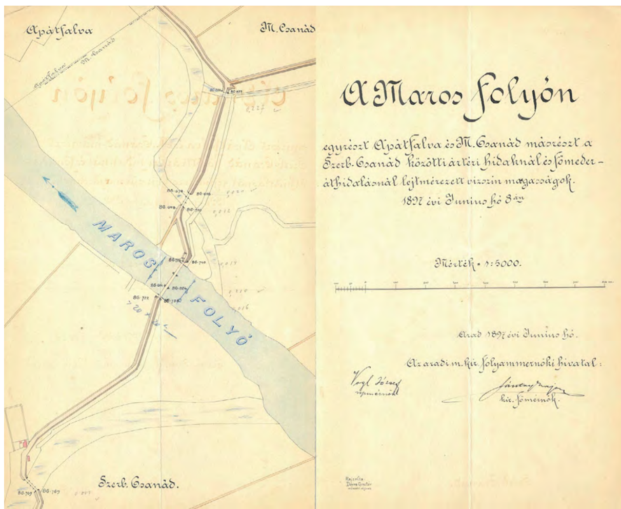
■ A Maros térképe Apátfalva, Magyar- és Nagycsanád környékén. Rajzolta Dörre Gusztáv műszaki díjnok, 1897 (MNL OL, S 118 - No. 555.)

dapest, 1950. 02. 04.) térképet is szerkesztett. A Magyarország néprajzi térképe című, 1:900 000 méretarányú térkép 1920 körül Klósz György és Fia, valamint a Társadalmi Egyesületek Szövetsége kiadásában is megjelent. 8