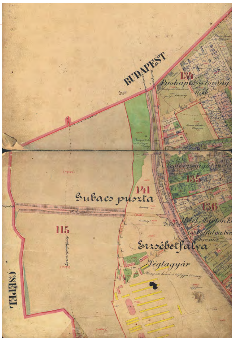
■ Dörre Henrik: Soroksár birtokvázlatának részlete, 1882 (MNL OL, S 78 - Pest m. - Soroksár 1882 - 1.)