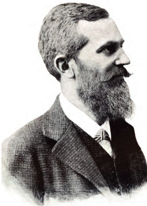
■ Smialovszky Valér (1854–1917) ügyvéd, Trencsén vármegye főispánja, szabadelvű párti politikus

egész országban egyformán tévesen értelmezik a törvényt, mindig az adózó kárára s a kincstár hasznára. [...] a kitevés úgy történik, hogy a becslőbiztos átadja a munkálatokat a községi elöljáróságnak, amiről rendszerint senkinek sincs tudomása; vagy ha van is, valóságos szakstudium kell ahhoz, hogy valaki ott eligazodjék. Ritkán tudhatják meg, melyik földbirtokot éri változás, és mennyi adótöbbletet eredményez az. Legnagyobb baj az, hogy a közszemlére nem teszik ki a kataszteri térképeket. Enélkül pedig a kataszteri számok ezernyi tömkelegében lehetetlen eligazodni. Ezért azután a legkevesebben élhetnek föllebbezési jogukkal, s a közönség csak a nagy ködöt látja, melyben szépen eltűnnek a becslési munkálatok, s a köd elmúltával nem az igazság verőfénye derül fel, hanem az ötéves pótkivetés képében megjelenik egy törvénytelen