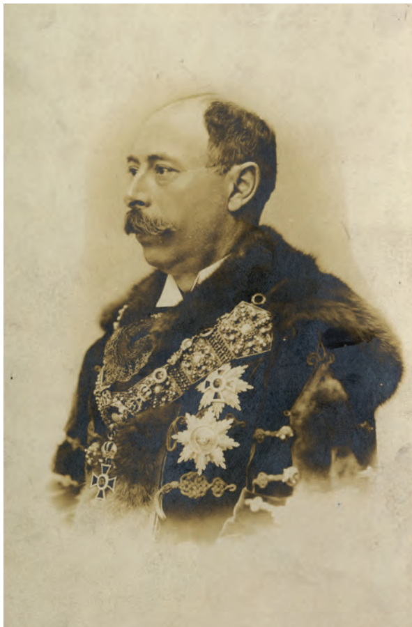
■ Lukács László (1850–1932) jogász, zalatnai bányatulajdonos, pénzügyminiszter

zetük és különösen a kataszteri biztosok révén minden egyes község egyéni birtokíveit a kataszteri birtokívekkel összehasonlítsák és ahol különbséget találnak, korrigálják. A pénzügyigazgatóságok a hiányok pótlásával azonban már nem foglalkoztak, hanem az amúgy is túlterhelt községi jegyzőre hártották azt. Wekerle válaszában elmondta, hogy a pénzügyigazgatásban kevés emberrel dolgozik, és mivel ezek máshol voltak lekötöttek, a pénzügyi adminisztrációban legkevésbé hangsúlyos területet, a kataszteri nyilvántartást mellőzték.