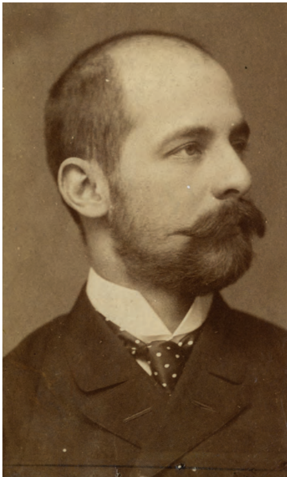
■ Teleki József (1859–1945) főrendiházi tag, szabadelvű párti politikus

átvétele ellenében az államkincstár állta, így csökkentve azon költségeket, amelyek kizárólag a tagosítás által érdekelt felekre nehezedtek. Ekképpen a hitelesítő mérnökök feladatait az állandó kataszter közegei vették át. A törvényjavaslat végül az 1892:XXIV. törvényciként emelkedett jogerőre. 27 A képviselők nem csupán Erdélyben, a Felvidéken is igyekeztek sürgetni a felmérések ügyét: Smialovszky Valér (Trencsén vármegye, Zsolna) felszólalásá-