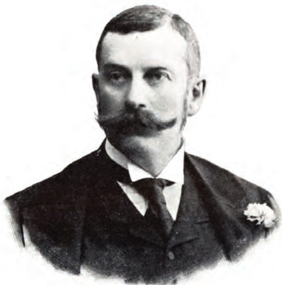
■ Szemere Huba (1865–1925) földbirtokos, lapszerkesztő, függetlenségi párti politikus

Szemere Huba (Szilágy vármegye, Zilah) szóvá tette a középbirtokosság érezhető fogyását, amelyet véleménye szerint a kataszteri felmérések is tükröznek, hiszen a régebbi munkálatok több kis- és középbirtokot mutatnak, míg az utóbbi időben csak a latifundiumok