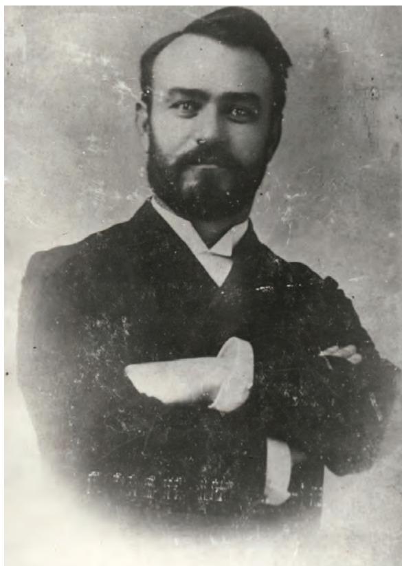
■ Sima Ferenc (1853–1904) újságíró, az 1892–1897. évi országgyűlési ciklusban függetlenségi párti politikus

Issekutz Győző (Kisküküllő vármegye, Erzsébetváros) szerint a földadó ezt a célt nem teljesítette. A képviselő a hibás kataszteri felméréseket okolta az indirekt és az egyenes adók kivetése mellett az egyes vidékek közti jelentős eltérés és a közteherviselés elmaradása miatt. Hasonló szellemben nyilatkozott Horánszky Nándor (Abaúj-Torna vármegye, Szepsi), aki