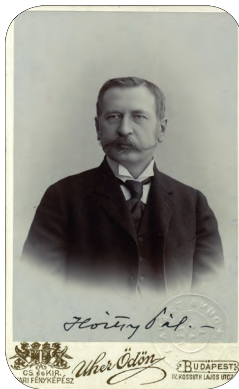
■ Hoitsy Pál (1850–1927) hírlapíró, csillagász, szemészorvos, függetlenségi képviselő

vetették ki azt. Miután megállapította, hogy az új kataszter még az abszolutizmus koránál is rosszabbul sikerült, azt indítványozta, hogy a képviselőház nevezzen ki egy szakbizottságot, amely a pénzügyigazgatás és államháztartás gyökeres átalakítására javaslatot dolgoz ki. 15