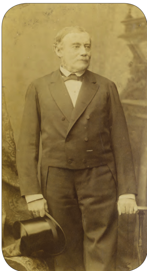
■ Fabiny Teofil (1822–1908) jogász, igazságügy-miniszter (1886–1889)

rendes telekkönyvi betétekké való átalakítása, másrészt ezzel kapcsolatban a földadókönyvvel és a kataszteri munkálatok adataival való kiegészítése és ennél fogva egyrészt a jogbiztonság megállapítása, másrészt az ingatlan hitelképességének emelése.” Mohay Sándor (Gyulafehérvár város) felszólalásában örömmel fogadta a törvényjavaslatot, ám egyúttal sajnálatát is kifejezte amiatt, hogy a rendezés a bányabirtokokat és így a bányatelekkönyveket nem érinti, pedig ezek adminisztrációja is hanyagul volt vezetve.