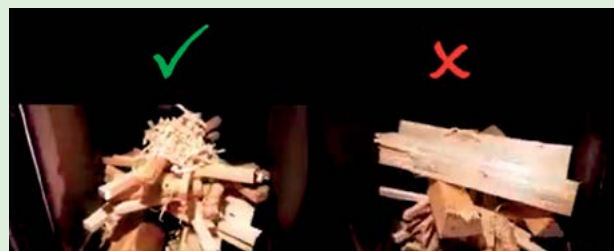
Helyes és helytelen tűzrakás

Tűzifa kiválasztását követően fontos odafigyelni a nedvességtartalomra. Az ideális, légszáraz tűzifa nedvességtartalma 20% alatt van (1 évnyi száradás ajánlott). Ha nedves fát tüzelünk el, az gazdaságtalan és környezetkárosító is egyben, ugyanis az fele annyi hőt biztosít számunkra, mint a száraz társa. Javasolt hasított állapotban szárítani a fát, mivel így érintkezik a lehető legnagyobb felületen a fa a levegővel, így a száradás gyorsabban megy végbe. A fát ideális esetben jól szellőző és esőtől védett helyen érdemes tárolni. Semmiképpen ne fóliázzuk le teljesen (az oldalakat hagyjuk szabadon), mert befülled, és korhadni kezd. Ezt követi a begyűjtés. A régi gyakorlattal ellentétben a helyes tűzrakás módja a felülről lefelé történő égetés. Alulra helyezzük el a vastagabb hasábokat majd rá a vékonyabb ún. gyújtósokat. Ügyeljünk arra, hogy a hasábok között hagyjunk pár cm távolságot, ezáltal megfelelő lesz a levegő áramlása a tűztérben. Soha nem szabad teletsúfolni a tűzteret. Ennek a begyűjtési technikának az a nagy előnye, hogy a bekészített tűzifa nem egyszerre fog leégni, hanem fokozatosan, így elkerülhető a hirtelen nagy mennyiségű fagáz és ezzel együtt a nagy mennyiségű füst keletkezése. Ha alulról gyűjtünk be, akkor az induló láng az összes berakott tűzifát begyűjti egyszerre, így az nem tud felmelegedni, s sokkal később éri el a környezetkímélő, jó hatásfokú égéshez szükséges, magas hőmérsékletet.