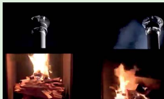
Különbség a két kemény között

A helytelen tűzrakás következménye a nagy mennyiségű füst. A füstben található ultra finom szálló részecskék pedig a szervezetbe jutva súlyos egészségügyi problémákat okozhatnak.