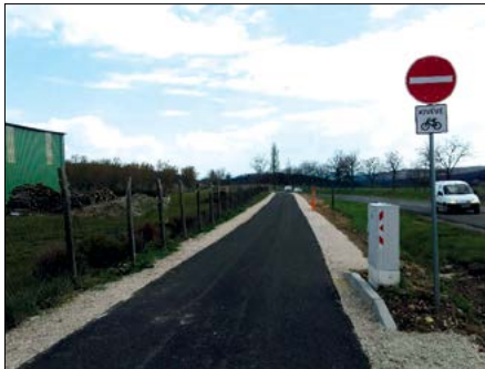
„Behajtani tilos” tábla, „kivéve kerékpár” a falu elején