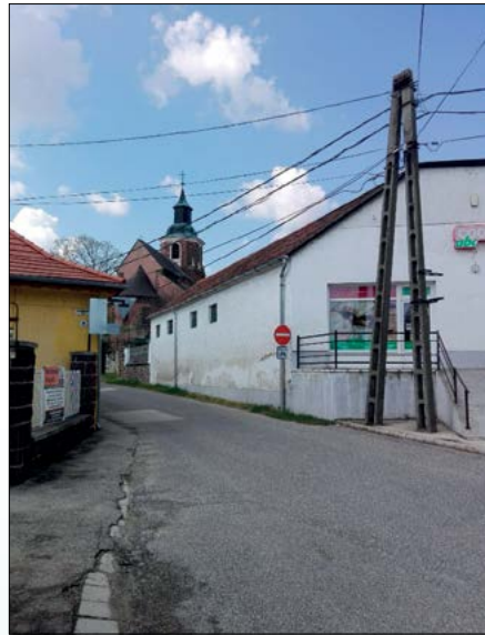
„Behajtani tilos” tábla, „kivéve kerékpár” a boltnál