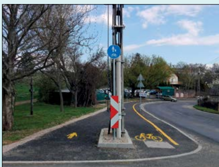
Szétválik a járda és a bicikliút a temetőnél