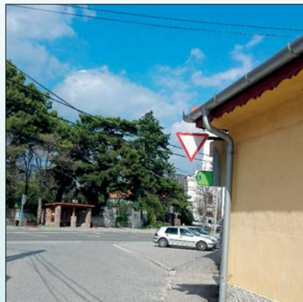
„Elsőbbségadás kötelező” a boltnál