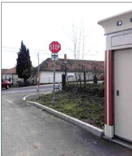
„ÁLLJ! Elsőbbségadás kötelező” (Stop) tábla a bicikliút miatt a temetőnél