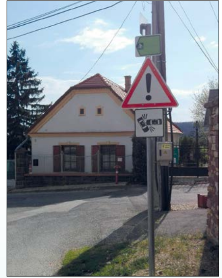
„Vigyázat, ütközésveszély!” a katolikus templom sarkánál a Körmenty utcában