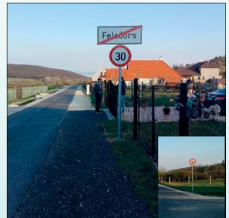
30-as tábla a Miske utca-Hamuház köz sarkánál, ill. a Csiker utcánál a Balaton felé