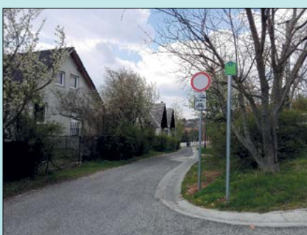
„Mindkét irányból behajtani tilos” tábla, „kivéve kerékpár” a Petőfi utca tetején