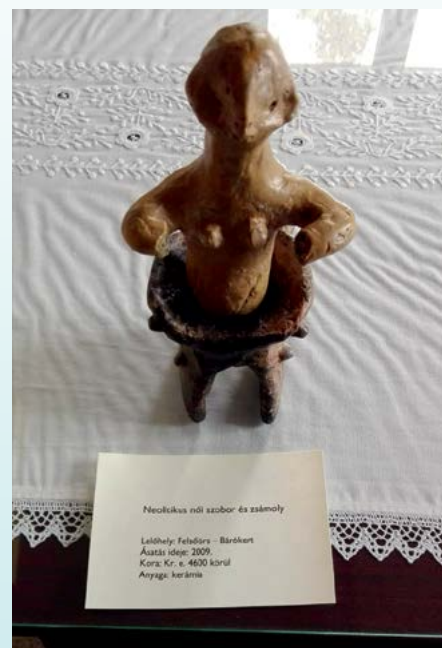
Termékenységi szobor és számoly Kr. e. 4600 körül, ásátás éve: 2019.

TEVESZ MÁRIA, MŰVÉSZETTÖRTÉNÉSZ LACZKÓ DEZSŐ MÚZEUM