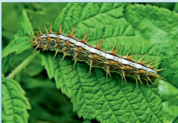
Málna-gyöngyházlepkék hernyója táplálkozás közben hamvas szedren