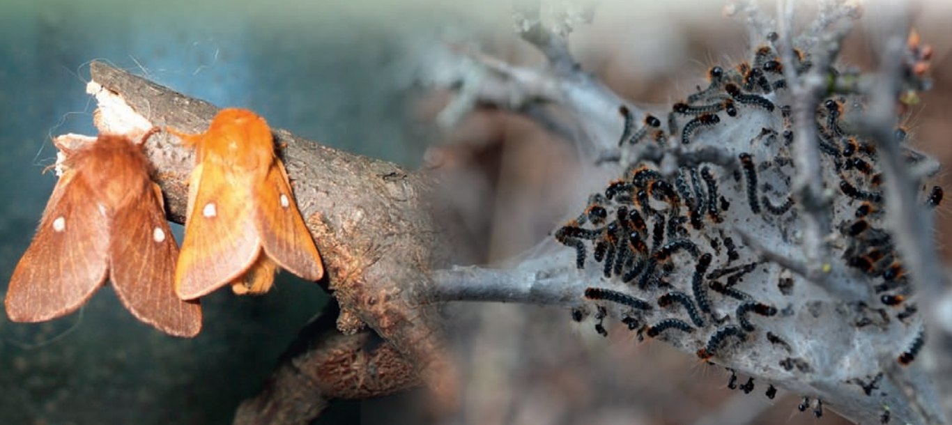
2. ábra: Felsőörs határában egy kőköny bokron talált szövedék