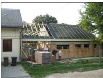
2014. augusztus 13.