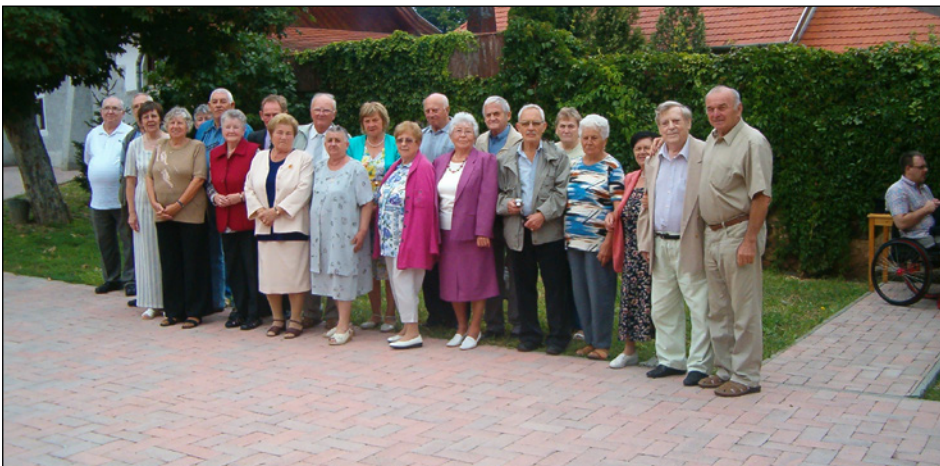
A találkozó résztvevői