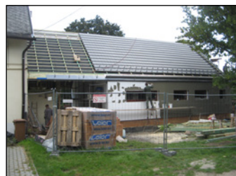
2014. augusztus 28.