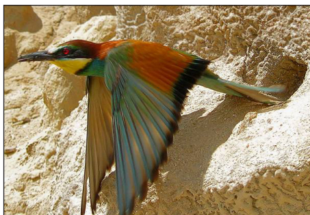
Költőüregből kirepülő gyurgyalag

A gyurgyalagok kolóniákban élnek és meredek homok- és löszfalakba fúrnak költőüreget a hosszú csőrük segítségével. A költőüreg hossza akár a 2 métert is elérheti, hogy a róka ne tudja kikaparni a fészket. Így költési időszakban egy nagyobb kolónia közelében a „paparazzók” nagyon szép képeket tudnak készíteni a gyurgyalagról. Ha a fiókák elég nagyok, akkor kimennek a költőüreg bejáratához és ott várják a rovarokat (szitakötők, lepkék, darazsak, méhek, stb.) hozó szüleiket, ami a fotózásukat nagyban megkönnyíti.