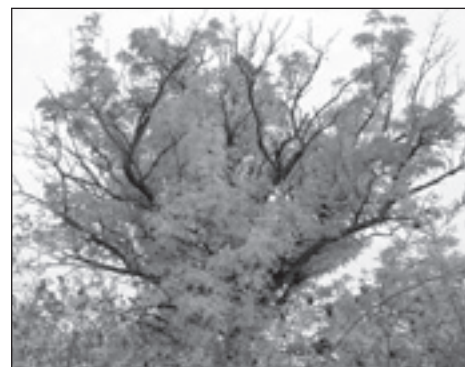
Felsőörs pusztuló berkenyefája, a Vadrózsa utca „vad rózsája”

Az egyik pusztuló felsőörsi berkenyefa a Vadrózsa utca legvégén található. Ennek a fának a megmentését, pusztulásának késleltetését a tulajdonos hozzájárulásával ebben az évben kezdjük el a fa tövének kigyomlálásával.