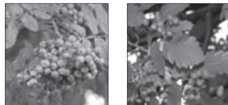
Madárberkenye és a svéd berkenye termései

Mielőtt boldog berkenyegazdaként tömegeesen megrohmozom a polgármesteri hivatal, fontos tisztában lenniük, hogy a kertjükben található fa tényleg házi berkenye-e. A fáiakolákban kapható berkenyék főleg a díszfának ültetett svéd vagy madárberkenye. Ezek nagyon elterjedtek. Felismerésükben a levélzet és a termés segíthet (ld. alábbi ábra). A fő különbség, hogy a házi berkenye termése jóval nagyobb, ami az almára vagy a körtére hasonlít.