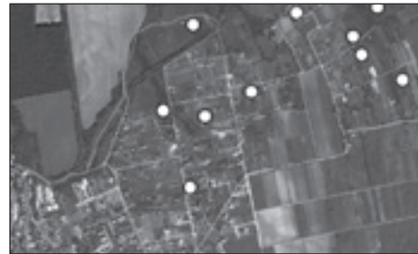
Kerti berkenye ( Sorbus domestica ) felsőörsi előfordulásai

A felsőörsi házi berkenye-állomány teljes nagysága még nem ismert, s így folytatni kell e ritka fafaj felkutatását. Ebben a helyi gazdák segítségét is szívesen fogadjuk, s mindenkit arra buzdítunk, hogyha a telkén van ilyen fa, akkor azt továbbra is gondozza, s őrizze meg az utókor számára. Továbbá ossza meg a faluval a fa fellelési helyét, hogy egy komplett berkenyeterkép születhessen! Sajnos az utóbbi évek változó időjárása nem tett jót berkenyéinknek. A Főszőlőkben sajnos több fa is elpusztult az elmúlt években. Ez is azt indokolja, hogy próbáljuk megmenteni, ami még megmenthető.