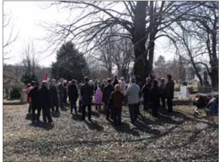
Gyertyagyújtás a honvédsíroknál

Mindig is szerettem március 15-e ünnepét. Nemcsak azért mert munkaszüneti nap, így iskolába sem kellett mennem,