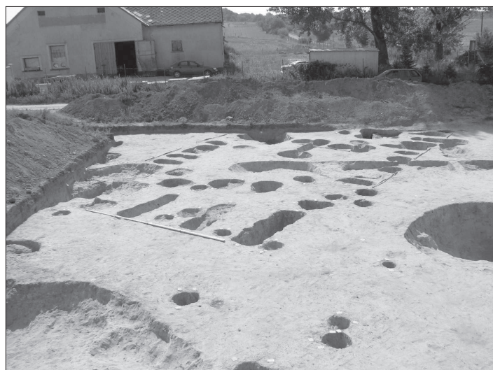
Az ásatás helyszíne