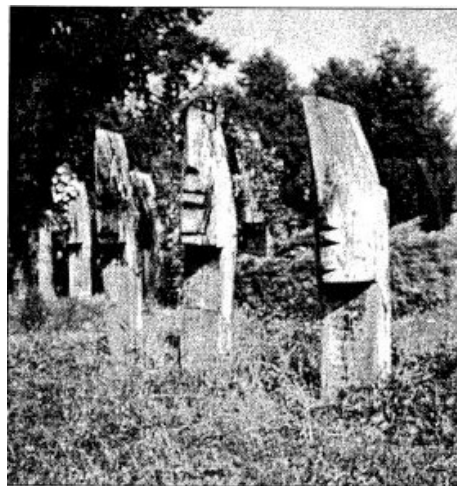
Csónakfejfás temető Szatmárcseken (Szabolcs-Szatmár-Bereg megye)

A temető előtti téren fából faragott emlékmű áll, ahol a kegyelet virá-