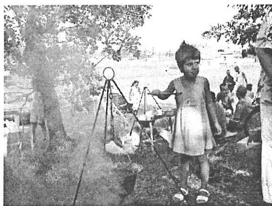
Főzőcske a sportpályán