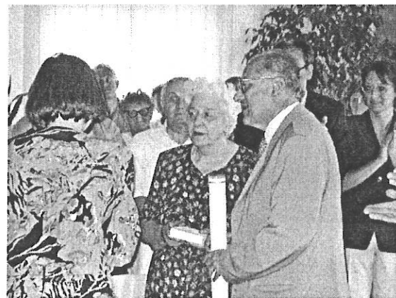
Gáty Ferenc díszpolgár örökösei