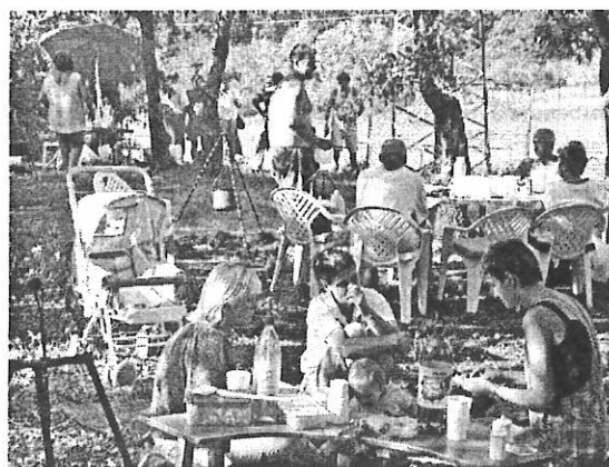
és piknik a családdal