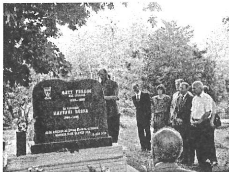
Gáty Ferenc sírjának koszorúzása