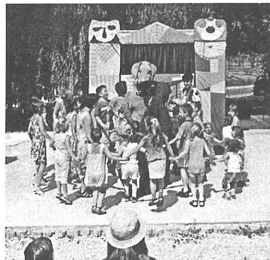
Közös játék a Fabula bábszínházzal