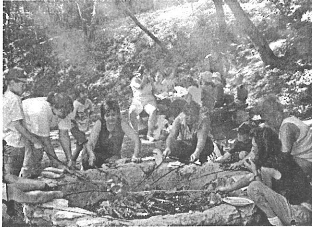
Iskolai kirándulás és szalonnasütés a Király-kútnál.