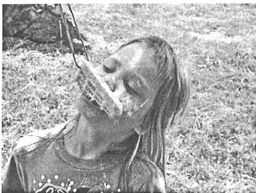
Porcukros gofri evés madzagról