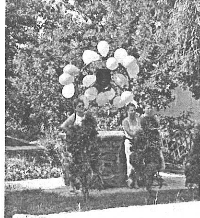
Ünnepi díszben a Főkút