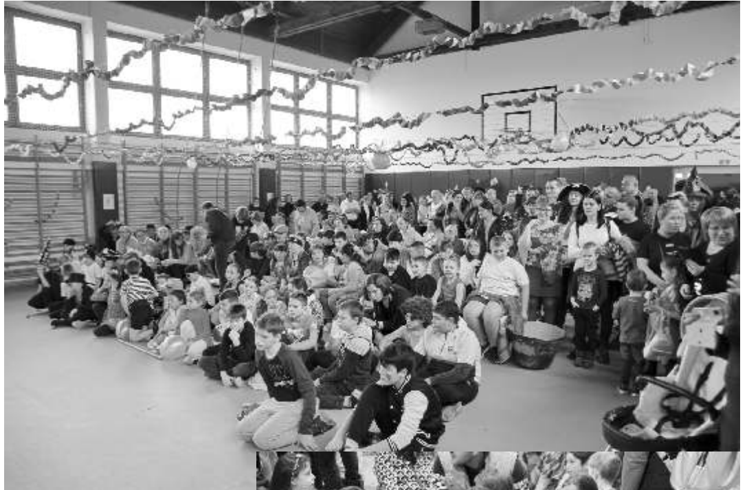
Ettől a farsangtól biztosan messzire menekül a tél. Egy biztos, rajtunk nem múlt!

A jókedv töretlen volt, a programok változatosak! Az estig tartó tánc, a tombolasorsolás, a zsákbamacska, az osztálytörték felvágása mellett - a szülők segítségével - a büfé a rendezvény végéig finom falatokkal várta mindenkit.