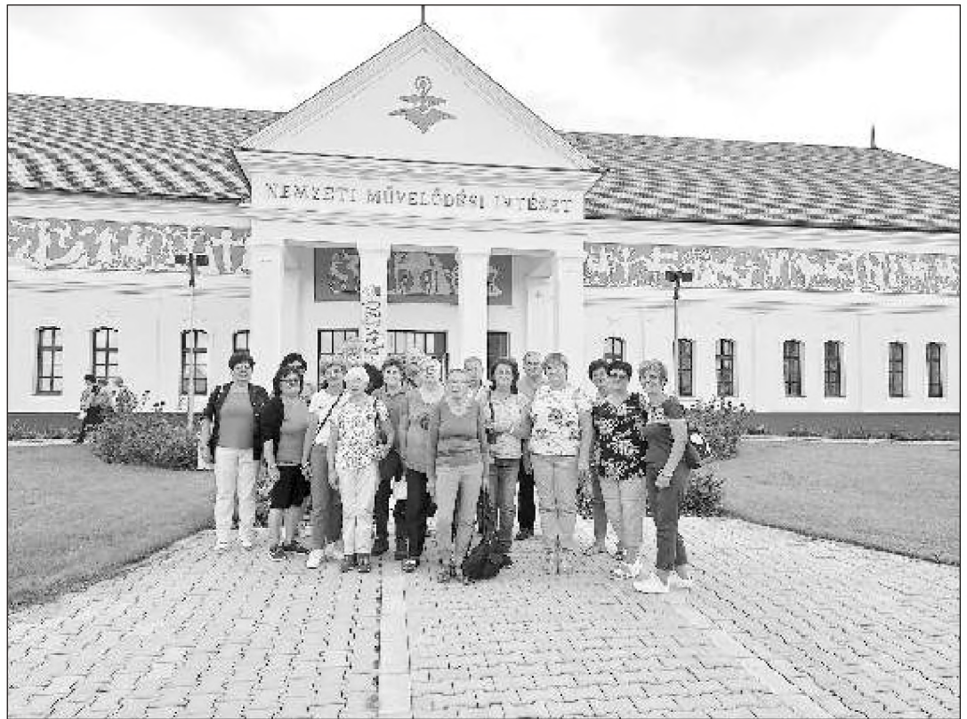
A Mai-Nők és a Nyugdijas klub közös kirándulása.

"Életet az Éveknek" Veszprém Megyei Egyesület a II. Senior Művészeti Gálát november 11-én az Agórában rendezte. 18 csoport mutatta be színvonalas műsorát.