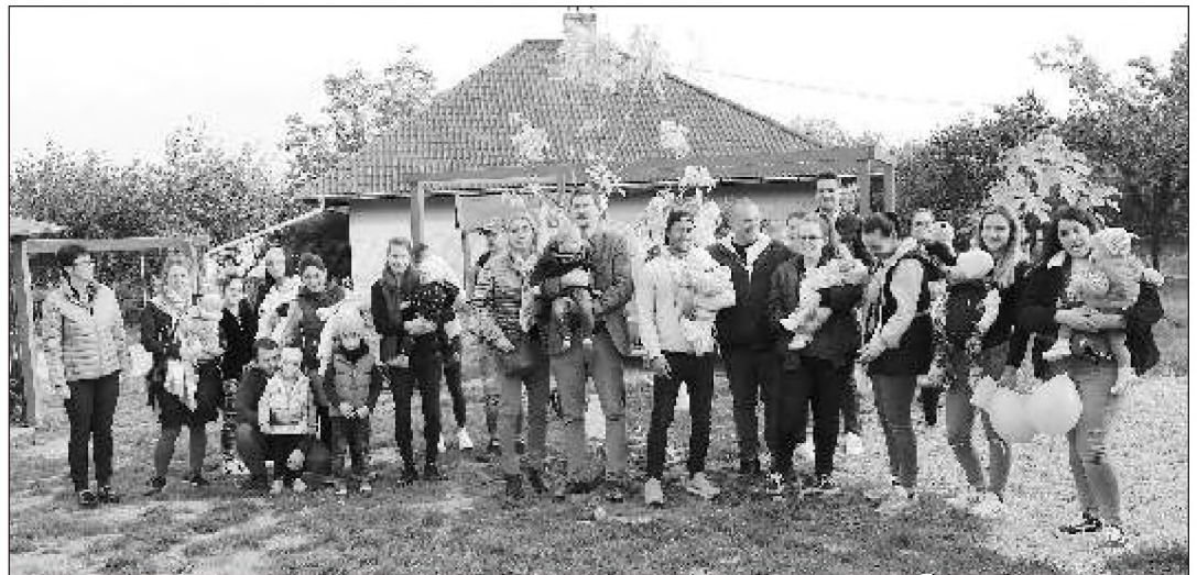
Újszülöttek fájának elültetése az óvoda udvarán.