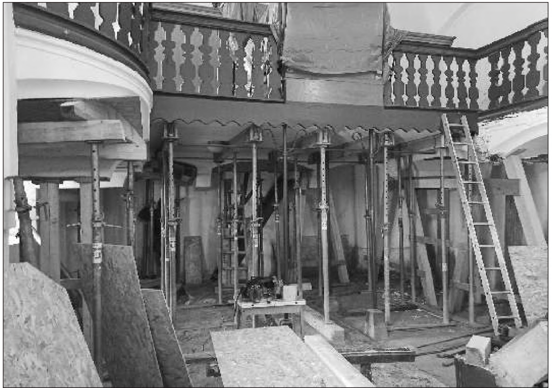
A szentesti istentisztelet helyét meghatározza, hogy a reformá-