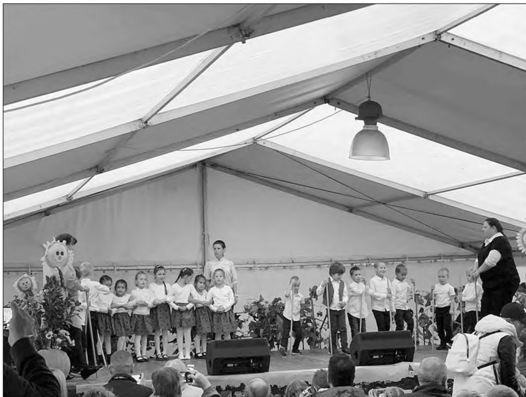
Szüretelő Falunap keretében, nagycsoportos óvodásaink felléptek