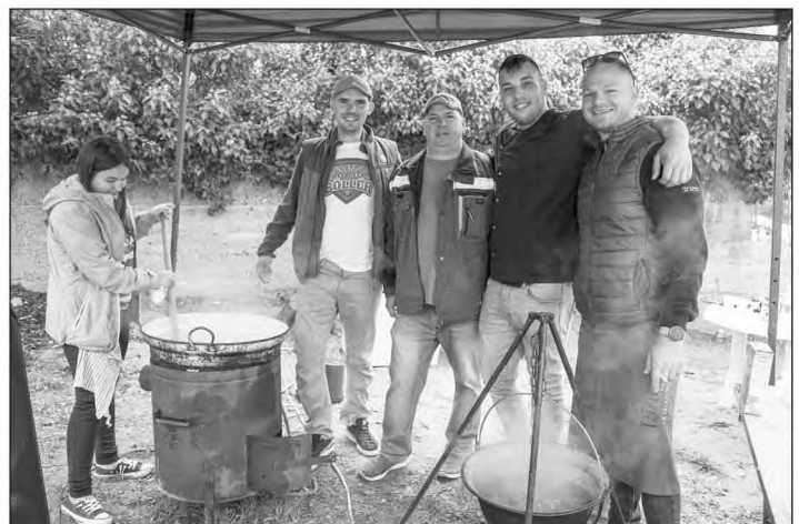
Különdíjat érdemelt a Vörös Hús csapata