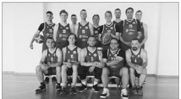
A csapat tagjai balról jobbra:

A 2020/2021-es kiírásban a Veszprém Megyei Kosárlabda Szövetség Megyei Bajnokságának alapszakaszát megnyerte, és a rájátszásban a dicsőséges 2. helyen végzett a START Sportegyesület férfi kosárlabda-csapata.