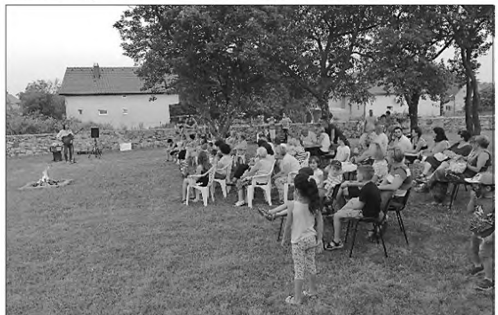
Szent Iván éji mulatság

Június 23-ra terveztük és meg is valósítottuk a Szent Iván éji mulatságot! Este 8 órai kezdettel vártuk az érdeklődőket, ünnepi fényekbe öltöztetve a Nem-