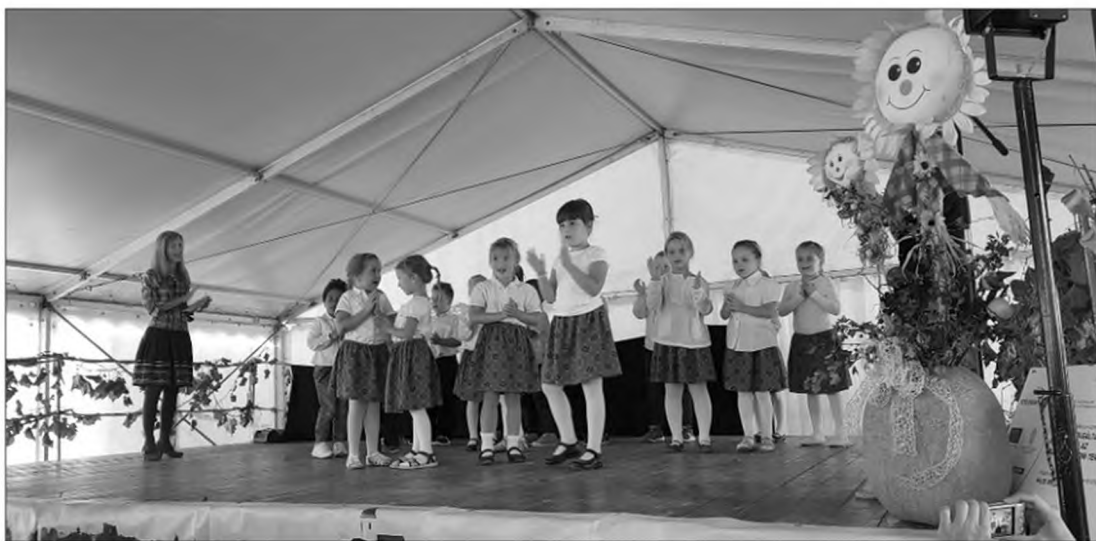
Nagycsoportos óvodásaink fellépése a Szüretelő Falunapon.

A 431/2020. (IX.18.) Kormányrendelet újabb óvintézkedés bevezetéséről rendelkezett.