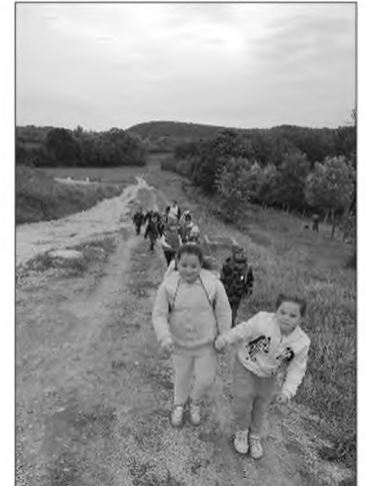
Nehéz az út hazafelé