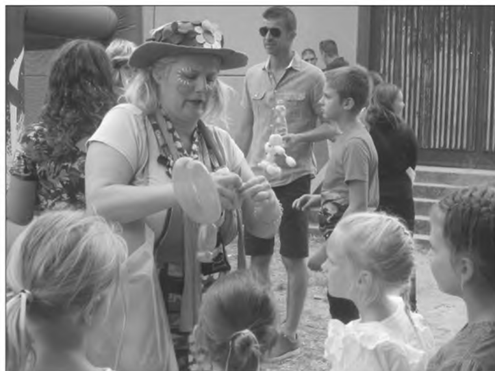
A gyerekek sem unatkoztak, lufibohóc csalafinta „tekeréssel” mozgatta meg képzeltüket.