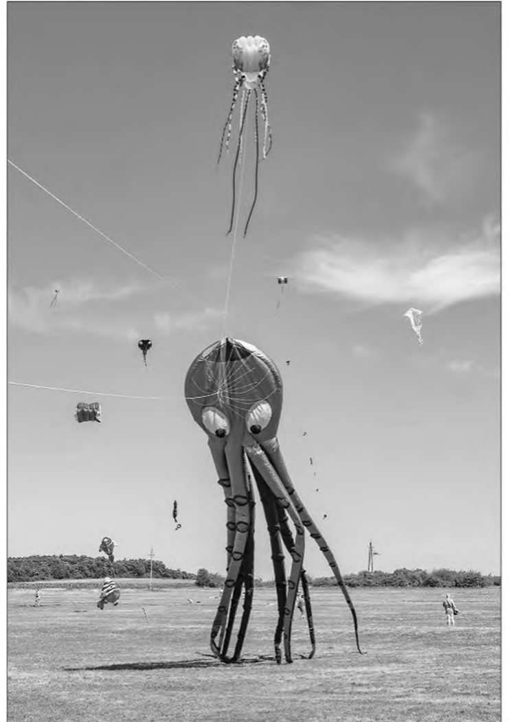
Idén emelkedett a magasba először a 24 méteres medúza emelősárkánynak köszönhetően a 16 méter hosszú polip.

mélyek és vállalkozók felajánlott adó 1%-ból, az önkormányzat támogatásával és a magánszemélyek helyszíni adományaiból tudjuk megvalósítani.