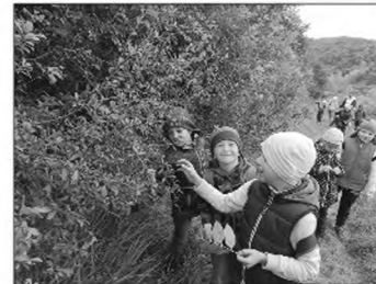
Kék a kökény..