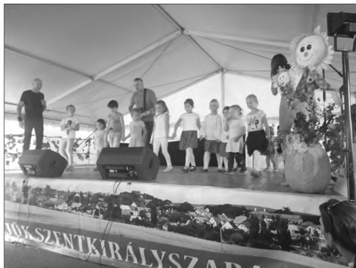
Desperado együttes, remek hangulatot teremtett, a gyerekek még a színpadra is felme- hettek.