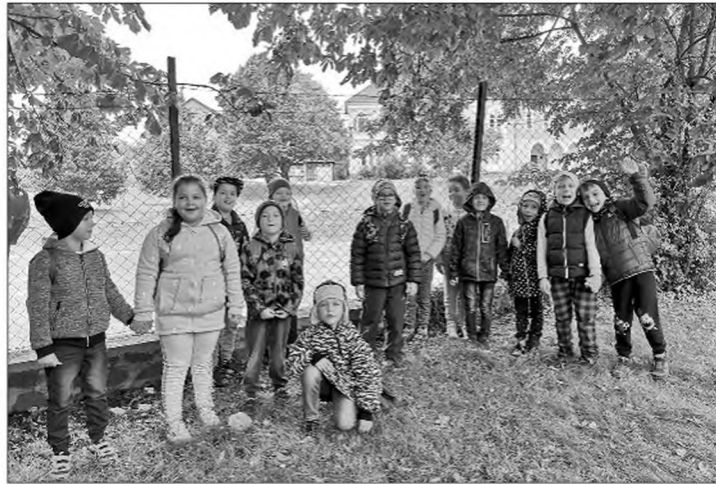
Viszlát iskola, indulás!