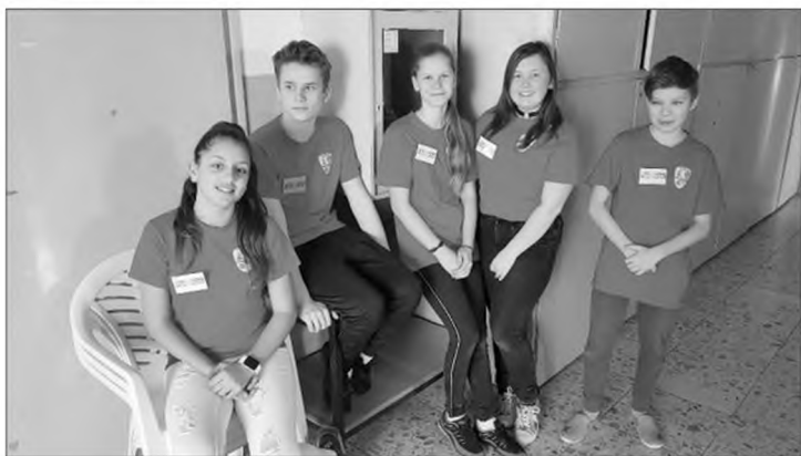
Iskolánk segítő diákjai

„Nem szeretek napvilágnál írni, a napfény éles világossága nekem túlságosan erős, éles fényt vet arra, amiről írok. Az én igazi elemem a köd, a borús vagy színes párák, az ólmos őszi eső, a hosszú téli alkonyatok és sűrű esték. A sűrű ködből csak úgy rajzanak elő a mesék, igaziak, szépek, leírni valók. „