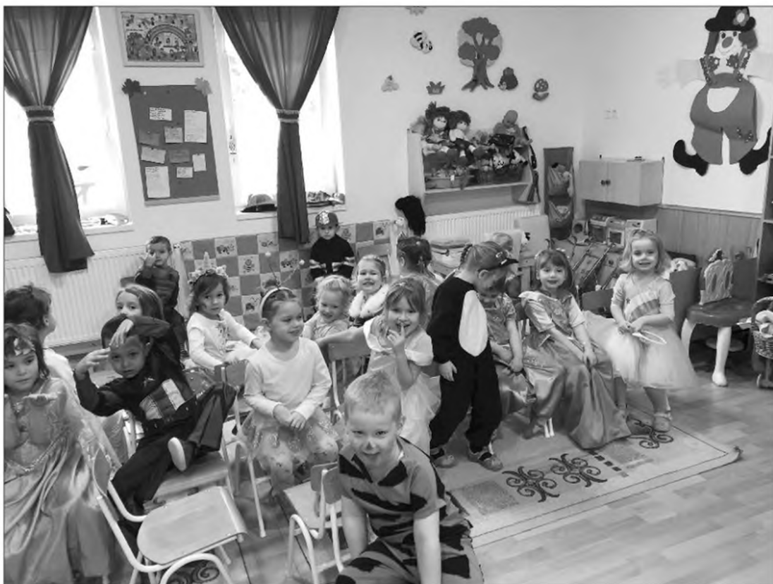
Február 8-án farsangi mulatsággal próbáltuk elűzni a telet

Húsvét előtt barkácsoló foglalkozásra várjuk az anyukákat, majd április 15-én megnyitjuk Meseboltunkat. Feldíszítjük Húsvéti tojásfánkát is az óvoda udvarán, így várjuk a nyuszi érkezését, és a tavaszt. Április 23-án nyílt napot tartunk leendő óvodásainknak, lehetőséget adva az ismerkedésre, tájékoztatást nyújtunk a felmerülő kérdésekre. Az óvodai beiratkozást április 23. és 26. között szeretnénk meghirdetni.