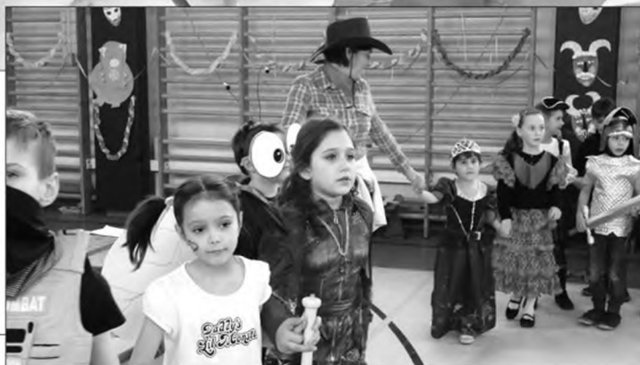
Egyéni jelmezések felvonulása

büszkén viselték azokat. Ezután volt még zsákbamaeska, tombola, a szülői közösség tagjai által üzemeltetett büfé (ezúton is köszönet nekik), gyerekdiszko mindenki megtalálhatta a neki tetsző elfoglaltságot.