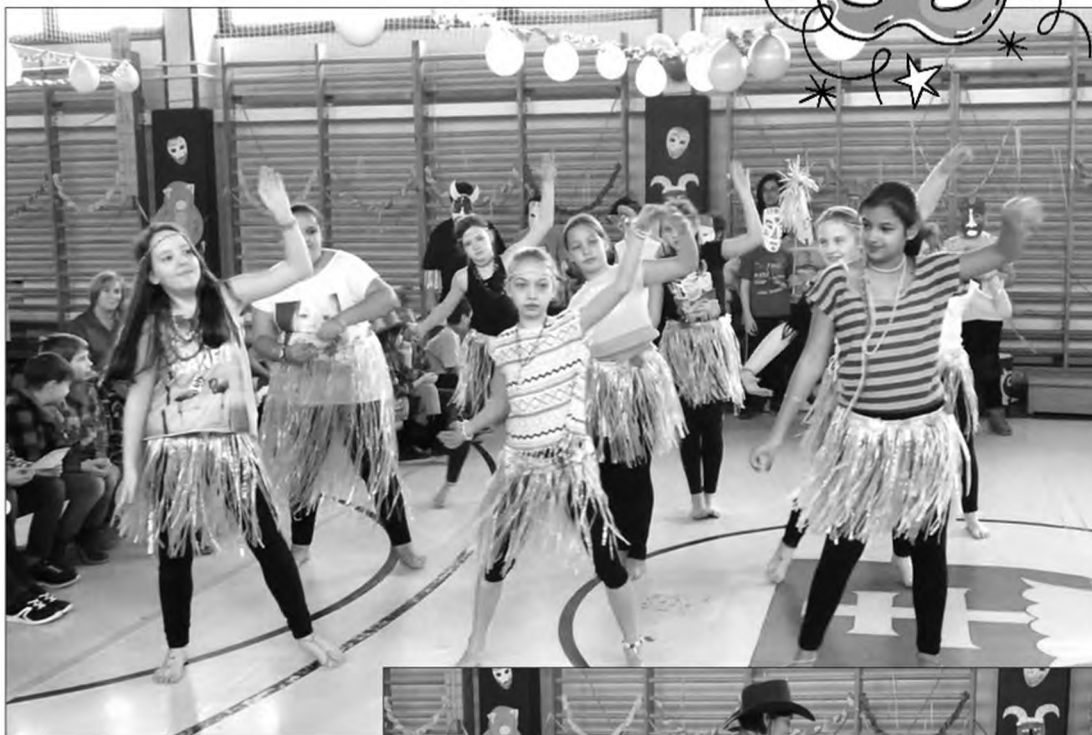
5. osztály produkciója

Ám ezzel még nem ért véget a meglepetések sora, hiszen ezután következett az egyéni jelmezések felvonulása. Rengeteg eredeti jelmezt láthattunk, és jó volt látni, ahogy a gyermekek