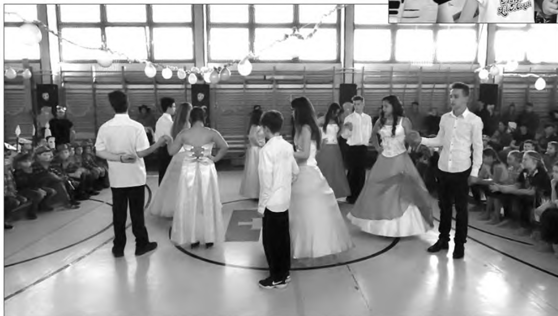
Felsősök ünnepélyes nyitótánca

A tombolasorsolás izgalmai után az alsósoktól elbúcsúztunk, és a felsősök vették át a 'hatalmat': a nagyok diszkója következett DJ Arminnal. A modern zenére ki-ki tánc tudása szerint roptá, de nem is ez volt a lényeg, hanem az, hogy együtt voltunk.