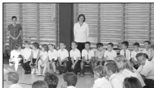
Évnyitó 2017/2018-as tanév, 15 kis elsős kezdhette meg tanulmányait

Egyesülettel és a Start Sportegyesülettel együttműködve lehetőséget biztosítunk tanulóinknak szervezett kereteken belül a labdarúgás és a kézilabda sport gyakorlására. 70 igazolt sportolónkkal részt veszünk a magyar Labdarúgó Szövetség Bozsik programsorozatain és a Magyar Kézilabda Szövetség versenykiírásaiban valamint az intézményi Sulikézi programban. Az érdeklődő fiatalok labdarúgó és