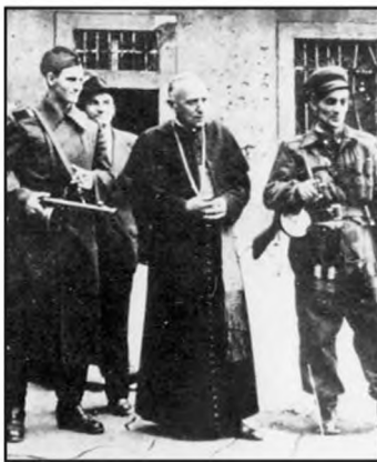
A bíboros rétsági katonák gyűrűjében és az Uri utcai érseki palota udvarán

kai Nagykövetségen talált menedékre. Ezzel megkezdődött 1975-ben bekövetkezett haláláig tartó száműzetése.