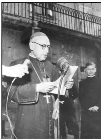
Mindszenty József beszédet mond 1956-ban

A szabadság helyett azonban a „felszabadító” szovjet hadsereg pusztítása fogadta és újra börtönben érezte magát az országban. Emlékirataiban így fogalmazott: „1944-ben két elnyomó és embertelen rendszernek a seurgei, Hitleré és Sztáliné érkeztek meg maradék földünkre,