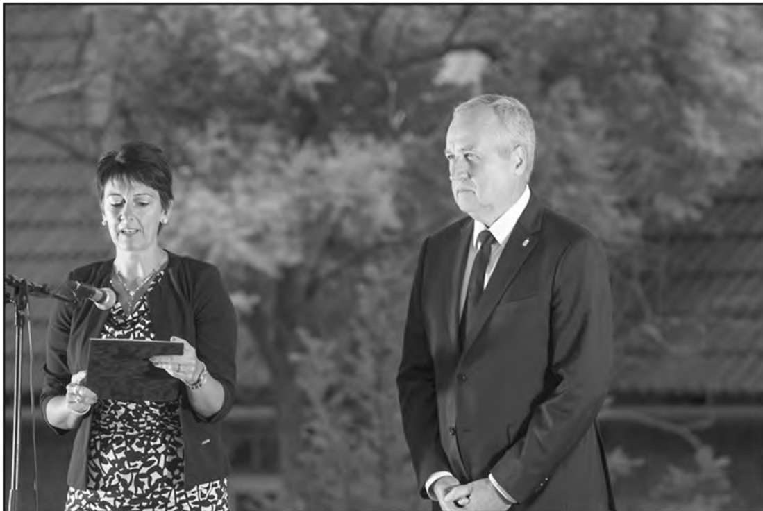
Gyarmati Katalin polgármester asszony és Szentkirályszabadja Díszpolgára dr. Konráth Károly államtitkár úr, térségünk országgyűlési képviselője

Gyarmati Katalin polgármester asszony az augusztus 19-i ünnepségen az alábbi méltóságokkal köszöntötte az ünnepeltek „Szentkirályszabadjáért” elismerésben részesült: