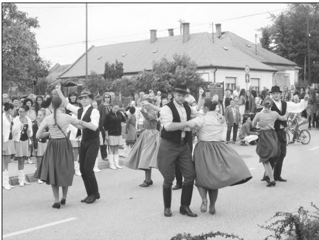
Szüretelő falunap: Veszprém-Bakony Táncosainak műsora