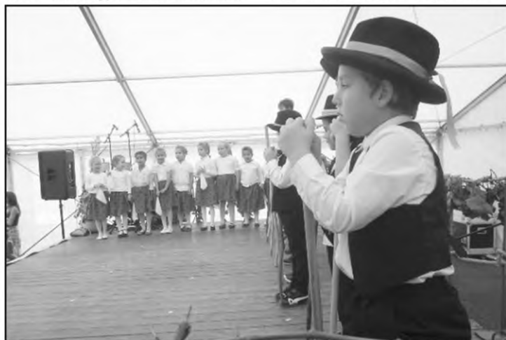
Szüretelő falunap: Az óvodások botos táncot adnak elő