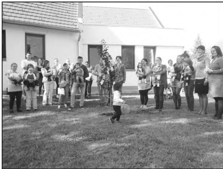
Újszülöttek fájának elültetése

Kis csúszással kezdődött a Fláre Beás együttes koncertje. Fergetegetes hangulatot teremtettek percek alatt, többen táncre per-