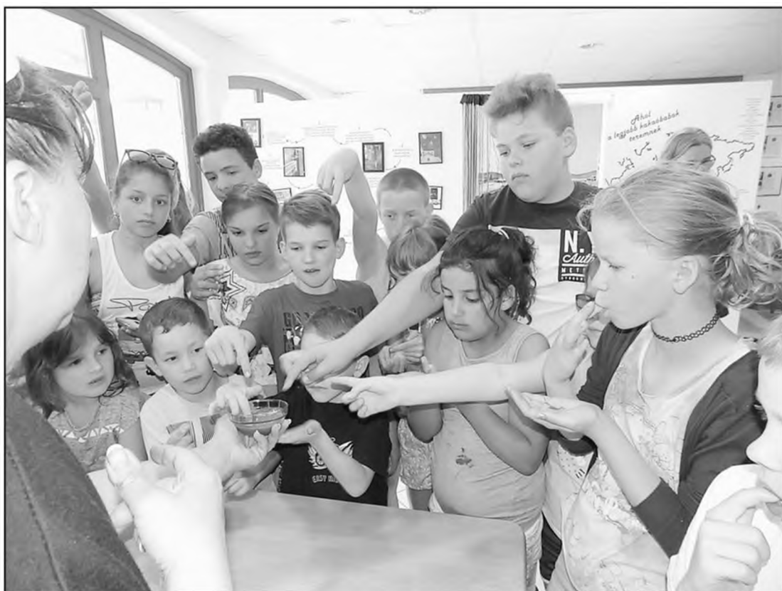
A kakaóbabtól a csokoládéig minden fázist végigkóstoltunk