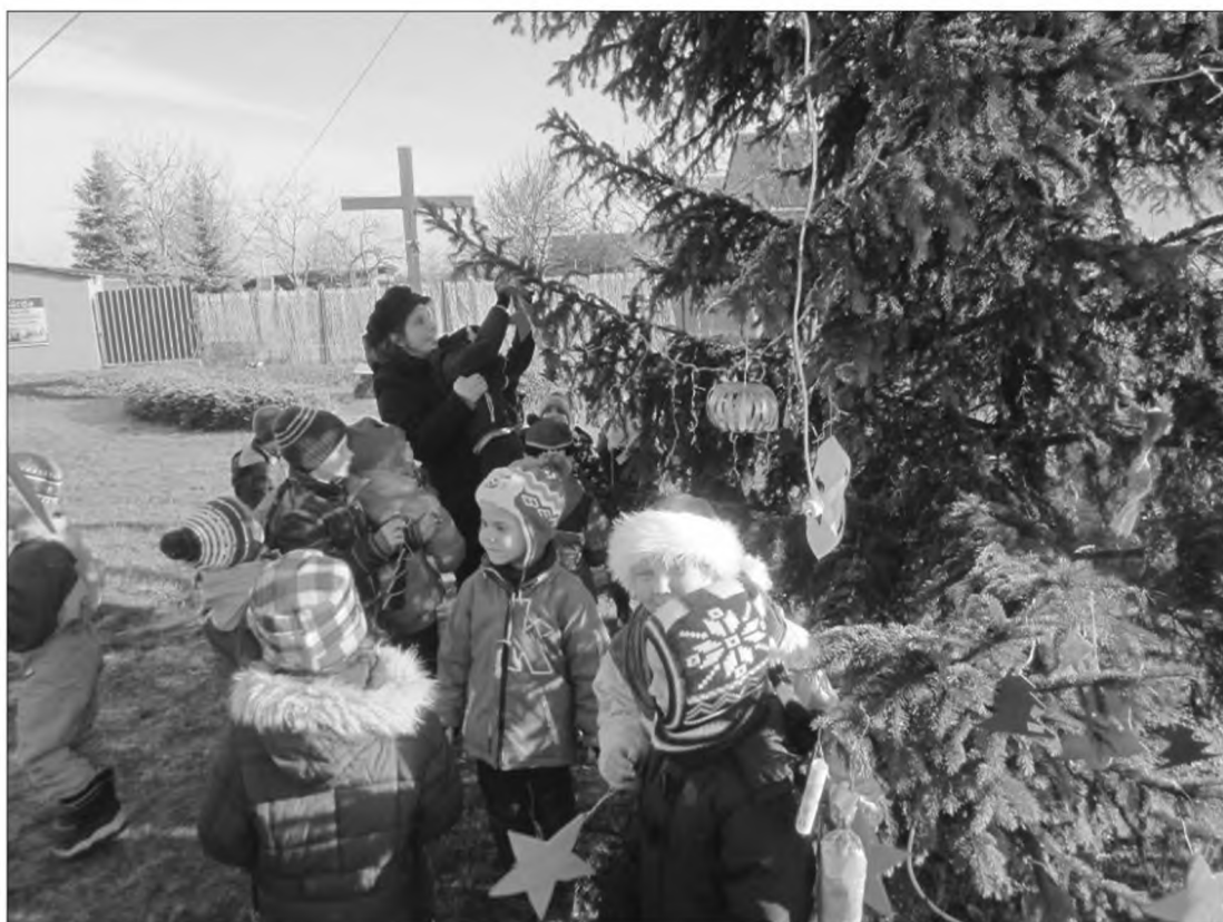
A falu karácsonyfáját óvodás gyerekek díszítik.