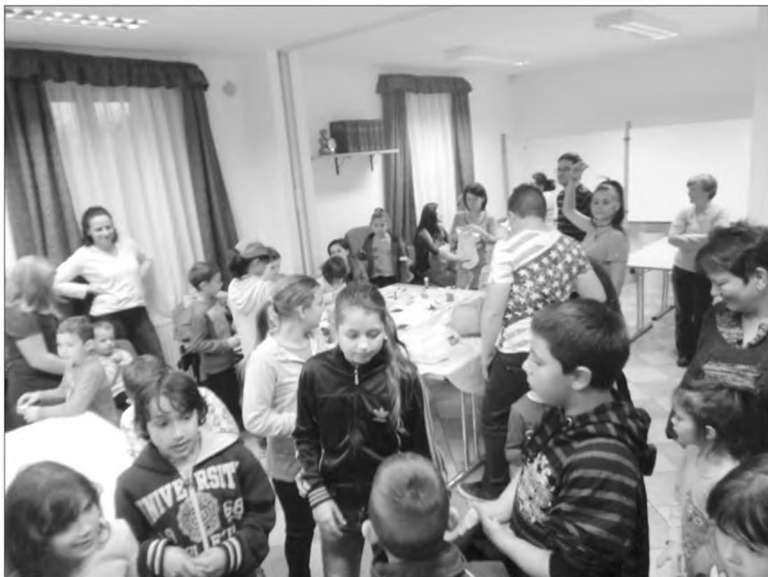
Tök jó programokkal vártunk minden érdeklődőt.

Idén is népszerűsítettük a sárkányeresztést, jártunk a 26. Pákozdi Nemzetközi Sárkányeresztő Találkozón, építettünk papírsárkányokat Tihanyban, Vilonyán, de Ausztriában Parnorfban, és Bécsben is. Szeptember első hétvégéjén megren-