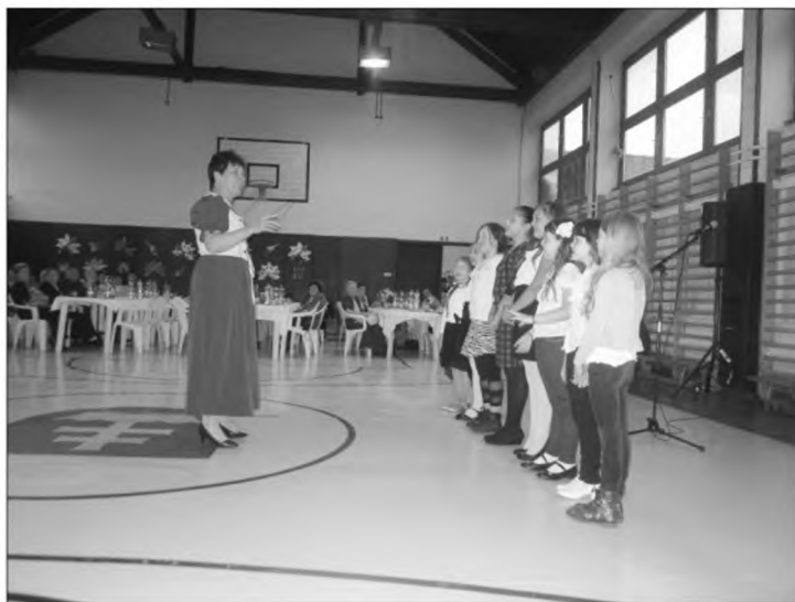
Az iskolai kórus.