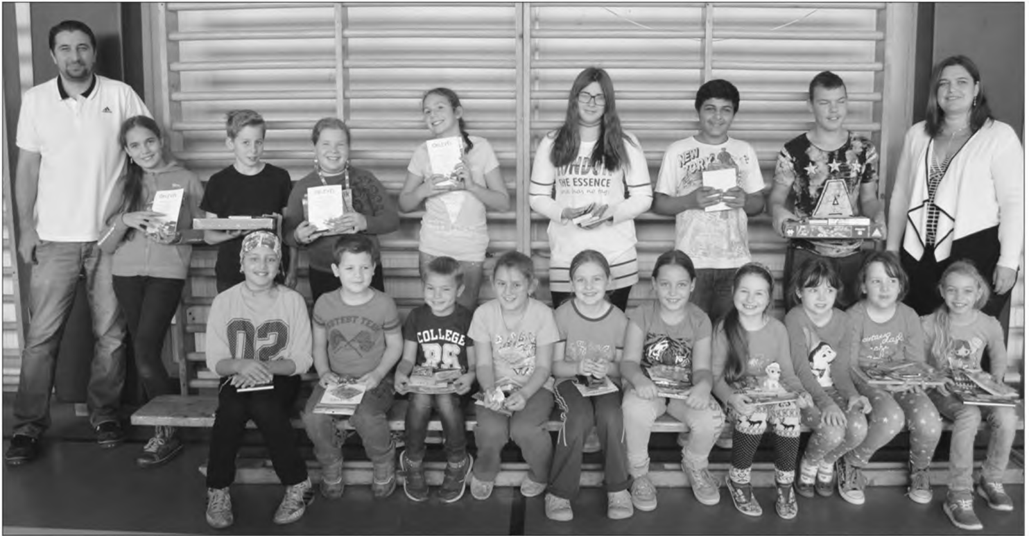
Szépirói, Gyermekrajz és Fotó pályázat díjazottjai.