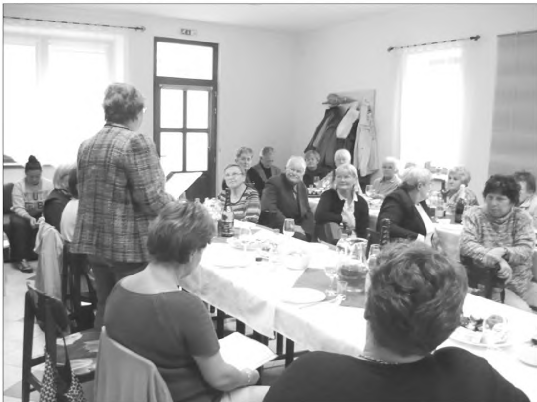
Közös mulatság a fűzfői és felsőörsi klubtársainkkal.

Novemberben külön buszos kirándulás keretében Szentendrére látogattunk a szomszédos települések klubjaival, a Balatonalmádi Szociális Központ támogatásával.