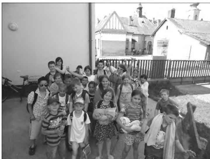
Irány a strand!!!

Szállásunk programjaink középpontjában, hazánk legnagyobb mesterséges állóvizének közvetlen közelében, az Alföld szívében elterülő Tisza-tó partján volt.