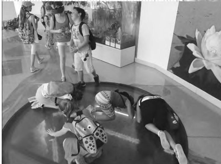
Na mi van ott?