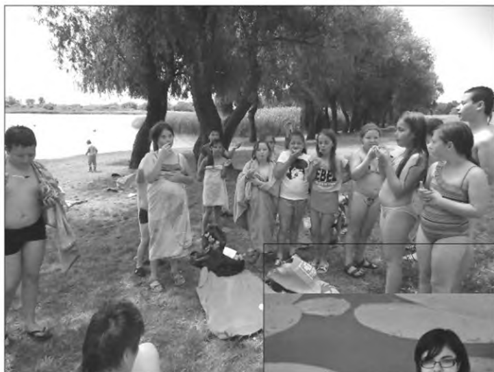
Nyami! Mogyorókrémes gofri a tízórai