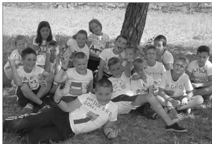
Mindenki saját elgondolása szerint megfestette egyéni pólóját

Ellátogattunk a Szabadi Századok című helytörténeti gyűjteménybe és a Játék-és rajzműhelybe, ahol betekintést nyerhettünk a játékok elkészítésének folyamatába. Mindenki nagy érdeklődéssel és kíváncsisággal figyelte a bábuk összeállítását. A szabad foglalkozások idején a gyerekek pingpongoztak, fociztak, hintáztak, homokoztak és egy vízbomba csatát is megvív-