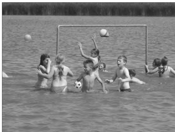
A strandon az is jó....

Az első emeleten a makrovilág-földinfo terem ben apró lények világába nyerhettünk betekintést, egyrészt az ott elhelyezett