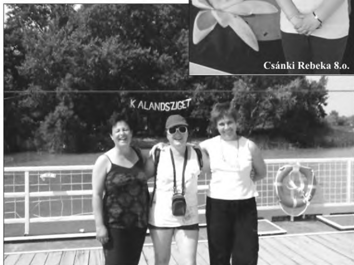
Szerintünk : IGEN!!!