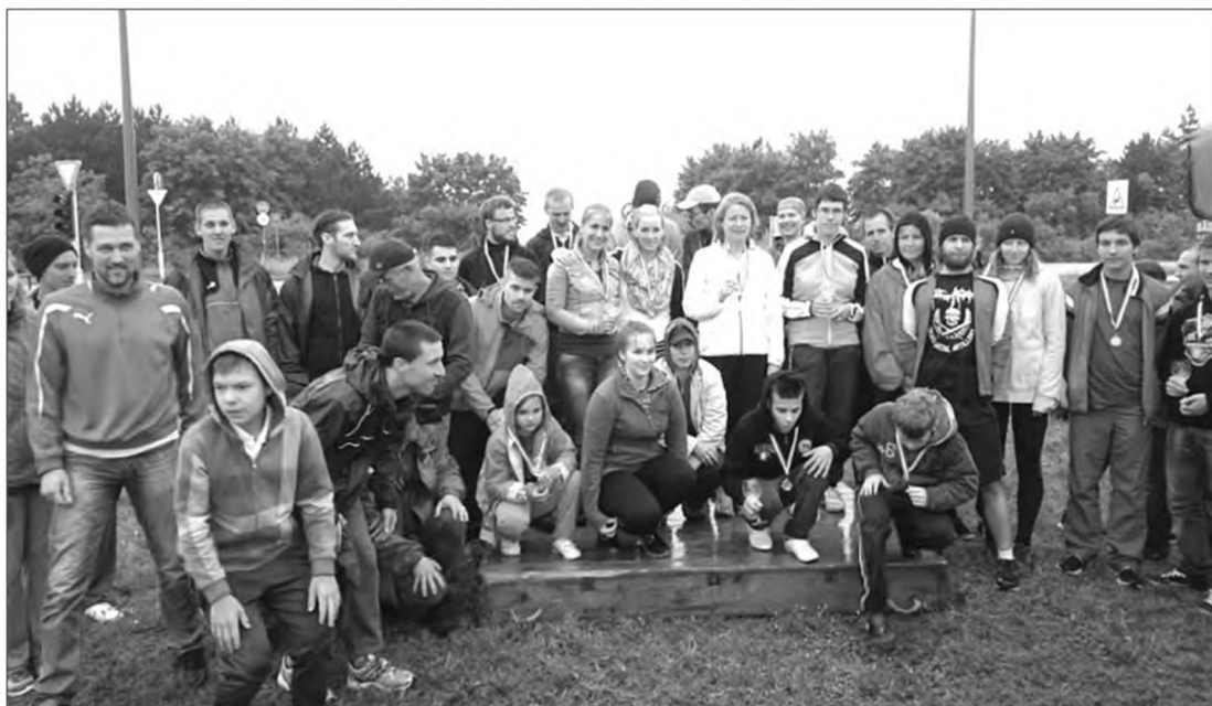
48 futó, melyből hat gyermek

Az első versenyt 2010 májusában rendeztük, melyre nagy meglepetésünkre egyből 78 lelkes futótársunk jelentkezett. Ebben az évben az időjárás sajnos nem volt kegyes hozzánk. Már napok óta esett az eső, de nagyon bizakodtunk, hogy 23-ára, ha csak egy rövidke időre is, de abba marad az égi áldás. A verseny reggelén is szakadó esőre ébredtünk. A futópálya, mely füves, erdős területen volt kijelölve teljesen felázott, ezáltal balesetveszélyessé vált a csúszóssága miatt, így másik pályát jelöltünk ki, mely a Szentkirályszabadja-Veszprém közötti kerékpárúton volt. Versenyünk szerepel az országos futónaptárban, így az időpontot már nem tudtuk megváltoztatni (hiszen a következő hétfégén