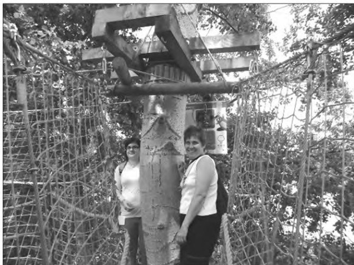
Akár a madarak...

„Megint jó volt együtt!” „Olyan jó volt ez a mai nap, hogy elfelejtettem, hogy táborban vagyok!” „Nem bántam meg, hogy mégis eljöttem.” „Maradjunk még egy napot!” „Játszunk még egyet!” (Éjjel 11-kor) „Jövőre is eljövünk?”