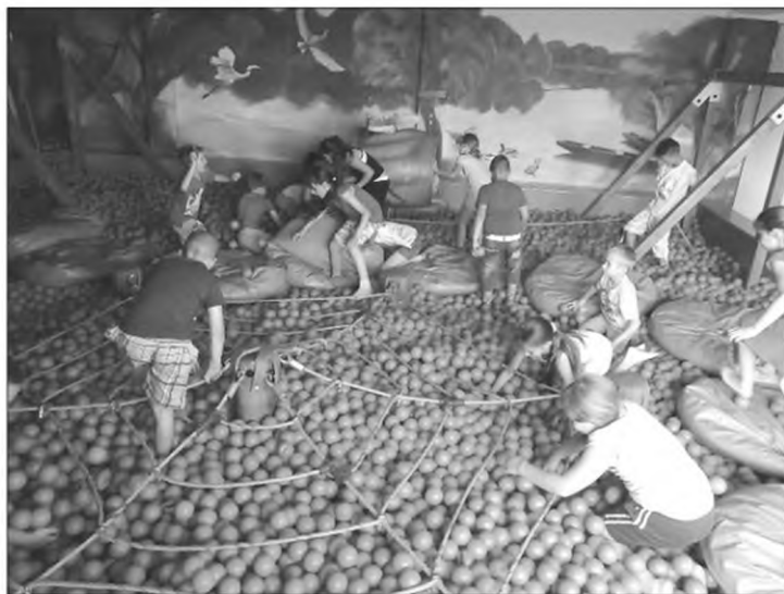
Pihenésképpen jót mókáztunk a játszószobában.

A Viza büfé teraszán elfogyasztott ebéd után 12 személyes