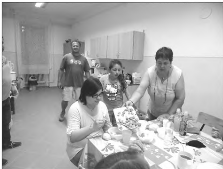
Változatos, finom falatok