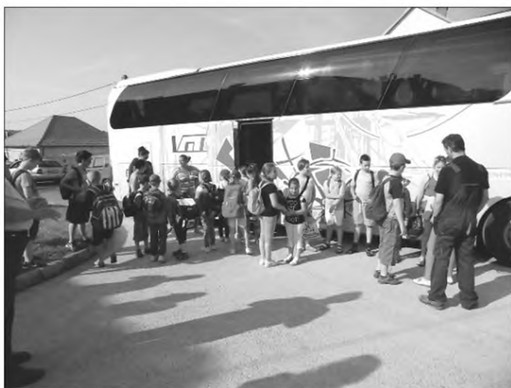
Hű, de szép busz! Hátra ülhetünk?

Az utazás időtartama alatt információkat kaptak a tanulók azokról az országrészekről, amelyeken átutaztunk és az úti célról. Erre szükség is volt később, mivel a hallottak és látottak egy tábori estén egy totó feladataiban kerültek elő.