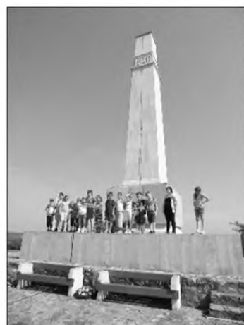
Még a Dunántúlon

A következő napon meglátogattuk a Tisza-tavi Ökocentrumot. Ez a hazánkban található őshonos fajok vízi állatkertje. A madarat formázó impozáns épületben Európa legnagyobb édesvízi akváriumát, a tavat bemutató 3D-s mozielőadást néztük meg.