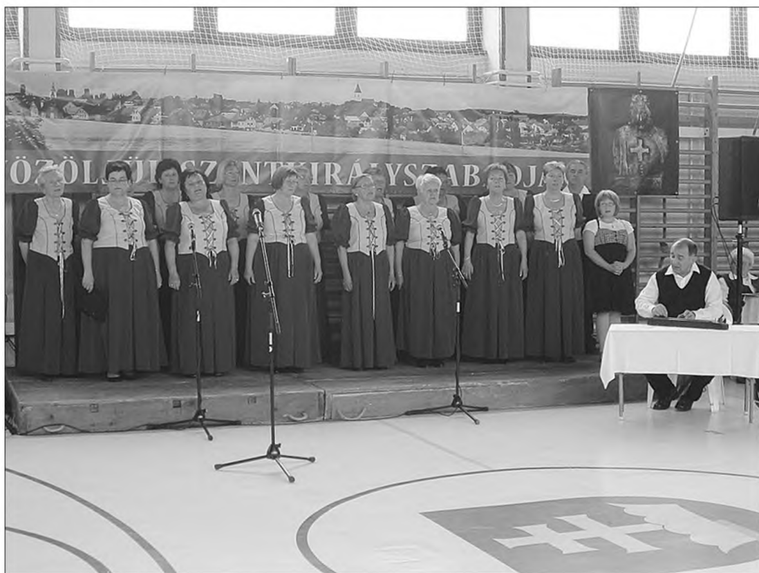
A 20 éves évfordulónkat színes műsorokkal ünnepeltük

A csoport a 20 év alatt a Kárpát - medence számos helyére vitte el a magyar népdal kincsét: Ajka, Bakonytamási, Balatonalmádi, Balatonszabadi, Balatonfűzfő, Berhida, Budapest, Csajág, Csíkszentkirály, Gyöngyöshermán, Gyulafirátót, Hajmáskér Inota, Kerkaszentkirály, Lédec, Litér, Marosszentkirály, Öskü, Papkeszi, Peramarton, Sajókirályi, Sóly, Székelyszentkirály, Szentgál, Szentistvánbaksa, Taliándörögd, Tapolca,