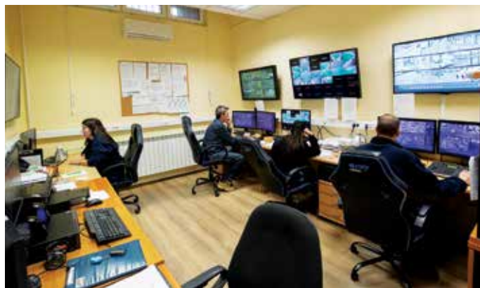
A kamerákat a közterület-felügyelet munkatársai a rendőrség közreműködésével napi 24 órában, folyamatosan figyelik

A lakosság és az ügyfelek számára ingyenesen hívható önkormányzati „zöldszám”: +36 80 203 804