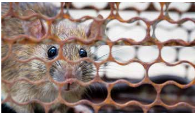
A bejelentések a fővárosba futnak be, nem az irtást végző céghez

Az RNBH Konzorcium 2018 óta végez patkányirtást Budapesten, de a következő időszakban teljesen más követelményeknek kell megfelelnie, mint az elmúlt két évben. „Rá-