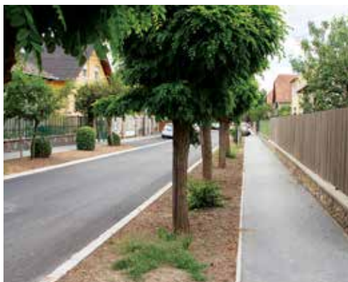
A pályázók önerőjének mértéke 2021-ben is 2000 Ft/m 2

A költségkeret kimerülése esetén a benyújtási határidő lejártá előtt a pályázatok közleménnyel lezárulnak. A pályázati adatlapokat a polgármesteri hivatal ügyfélszolgálatán, valamint a Városgazdálkodási Főosztály – palyazatvgf@bpxv.hu