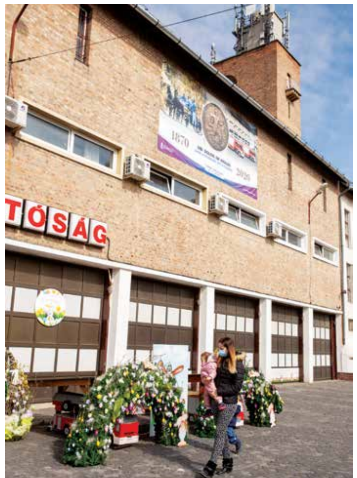
A tavaszi installáció április 12-ig látható

tűzoltó nyuszi, melyhez arcot egy jó húsvéti fotó kedvéért maguk az érdeklődők adhatnak. Ez utóbbi helyszín nemcsak a gyerekeknek, hanem a felnőtteknek is vonzó lehetőséget kínált.