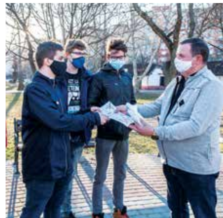
Nem lehet télennek maradni!