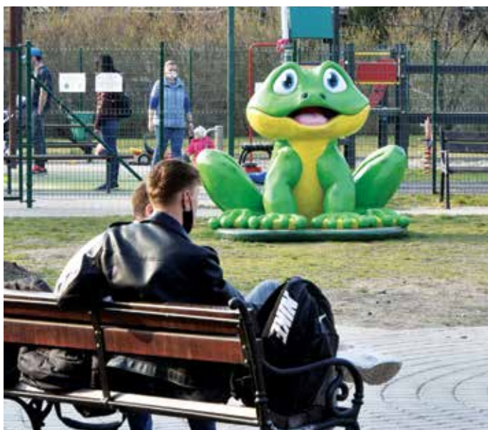
Nyuszi helyett béka ül a fűben a Közvágóhíd téri játszótéren

A talaj kiegyenlítése után gyöngykavicsot szórtak el a területen, hogy az esőzések alkalmával ne legyenek pocsolyák, illetve hogy elvegyék a négylábú kedvencek kedvét a gödörásástól – írja honlapján a Répszolg.