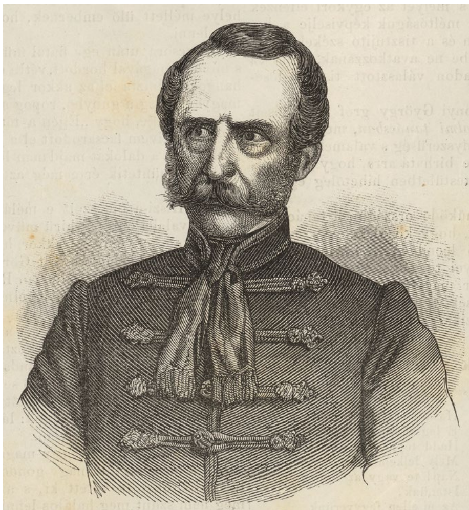
4. kép. Apponyi György (1808–1899) egykori országbíró