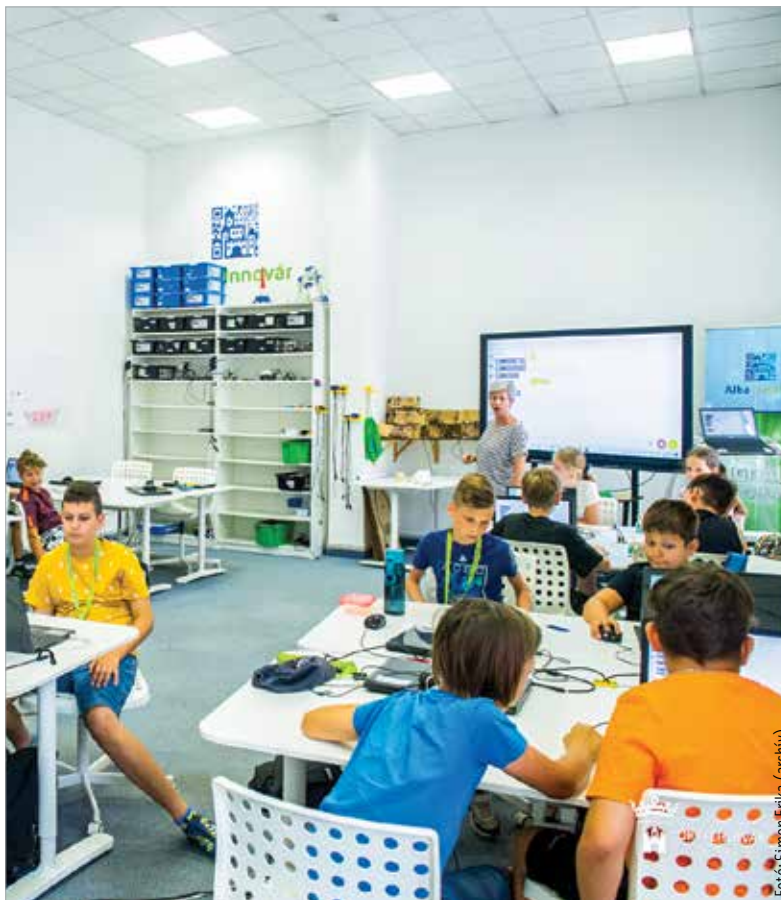
A nyílt napra tízéves kortól várják a gyerekeket. Jelentkezni az Alba Innovár honlapján lehet.

Ha valaki jobban el szeretné mélyíteni a digitális tudását, annak szakkörökön van erre lehetősége. Minden évben több szakkört hirdet az élményközpont különböző korosztályok számára. Bár a mostani kurzusok beteltek, januártól újra lesz lehetőség jelentkezni!