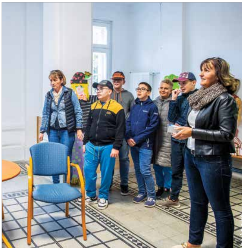
Új, tágas közösségi terek is létrejöttek a felújítással

A hétfői bejárás Székesfehérvár polgármestere azt mondta, hogy az összefogás erejének eredménye jól látható a megújult műemlék