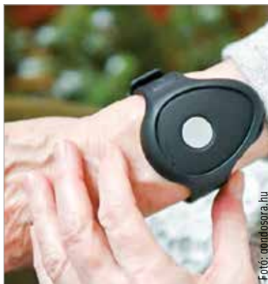
Egy gombnyomással elérhető a segítség. A programba a gondosora.hu honlapon lehet regisztrálni.

Az idők során ez megváltozott. Szétszóródtak a családok, ezáltal nehezebbé vált a távol élő idős hozzátartozókról, ismerő-