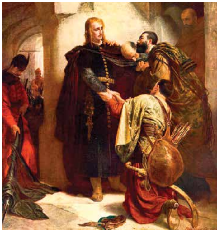
(Benzúr Gyula Hunyadi László búcsúja című festménye 1866.): Szilágyi Erzsébet tragikus sorsú fiára, Hunyadi Lászlóra – akit V. László igazatlanul ítelt halálra – a bakó háromszor csapott le, de az ifjú még mindig élt, s az akkori törvények szerint a királynak kegyelmet kellett volna adnia. V. László ezt nem tette meg, s a hóhér negyedszer „sikerrel” járt.

ból származó acélmetszet, ezért is különös, hogy Szilágyi Erzsébetről nem. Pulszky Ferenc, a Nemzeti Múzeum igazgatója egy, a Szent Osvát angolszász királyról készült portrét tulajdonította sokáig Mátyás édesanyjának, azonban 1882-ben tévedését felismerve állítását visszavonta. Rejtélyes ez a Szent Osvát-kép. Asszonyi fűzőben és fekete fátyoldiszen jelenít meg egy férfit, királyi joggal és a szenteket ábrázoló palmaággal a kezében. Hogy hogyan került a képre a csőrében gyűrűt tartó holló, máig megfejtethetlen. Hunyadi László tragédiájáig nem volt szükség arra, hogy Szilágyi Erzsébet a történelem porondjára fellépjen. A nándorfehérvári események után, Temesváron az anya kétségbeesett lépésre szánta el magát. Vendégül látta V. László királyt,