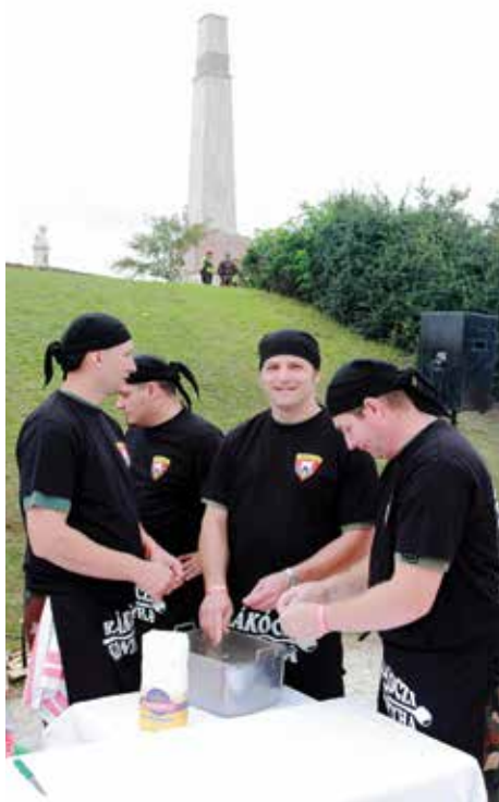
Lehet, hogy meglepő, de ez itt a csipet-csapat: éppen csipkedik a tésztaát a rottyogó bagdulyáshoz