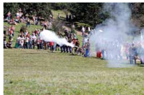
A honvéd össztűz és a bazaszeretet futásra kényszerítette az ellenséget