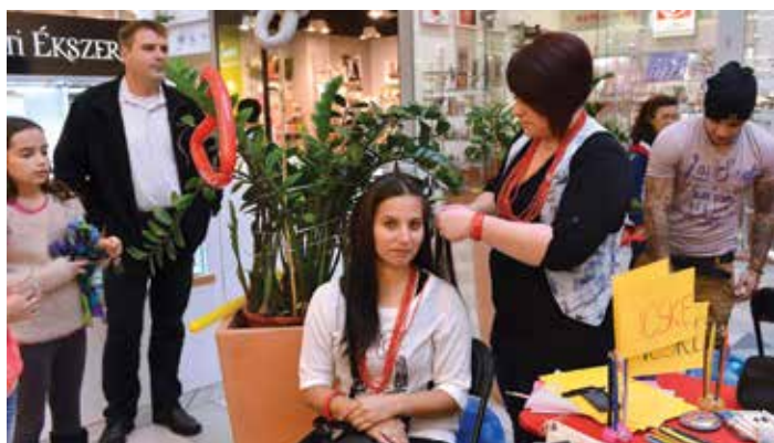
A civil nap célja a közösségépítés és a civil tevékenységek széleskörű megismertetése

„Ez a nap rólunk, emberekről szól. Azokról az értékekről, amelyeket együtt képviselünk, teremtünk.