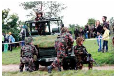
A bemutatón az utat a szolnoki alakulat különleges osztaga biztosította