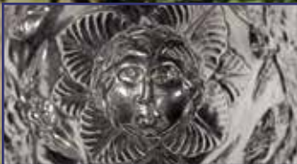
Indul a visszaszámlálás: péntektől Fehérváron a Seuso-kincs! 14-17. oldal