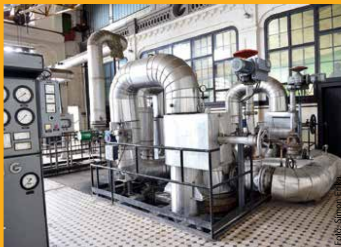
Szeptember 15. óta már kérhető a távfűtés

A szeptember 15. és október 15. közötti időszakban a fűtés elindítását az arra jogosult személy kérheti. A társasházi közös képviselőnek, a lakásszövetkezetnek vagy a fűtési megbízottnak írásbeli kérvényt kell benyújtania, és a bejelen-