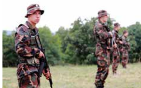
„Szabadság, szerelem! / E kettő kell nekem. / Szerelmemért fölláldozom / Az életet, / Szabadságért fölláldozom / Szerelmemet.”