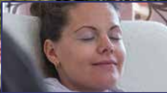
A kétarcú stressz 10. oldal