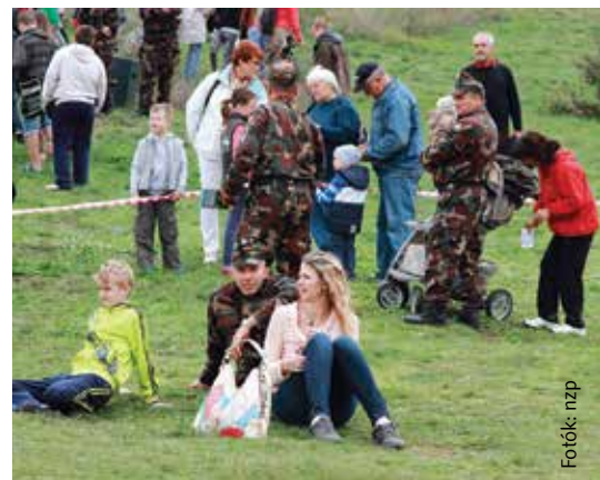
A magyar honvéd mégis családjával érzi magát a legjobban!