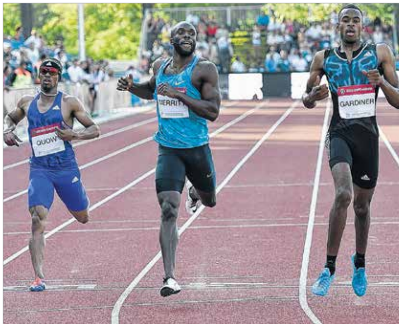
Meglepetésre LeShawn Merritt nem állhatott a dobogó tetejére a Bregyóban: a jamaicai Gardiner 13 századmásodperccel megelőzte a 400 méter nagy favoritját