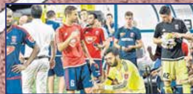
Nem volt szuper a kupadöntő 15. oldal