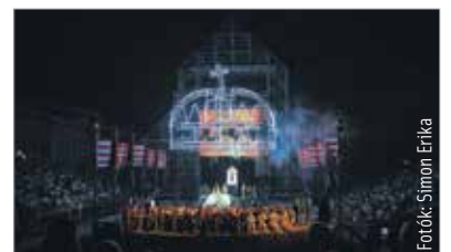
A Koronázási Ünnepi Játékok keretében ezúttal Könyves Kálmán uralkodását idézik meg