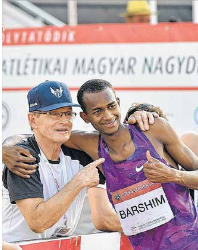
A katar magasugró világbajnok Barshim laza figura, nem véletlen, hogy oly sokan szurkoltak neki a Gyulai Memorialon. Végül merész taktikával nyert is, két rontás után emelt a magasságon, és 236 centivel az élen zárt.

végül 1,84 méterrel negyedikként zárt, a győzelmet pedig az orosz Irina Gorgyjeva szerezte meg 1,91 méterrel. A férfiaknál a favorit