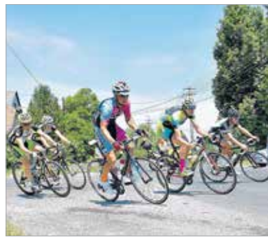
A rekkenő hőség ellenére remek iramban tekert a mezőny

Nagy csatát hozott a hatvan év feletti korosztály versenye is. Meglepe-