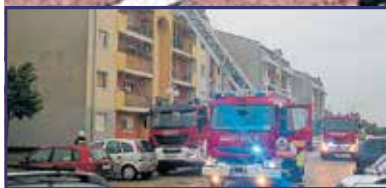
Az elemek nem válogattak 3. oldal