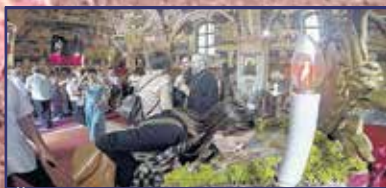
Ünnepeltek a fehérvári szerb közösség tagjai 8-9. oldal