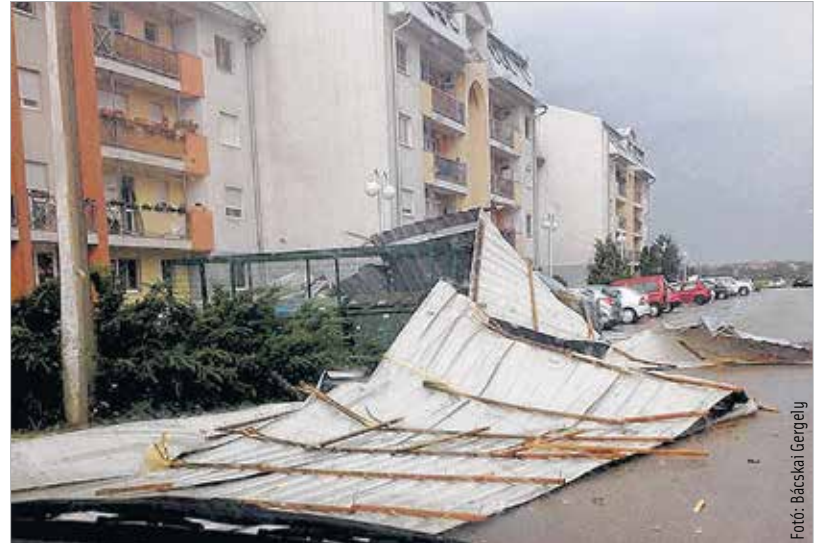
A Gánts Pál utcai épületek tetejét izekre szedte a tomboló vihar

törték derékba, cserepeket kezdett meg a hirtelen jött szélvihar. Már biztos, hogy jelentős anyagi kár keletkezett, aminek nagy részét az efféle károkról elkülönített költségvetési keretből orvosolnak. Talán a legjelentősebb viharok a Gánts Pál utcai önkormányzati épületben keletkezett, amelynek tetőszerkezetét megtépázta a vihar, lemezburkolata az utcára zuhant. Cser-Palkovics András felajánlotta a város segítségét azoknak a családoknak, akiknek el kellett hagyniuk lakásukat.