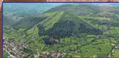
Bevállalós fellegvándor 11. oldal