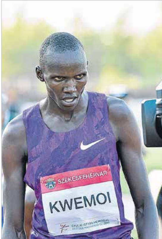
Ezerötszáz méteren remek futamot láthattak a nézők, a kenyai Kwemoi a hajrában simán lesprintelte esélyesebb honfitársát, Kiplagatot

végül 1,84 méterrel negyedikként zárt, a győzelmet pedig az orosz Irina Gorgyjeva szerezte meg 1,91 méterrel. A férfiaknál a favorit