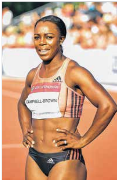
Szépsége és kedvessége mellett gyorsaságával is a fehérvári publikum kedvence lett Veronica Campbell-Brown, aki idei legjobbjával nyerte a női száz métert

„Mindig csak a következő versenyre összpontosítok, így nekem most ez, a fehérvári a legfontosabb futásom. Szeretek lépésről lépésre, versenyről versenyre gyorsulni. Az összesített cél pedig az, hogy a 2015-ös Justin Gatlin jobb legyen a 2014-esnél. Ennek elérésében a székesfehérvári verseny ugyanolyan fontos, mint a többi, én úgy megyek fel a pályára, hogy a lehető legjobb időt hozzam ki magamból, függetlenül a körülményektől.” – mondta el még a verseny előtt a világ idei leggyorsabb embere.