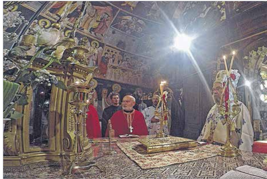
A szertartást végző papokat egy ikonfal választja el a gyülekezettől. A falnak nagy jelentősége van az ikon

Ez a templom mindig is sokat jelentett a fehérvári szerb közösségnek, hiszen nem csupán a