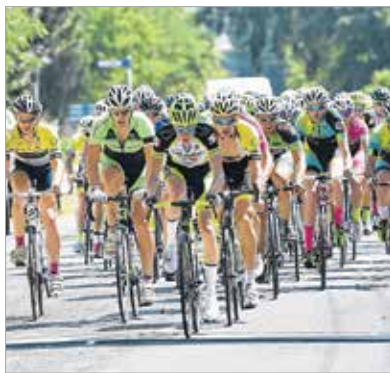
Együtt a mezőny