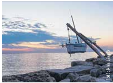
Nyáron a legtöbben még mindig tengerpartra vágnak

Egyre tudatosabbak a hazai nyaralók. Sokan már a tervezett indulási időpont előtt 2-3 héttel jönnek, feliratkoznak, hogy szóljunk, amint bomba ár van – hiszen tudják, hogy látjuk, melyik gépen hány szabad hely áll rendelkezésre. Így tudjuk a legjobban pozicionálni a foglalás időpontját, hogy ténylegesen a legutolsó helyekre startoljon rá a legjobb áron. Az idei szezon bőséges kedvezményes lehetőségekben.