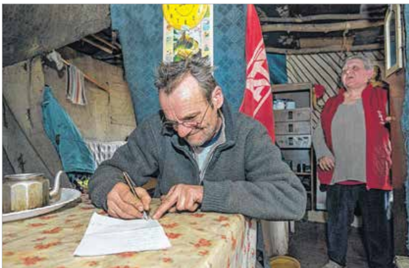
És a lista...