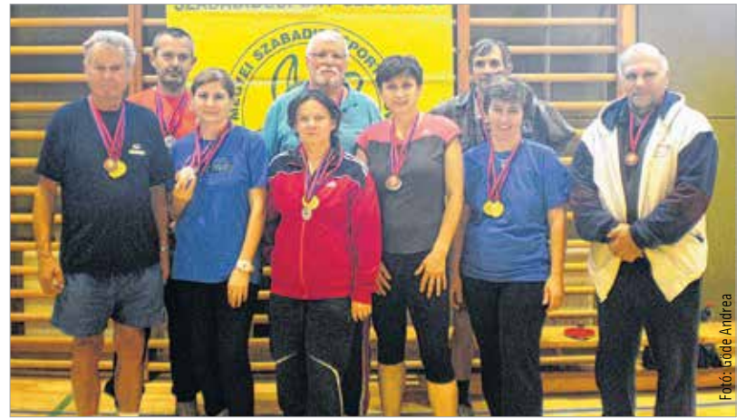
Amatőr éremhalmazók a Hétvezér iskolában