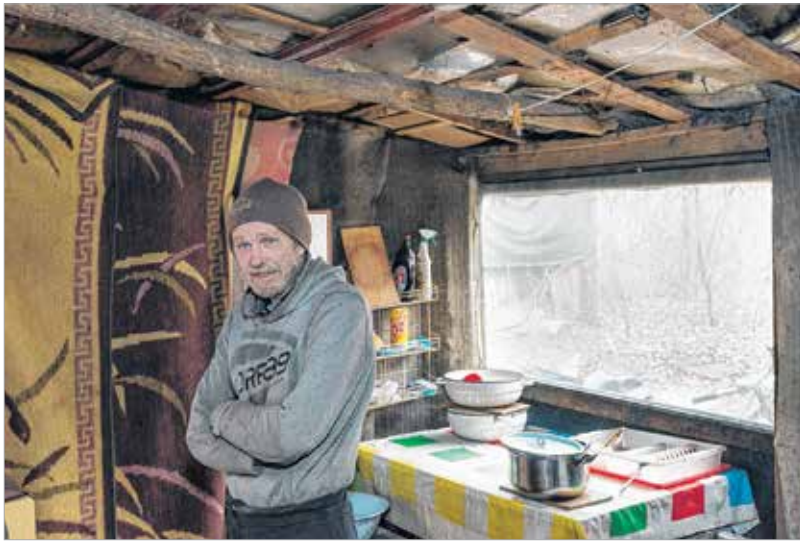
A konyhában rendszeresen főznek