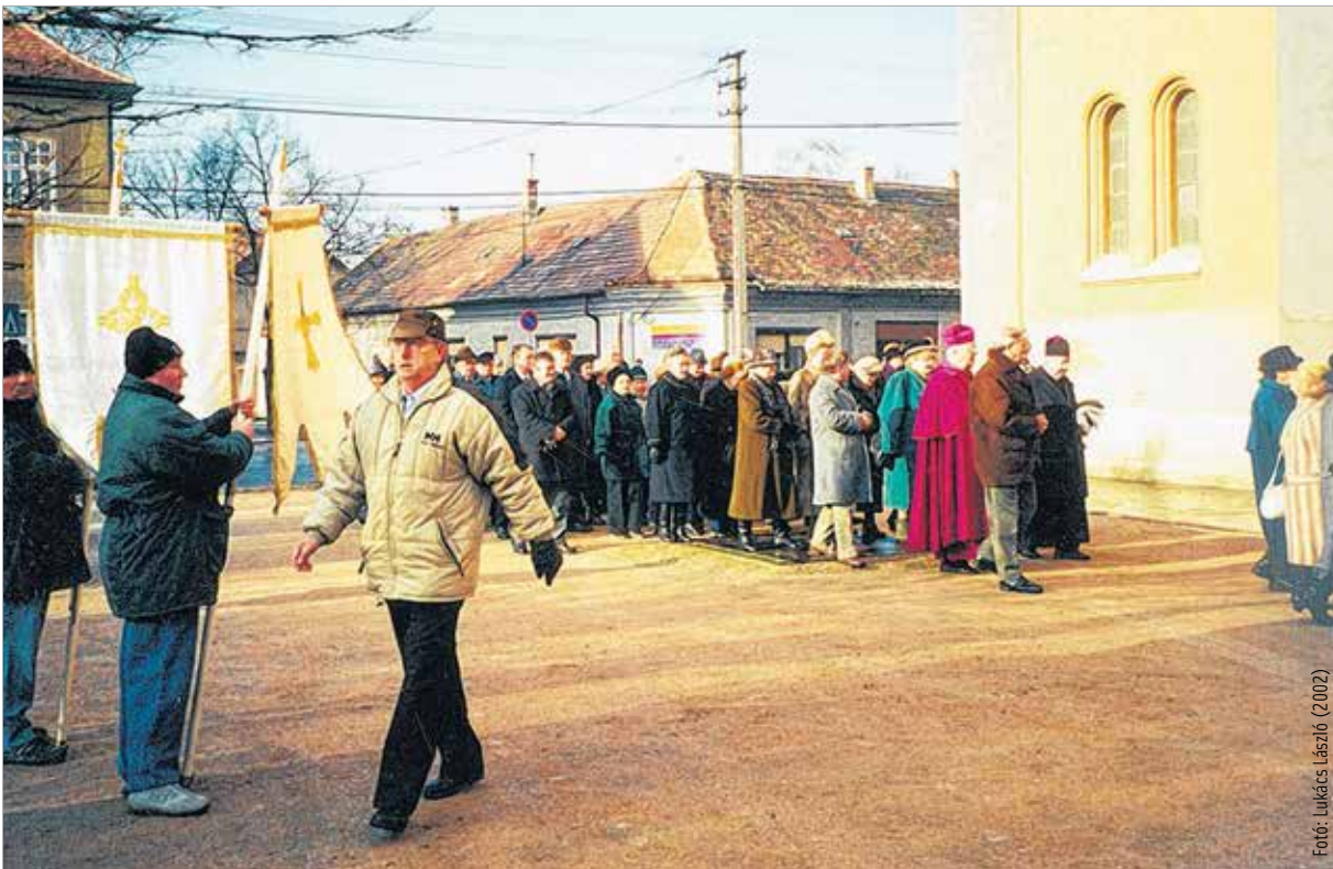
Fotó: Lukács László (2002)

budai külvárosban fennálló Szent Sebestyén tiszteletére szentelt roskatag kápolna égetett téglából és kövekből Szent Sebestyén, Rókus és Xaveri Szent Ferenc, úgy Szent Rozália, mint kiváltképen a pestistől megoltalmazó védszentek tiszteletére újolag és a mint csak lehet minél előbb újra felépíttessék, a legjobb állapotba helyeztessék és minden időben fentartassék. Másodszor: E városnak összes és minden egyes polgára s lakója, beleértve a hét évet betöltött gyermekeket is, Szent Sebestyén napja előestéjén kötelesek lesznek kenyéren és vizen böjtölni, ez pedig mindaddig meg fog tartatni, míg a pestis ezen országban teljesen meg nem szűnik. Harmadszor: Maga a Januárius 20-ára eső Szt. Sebestyén napja ezen város minden egyes lakója által örök időken át meg fog ünnepeltetni, úgy, hogy az adózóktól beszedendő és szent célra fordítandó súlyos büntetés terhe alatt valamennyien minden, még a legcsekélyebb munkától is tartózkodni kötelesek lesznek. Negyedszer: Magán Szent Sebestyén napján pedig az előbb említett módon évenként megünneplendő napon szintúgy örök időken át ün-