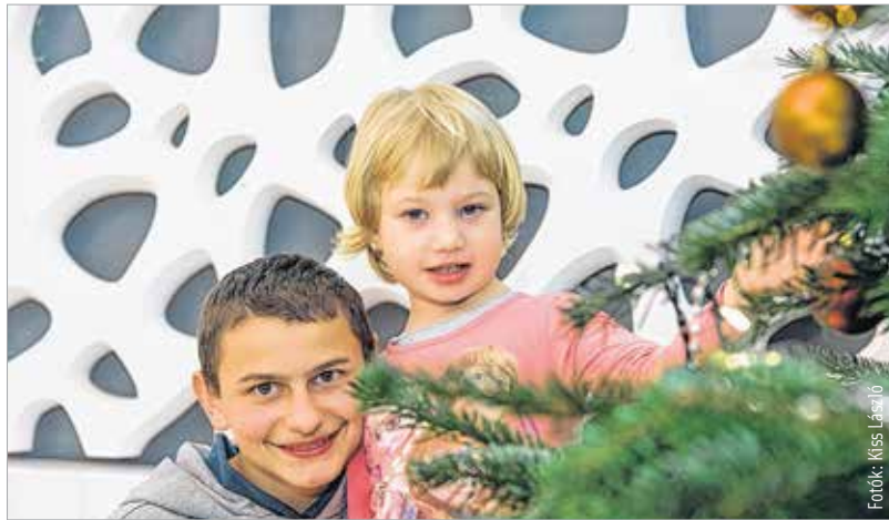
Karácsonyfával várták a gyerekeket a Hiemer-házban