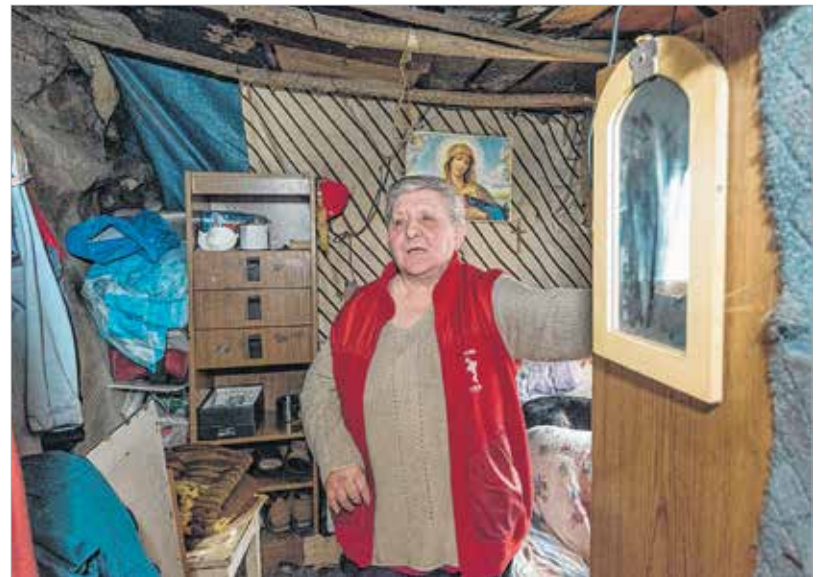
Erzsébet harminc éve él az erdőben

Karácsony az erdőben is van: az itt lakók is befaragják a fenyőfát a talpba, majd feldiszipítik, ezt követően elköltik