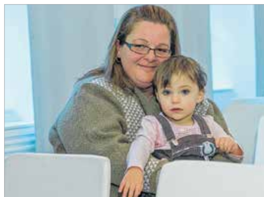
A gyerekek nevelőszüleikkel, segítőikkel érkeztek