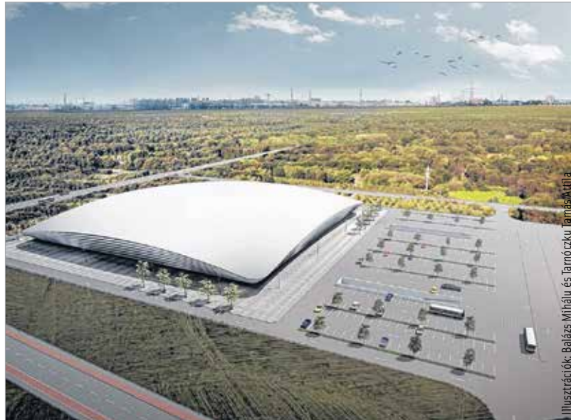
Az új csarnokhoz bekötőút és parkoló is épül majd a város határában

Székesfehérváron nagyon régóta várt fejlesztés a rendezvénycsarnok megépítése. A város közgyűlése még 2013. november 29-én tartott nyílt ülésének utolsó napirendi pontjaként tárgyalt a multifunkcionális jég- és rendezvénycsarnok létrehozásáról, melyről azt megelőzően támogató kormánydöntés is született. A lehetséges helyszíneket megvizsgálták, tizenkét ingatlanból nyolcat találtak érdekesnek arra a szakemberek, hogy érdemben foglalkozzon vele a közgyűlés. A képviselők – egyhangúan – döntést hoztak arról, hogy a megvalósítást a Budai út városból kivezető szakaszának jobb oldalán, az ott lévő kereskedelmi létesítmények mellett képzelik el.