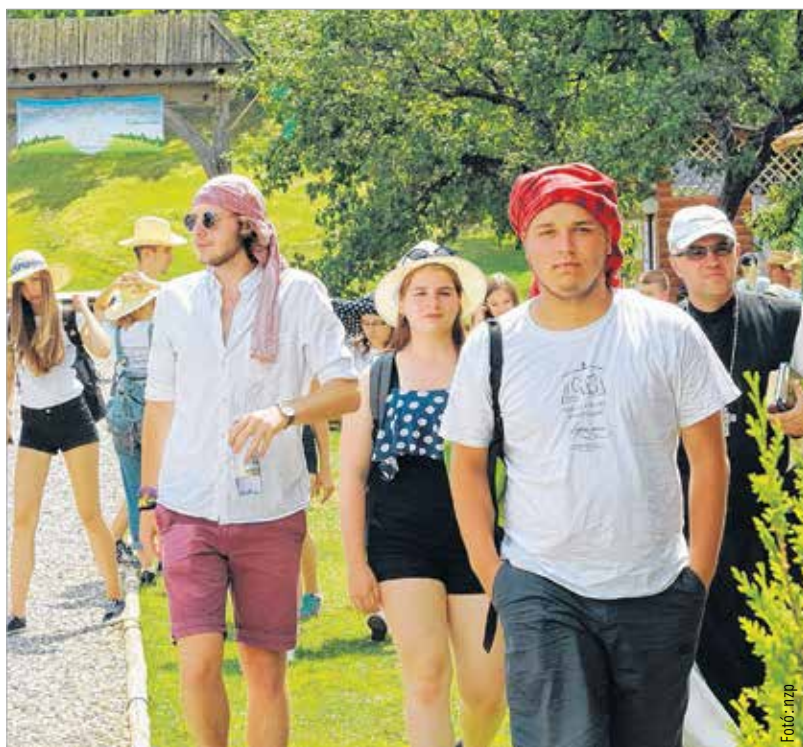
Verstáborosok a felhőtlen együttléti pillanataiban