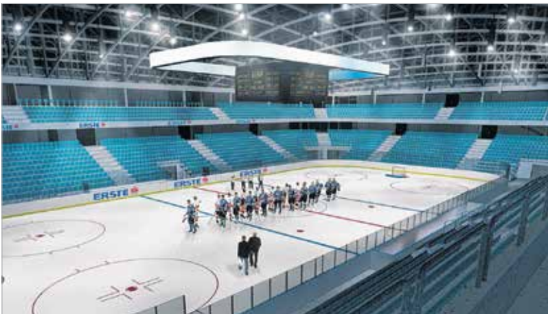
A tervezők ígérik, katlanszerű élményt fog nyújtani a bent lévőeknek az épület

A 2016-os év első felében újra jelentős mérföldkőhöz érkezett a multifunkcionális jégcsarnok megvalósítása. Tavaly tizenhárom megyei jogú várossal – köztük Székesfehérvárral – kötött együttműködést Magyarország Kormánya a Modern Városok Program keretében. Egy 2016 februárjában kiadott kormányhatározat szerint csak az idei költségvetés terhére több mint ötvenmilliárd forintot fordítanak a megyei jogú városok fejlesztésére. A legnagyobb összeget – mintegy tizenhatmilliárd forintot – Székesfehérvár kapta ekkor. A kormányparti képviselők szavazatával az idei év júniusában elfogadásra ke-