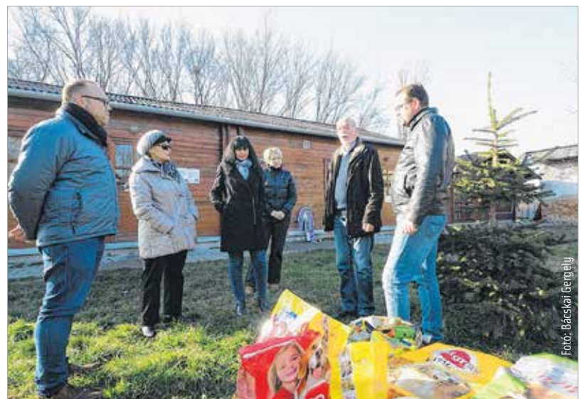
A fehérvári Fidesz is vitt adományt az állatmenhelyre

val folytatódott a rendezvény. A Fehérvári Állatotthon a hét minden napján nyitva tart 14 óra és 16.30 között, ez idő alatt bárki átadhatja támogatását. Jelenleg átlakólykőknek készült konzervekre van leginkább szükség, de hasznosak lehetnek a felnőtt állatoknak szánt tápok, etető- és itatóedények, tisztítószeresek, vitaminok és parazita elleni készítmények. Az állatok tisztán és melegen tartására szolgálnak a régi törölközők, ágyneműhuzatok, szőnyegek és vastagabb, puha ruhadarabok valamint a forgács és a szalma, amit szintén vihetnek a támogatók.