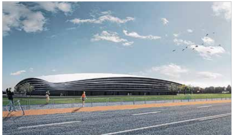
A tervek szerint három év múlva megnyithatja kapuit az ország második legnagyobb csarnoka

mogatást biztosított a költségvetési törvény módosítása. A Budai út mellé tervezett multifunkcionális rendezvény- és sportcsarnok építése kapcsán megítélt félmilliárd forint a területvásárlási és tervezési költségeket fedezi 2016-ban. A város vállalta, hogy elkészíti a komplett építési és engedélyezési tervdokumentációt valamint a közmű- és útterveket is. A Modern Városok Program keretén belül 509 millió forint erejéig Székesfehérvár megkapta a terület megvásárlására a pénzt és az engedélyes tervekre a forrást. „A tervezés során alapvető fontossággal bír, hogy a létesítmény, mely a