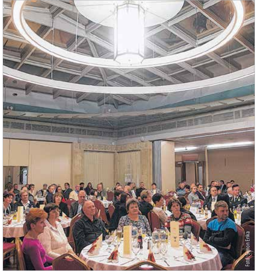
Zsúfolásig megtelt a bálterem a véradás ügyének támogatóival és a sokszoros véradókkal