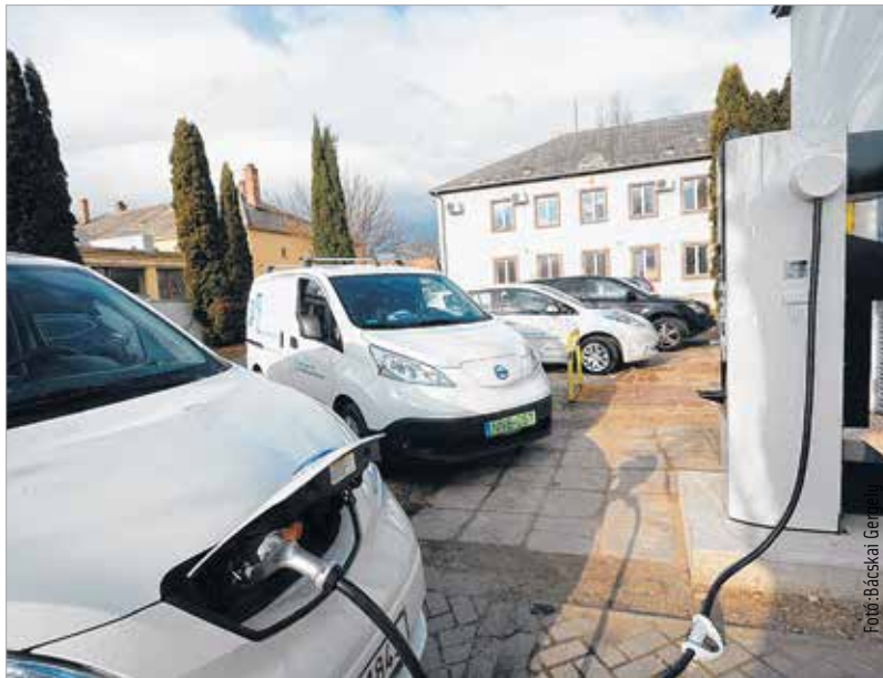
Jelenleg két „zöld” autó, azaz elektromos gépkocsi segíti a Székesfehérvári Városfejlesztési Kft. munkáját

A beruházás a Nissan társadalmi felelősségvállalási programja keretében valósult meg. Az egyre több elektromos töltőállomással az alacsony üzemanyagköltségű és üzemeltetésű, zero károsanyag-kibocsátású gépjárművek használatára ösztönzik a cégeket és a lakosságot. A nyilvános töltőállomások nagyfeszültségű egyenárammal működnek, így ezeken a pontokon az elektromos autók nagyon gyorsan feltölthetők. A város célja, hogy a gépjárművek okozta károsanyag-kibocsátás csökkenjen, ennek érdekében – a közgyűlés döntése alapján – a zöld rendszámú autóknek a városban nem kell parkolási díjat fizetniük. A városi közlekedésben az innovatív elektromos