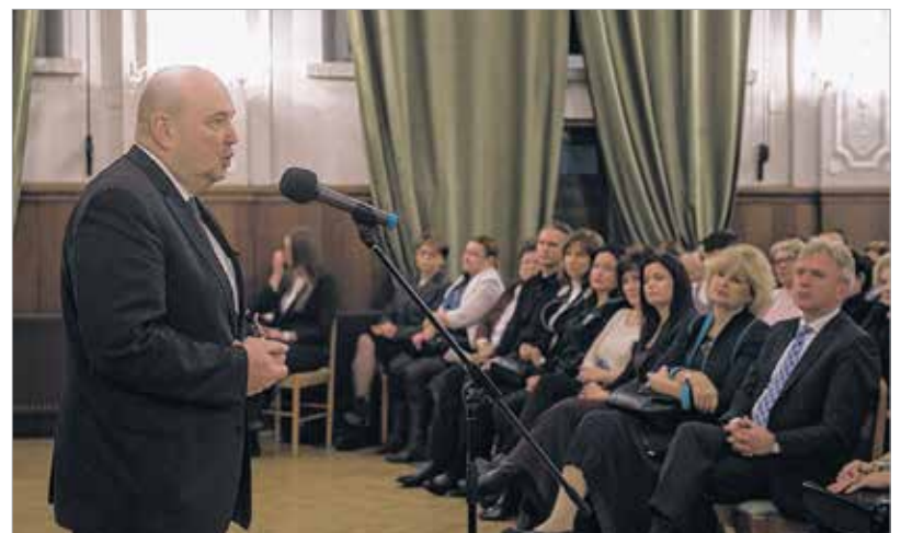
Az est fővédnöke, Steinbach József dunántúli református püspök beszédében a keresztyén egységet és a közös segítségnyújtást hangsúlyozta

ság fontossága mellett: „Örülök, hogy a szervezők mindig gondolnak rám, és gondolnak arra, hogy a jelenlétünk, a fellépésünk példaértékű lehet mások számára is.”