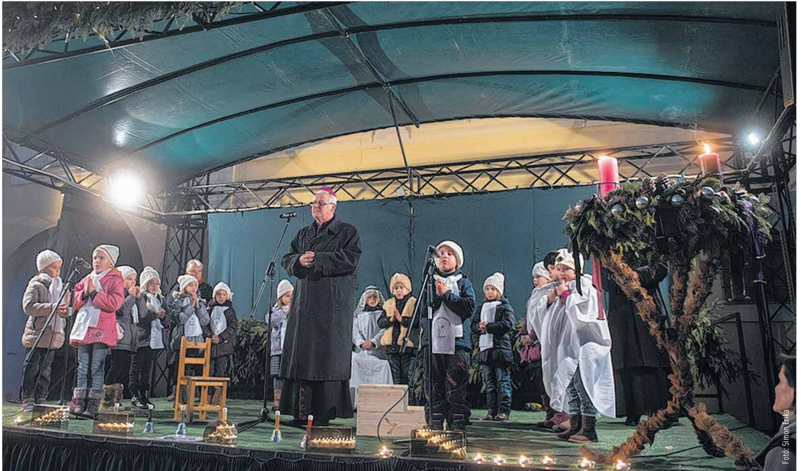
A harmadik gyertya az örömet jelképezi