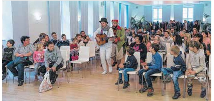
A Szabad Színház társulata interaktív műsorral szórakoztatta a gyerekeket