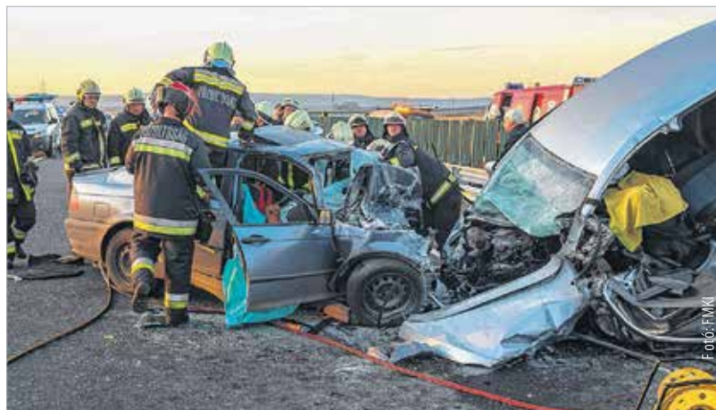
Tragikus baleset, frontális karambol az új elkerülőn. Az ütközés miatt a két autóvezető azonnal meghalt.

„Istenem nyugodjanak békében! Fiatal élet, mit érezhet a családja sajnálom az idős bácsit is, de ő már élte az életét és a jogosítványt sajnos korhoz kellene kötni, meg ha megy orvosi vizsgálatra nem hiszem, hogy már megfelelne.”