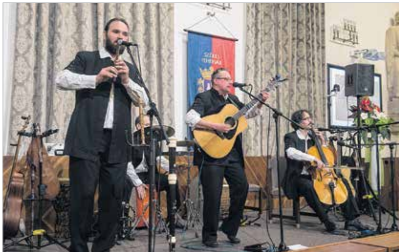
Misztrál együttes: Betlehemi királyok