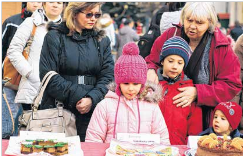
Három generáció teljes egyetértésben