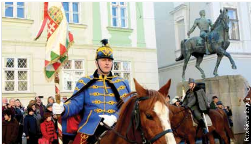
December 11-én, a fehérvári huszárok napján a limanovai csata 102. évfordulójára emlékezett a Fehérvári Huszárok Egyesülete a Városház téren. Az I. világháború egyik legvéresebb csatája zajlott le a Lengyelország területén lévő Limanovában. Az ottani harcok évfordulóján avatták fel 1939 decemberében Pátzay Pál szobrát a Városház téren.