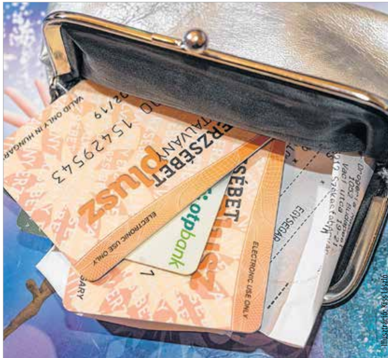
Illusztráció: Kiss László

2017-ben a béren kívüli juttatások 1,18-szorosára 15 százalék személyi jövedelemadót és 14 százalék ÉHO-t kell fizetni. Ebből kifolyólag a teljes közteher a mostani 34,52 százalékról 34,22 százalékra csökken. Ilyen kedvező adózással jövőre már csak Széchenyi Pihenő Kártyát valamint legfeljebb százezer forintnyi készpénzt lehet majd adni. Fontos, hogy erre a két juttatásra még egy szabály vonatkozik: a versenyszférában a nettó négyszázötvenezer forintot, a közszférában