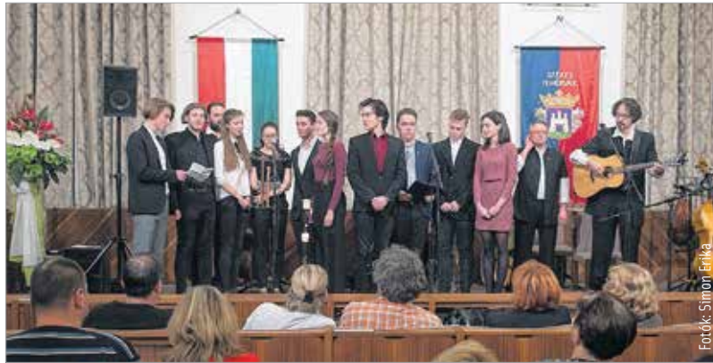
A Misztrál együttes és a fiatalok

Csak lángolni kevés, csak világítani hívságos semmisség. Lángolni és világítani, az maga a tökéletesség, mondta és írta egykoron Szent Bernát. A székesfehérvári