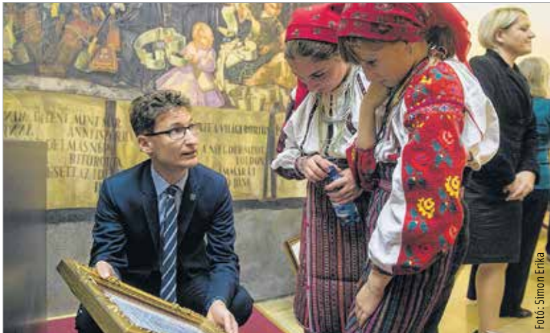
Az advent harmadik hétvégéjén tartott jótékonyági estre érkeztek gyerekek a határon túlról is, akiket Cser-Palkovics András polgármester látott vendégül a városházán