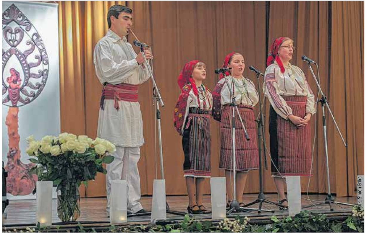
A pusztinai csángó magyarok archaikus énekükkel tették élménnyé az estet

Az est fővédnöke, Steinbach József dunántúli református püspök szerint az ökumenikus keresztény közösségi lét karácsonyváro pillanatait megosztani a segítségre szorulókkal a legtermészetesebb és legfontosabb cselekedetek egyike: „Ez az est nagyon fontos célt szolgál két tekintetben is: egyrészt a Kárpátaljai Református Egyházkerület Idősek Otthona megsegítését, másrészt a Székesfehérvári Egyházmegye Lea Otthon Családok Átmeneti Otthona támogatása a cél. Megjelenik az ökumené is: mi, keresztyének, akik Krisztust követjük, szeretnénk nemes célok érdekében összefogni. Mint a Magyarországi Egyházak Ökumenikus Tanácsának elnöke is mondom, hálás vagyok ezért az alkalomért!” Spányi Antal megyés püspök köszöntőjében hangsúlyozta, hogy a gondoskodó szeretet, amellyel az elesettek, a nélkülözők felé fordulunk advent idején, biznyság arra,