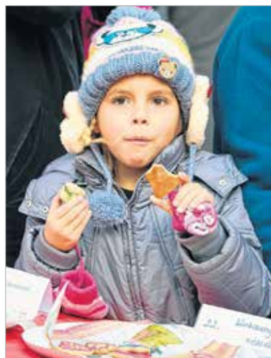
Mondd, te mit választanál?