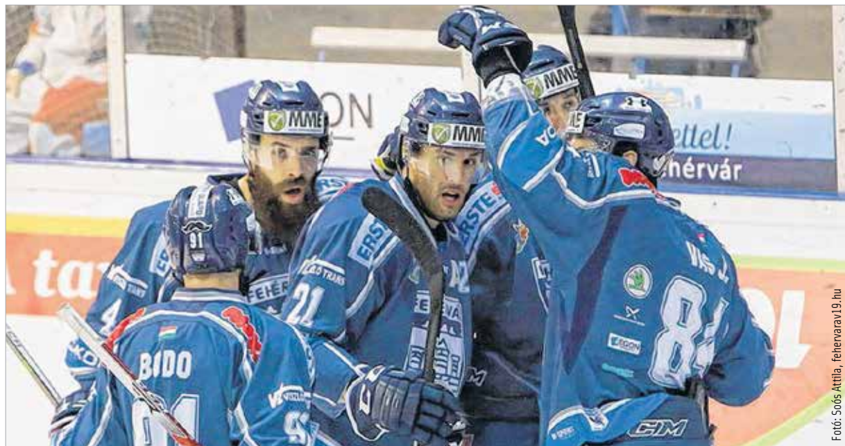
Volt okuk az öröme Kógeréknek a legutóbbi meccsken

Szombaton így jó hangulatban kelhetett útra a társaság Innsbruckba, ahol ugyan a hazaiak kétszer is vezettek két góllal, de a fehérvári társaság ezúttal is összekapta magát, és még a hosszabbítás előtt bezsebelte az 5-4-es győzelmet.