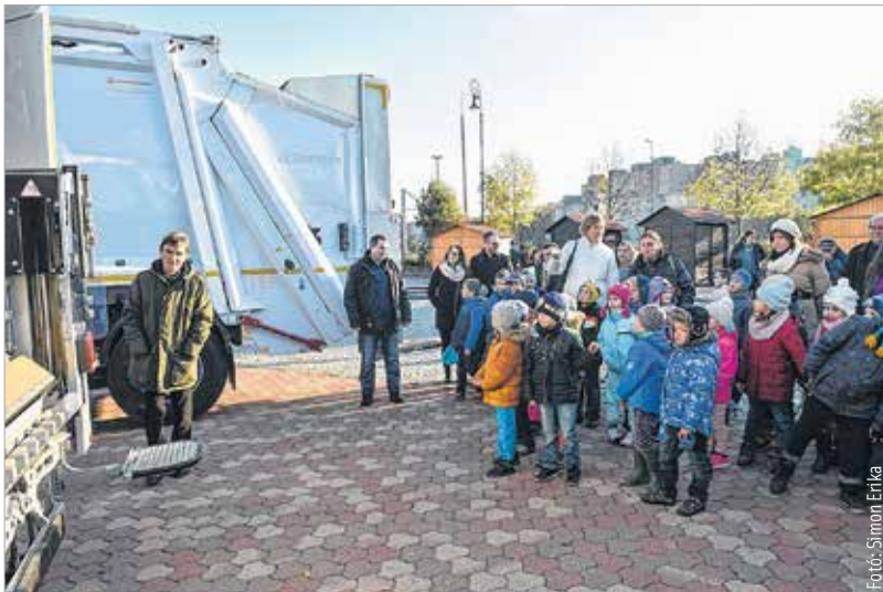
A szemléletformálás jegyében az új kukásautókat a gyerekek körében vette át a Depónia

A négy új kukásautó beszerzéséről a városi közgyűlés tavaly döntött. A százhetvenmillió forintos beruházást a város saját erőből finanszírozta. A polgármester szerint nagy szükség volt a fejlesztésre, hiszen Székesfehérvár egyik legfontosabb közszolgáltatása a hulladékszállítás. Cser-Palkovics András lapunknak elmondta: a gondos gazdálkodásnak köszönhetően sikerült olyan költségeket lefaragni, melyek lehetővé teszik a rezsicsökkentést és az esz-közfejlesztést. A Depónia Kft. összesen harminckét kukásautóval dolgozik a szemétszállításban, a járművek átlagéletkora tizenhárom év.