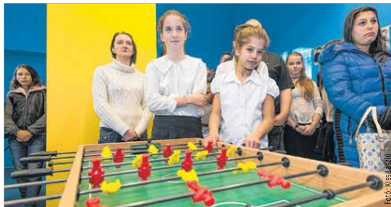
A legnagyobb kedvenc a csocsó lett

A közösségi tér kialakítása Székesfehérvár önkormányzata, a város polgármestere, a Fejér Megyei Esély Gyermekvédelmi és Gyermekmentő Alapítvány illetve a Pálfi-Tech Kft. támogatásával valósult meg kétfélmillió forintból. A város több mint 850 ezer forinttal támogatta az intézményt. Cser-Palkovics András polgármester úgy véli, látni kell, hogy egy nagyváros életében szükség van ilyen intézményre.