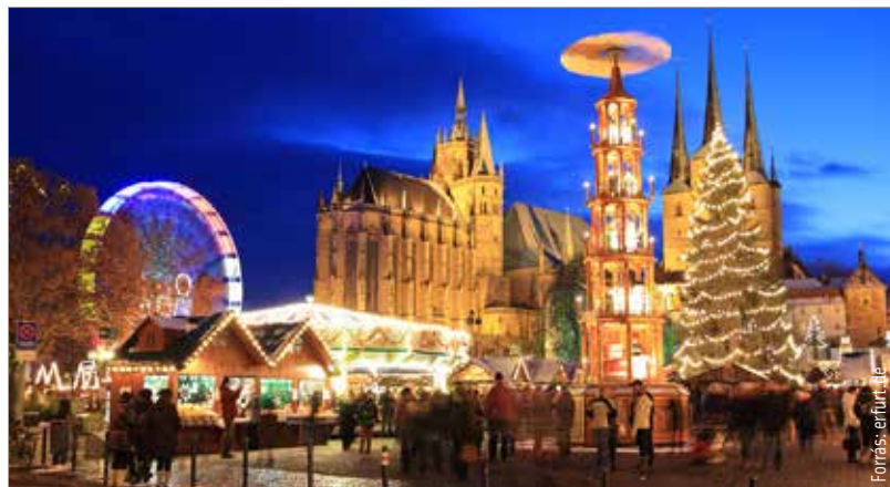
Az erfurti vásár különlegessége a karácsonyi piramis

valóságos mesevilággá varázsolja a Rathausplatzot. Idén körülbelül százötven standon lehet karácsonyi ajándékokat, például eredeti provance-i levendulatermékeket, fenyődíszeket és ünnepi finomságokat vásárolni. Egy tizenkét méter átmérőjű adventi koszorú valamint a karácsonyi díszbe öltöztetett fák borítják fényárba a környéket. A szervezők a legkisebbeknek külön programokkal készülnek: a gyerekek betekintést nyerhetnek a Jézuska-expresszt, levelet adhatnak fel a Mennyei Postahivatalban. Esténként kórusok és