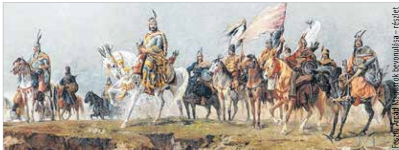
Az Árpád-ház-program a honfoglalás korától III. Andrásig foglalja magába történelmünket

Sokat hallhattunk róla, mégsem árt tisztába tenni: mi az Árpád-ház-program? Árpád fejedelem és az ő véreből származó Árpád-házi uralkodók több mint négyszáz éven keresztül játszottak rangos szerepet népünk honfoglalásában és a keresztény Magyarország kialakulásában. Az 1301-ig megépített Árpád-házi művet és honfoglaló fejedelmünk korát nemcsak a történelem viharai, hanem egyes korszakok emberi nemtörődömsége és politikai érdekei is pusztították. Magyarország kormánya 2016-ban arról döntött, hogy az Árpád-kort, az Árpád-házi királyok életművét, szellemi örökségét feltárja, rendszerezi, a megmaradt emlékeket, templomokat, emlékhelyeket felméri, ha kell, restaurálja, és kiállításokon bemutatja mindezt itthon és külföldön egyaránt. Azért valljuk meg, merész vállalkozásnak tűnik ez, amit nem lehet sebtiben megvalósítani. Nincs is szó arról! A megvalósítás több szakaszban történik 2038-ig, első keresztény királyunk halálának millenniumáig. Ebben a huszonkét