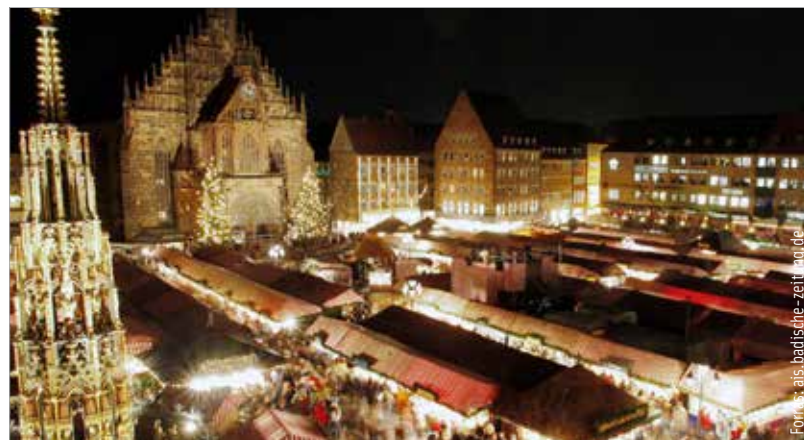
Ha szereti a különleges gyertyákat, akkor a nürnbergi karácsonyi vásárt ne hagyja ki!