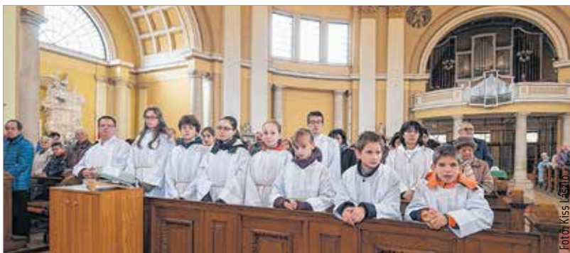
Száznegyvenhét méter hosszan alakították ki a fűtést a padokban, a nyolc padtömb fűtése külön-külön is kapcsolható, ami fontos szempont a takarékoság miatt. Emellett nemcsak a padosorok, de a gyóntatószékek is fűthetők.