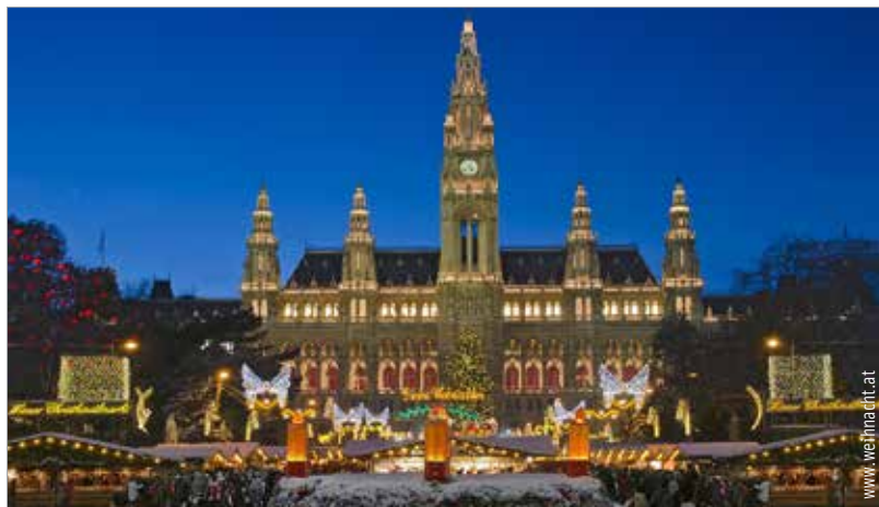
A Rathausplatz adventkor igazi mesevilággá változik

A nürnbergi karácsonyi vásárt tartják az egyik legfényesebbnek Európában, ami ebben az évben november 25-én nyitja meg kapuit. Az árusok a hagyományoknak megfelelően piros-fehér csíkos házikövekben árulják portékáikat. A városi legenda szerint itt lehet kapni a világ legkülönlegesebb formájú, illatú és színű gyertyáit. A színpadon keddtől péntekig délután háromkor kórusok, fúvószenekarok és gyerekeneszek lépnek fel. A gasztronómia szerelmeseinek a forralt boron és a sült kolbáson túl érdemes megkóstolni a híres nürnbergi mézeskalácsot!