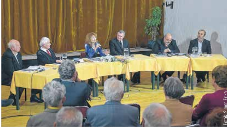
A résztvevők egyetértettek abban, hogy a szabadságharc és utóélete fehér foltjait mielőbb fel kell tárn