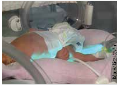
Húsz százalékkal csökkent a koraszülött-halandóság Magyarországon

Az elmúlt két évben húsz százalékkal csökkent a koraszülött-halandóság Magyarországon – mondta az M1 aktuális csatornán hétfőn este az emberi erőforrások minisztere. Balog Zoltán szerint az átfogó intézkedéseknek köszönhetően több száz millió forint jutott azokra az eszközökre, melyek a koraszülött csecsemők ápolására szolgálnak. Ezt kiegészítette a velük foglalkozó szakemberek képzése. A tendencia a Fejér megyei kórházban is tetten érhető.