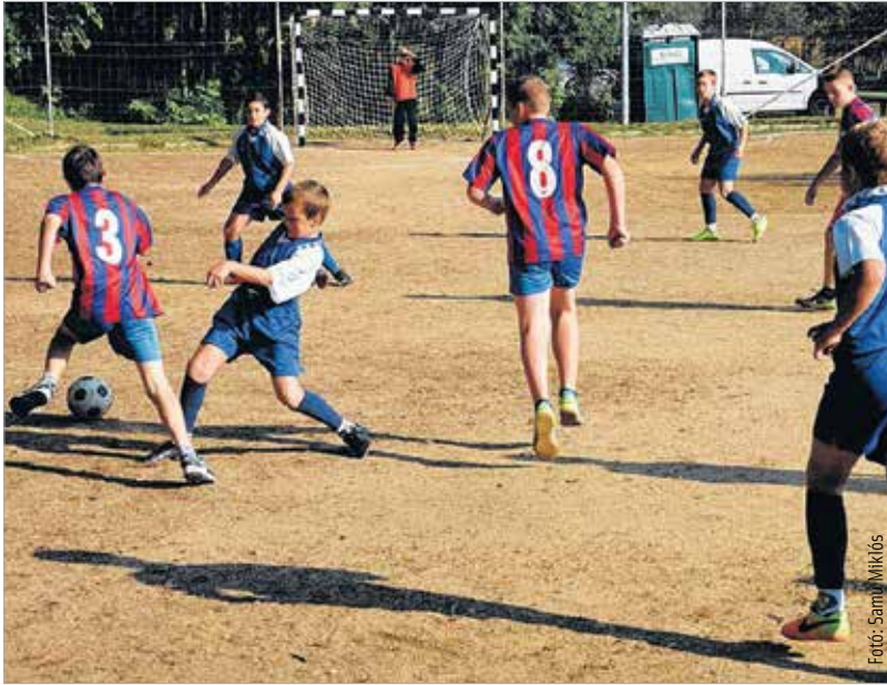
Hat iskola diákjai küzdöttek a kupáért

A Lehel utca mögötti sportpályára várták a gyerekeket valamint az őket kísérő családtagokat szombaton délelőtt. Hat székesfehérvári általános iskola ötödik osztályos válogatottja kapott meghívót az idei Aszalvölgyi Focikupára.