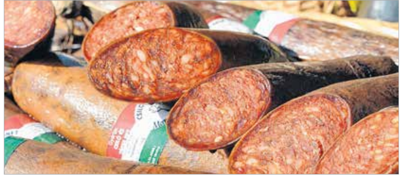
Csak ellenőrzött állományból származó termék vehetett részt a fesztiválon

A Mangalicafesztiválon a múlt és a jelen találkozott, hiszen a standokon hagyományos, minőségi mangalicaételeket, sonkát, szalonnát vagy éppenséggel disznósajtot vehettünk. A klasszikus sült kolbász-hurka-tarja-pörkölt