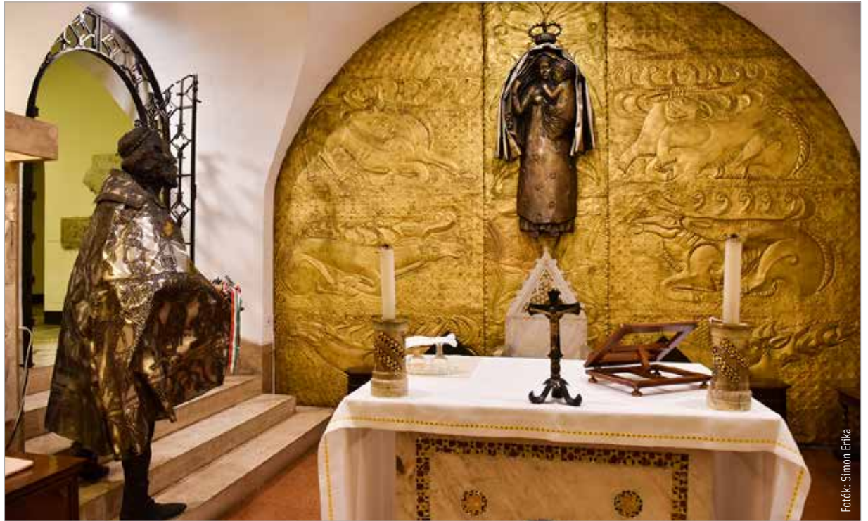
A Magyarok Nagyasszonya-kápolna zarándokhelye a magyarságnak. Október 8-án várhatóan több fehérvári is elmegy Rómába.

A Vatikáni Múzeum dísztermeit, ahol freskók és festmények ábrázolják, ahogy Szent István az apostoli keresztet tartva átveszi a Szent Koronát, illetve egy másik képen ugyanazt felajánlja. Hasonló képek találhatóak a Luteráni Szent János-bazilikában és II. Szilveszter pápa síremlékén is. Úti és forgatási célunk lesz a Szent István által alapított Magyar Zarándokház, amit ugyan 1776-ban lebontottak, de a Szent Péter-bazilika keresztfolyosójának külső falán egy hatalmas