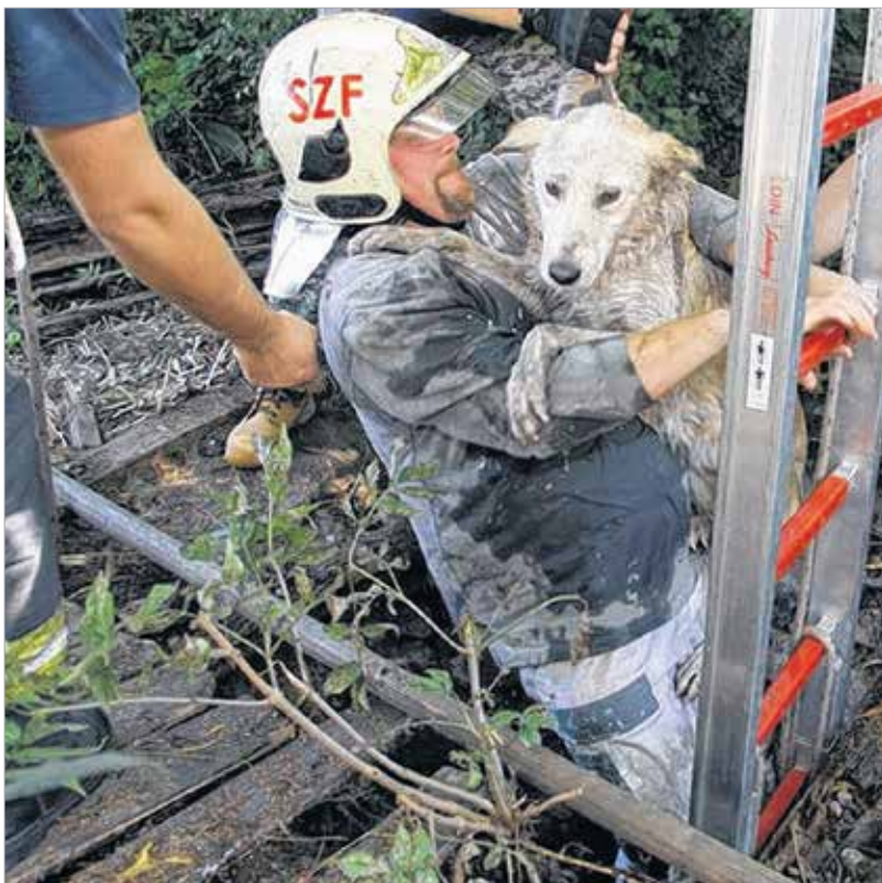
A tűzoltók az állatmentők segítségével hozták fel az ijedt ebet

úgy, hogy bejárja a környéket. Három házzal arrébb jutott csak, ott ugyanis beleesett egy használaton kívüli kútba. Az ott lakó asszony másnap figyelte fel a kutya síró hangjára. Amint észlelte, mi történt, azonnal hívta a tűzoltókat. Farkas Bozsik Gábor tűzoltó alezredest, megyei katasztrófavédelmi szóvivő azt mondta, a kutya nyolc métert zuhant, és a nagyjából negyven centis vízben várta a segítséget. A tűzoltók a FEMA állatmentőkkel és a gazdával közösen hozták fel a bajba jutott kutyát. Mollit kútba esett kalandja után újabb megpróbáltatás érte: nagyszabású tisztításon és szárításon kellett átesnie, de más traumát nem élt át a kiskutya, este már társával együtt őrizte a pákozdi birtokot.