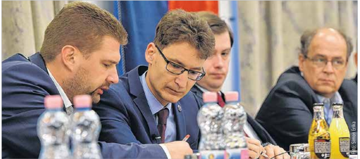
Emléktáblák elhelyezéséről is határoztak: a Ciszterci Szent István Gimnázium a Nemzeti Emlékhely északi téglafalán a Magyar Királyok Galériájának folytatásaként szeretné elhelyezni Nagy Lajos király domborművét. A másik emléktábla a vasútállomáson lenne, a nemrég lebontott irányítótorny emlékére.