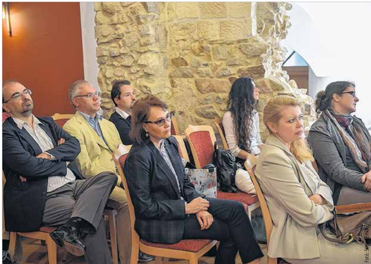
Rendkívüli érdeklődés kísérte a királynéről szóló konferenciát