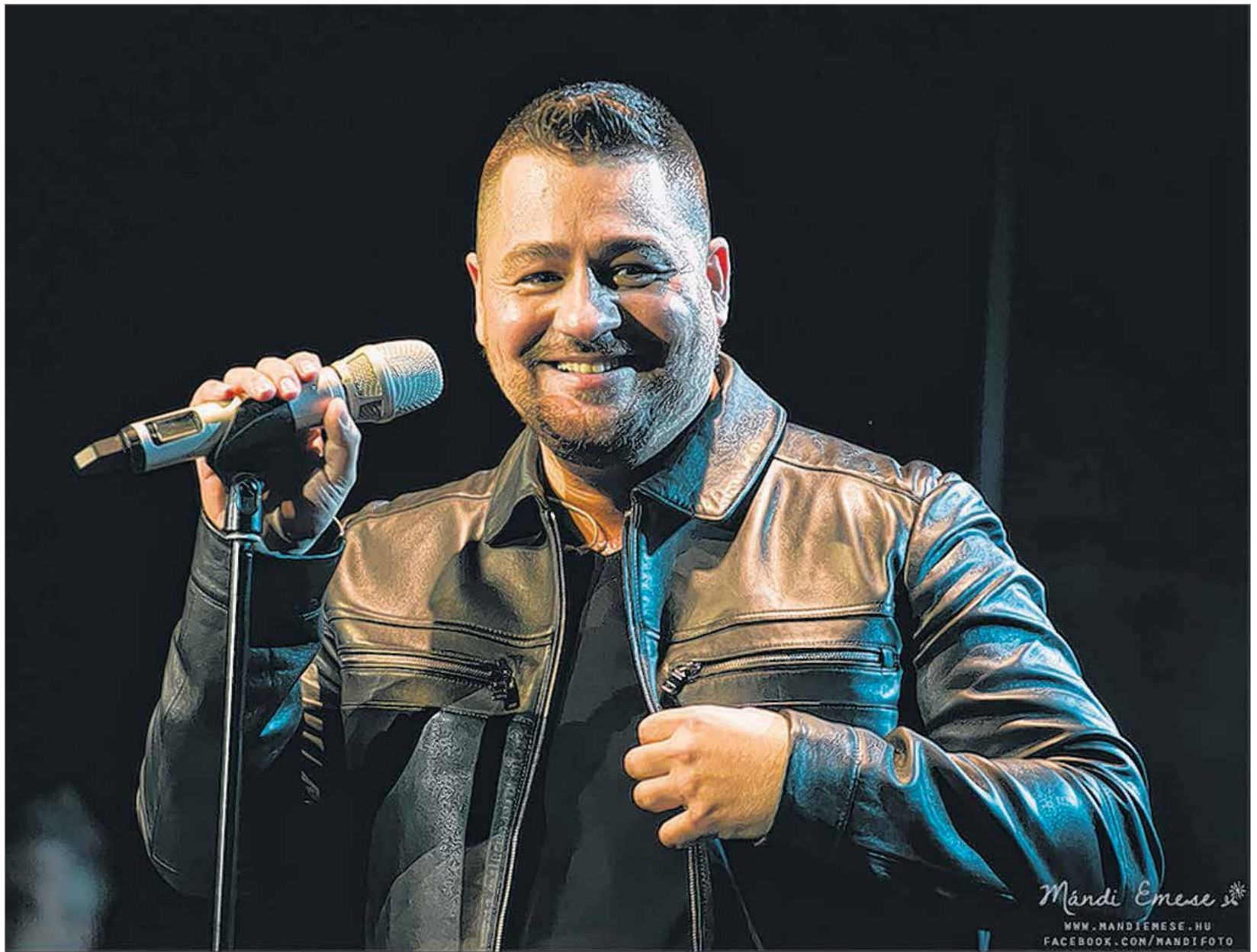
Caramel igazi zenei csemegével készül az októberi fehérvári koncertre

vannak beleépítve a dalszövegbe is. Ezt a vonalat szeretném kicsit továbbvinni úgy, hogy nemcsak a magyar népzene, de más etnikumok ízeit is szeretném megmutatni a dalaimban, más zenei kultúrákból is szeretnék felvonnatni elemeket. Természetesen ezek csak fűszerek, emellett saját dalaimat is áthangszereltük erre a koncertre. Jó pár olyan látványelemet is fogunk mutatni a közönségnek, ami eddig nem volt jellemző. Próbálunk minden érzékszervre hatást gyakorolni, igazi élményt adni amellest, hogy mi is jól érezzük magunkat. Amit ígérhetek: én minden alkalommal kicsit felrobbanok, megsemmisülök a színpadon – itt sem fogok spórolni!