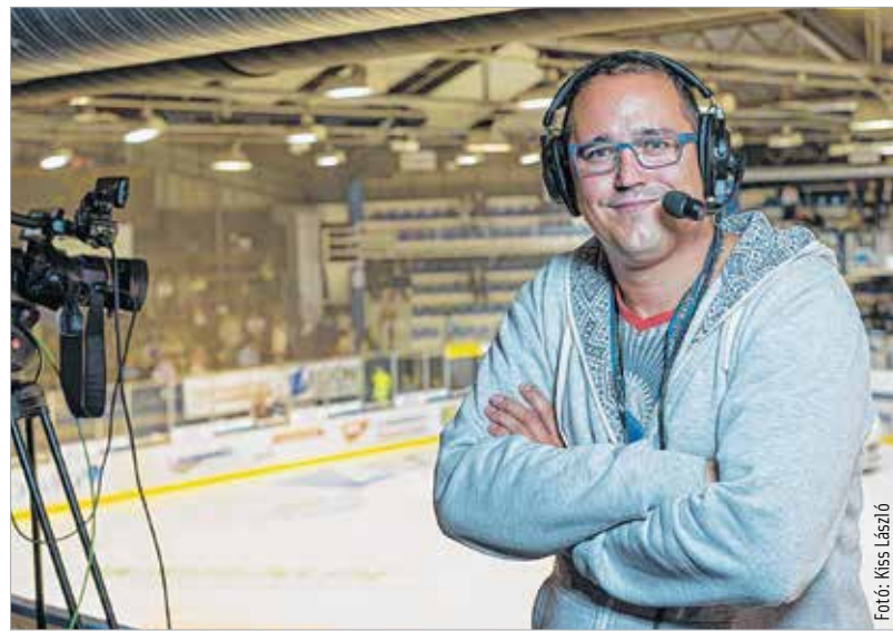
Itt éppen nem a kézilabda-, hanem a jégkorongcsarnokban

Egyenes út vezetett egy sportáruházba, amit nagyon szerettem. Egy