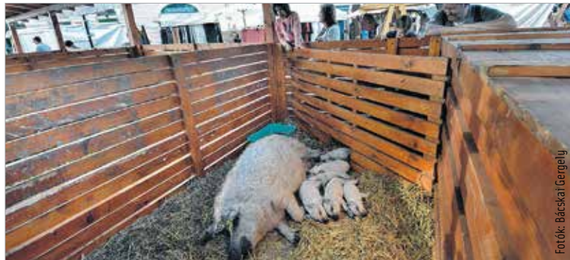
A szőke, a vörös és a fecskahasú mangalicákat élőben is meg lehetett nézni

tengelyen kívül az ínycsekek az ország legmenőbb street food truckjainak speciális mangalica-kínálatát is végigkóstolhatták. A „Zabáljcsak”-ban a „hagyományos” sertésalapocskából készült pulled pork mellett most próbát tettek a mangalicalapocskával is. A Piknik Utzabár kínálatában szerepelt mangalica carpaccio thai salátával, vagy az elsőre kicsit furcsának Angus marha kéksajtos-mangós burger formájában. Aki pedig egy-egy finomabb falat után megszomjazott, leöblíthette sörrrel, borral vagy a disznóságokhoz kiválóan passzoló pálinkával.