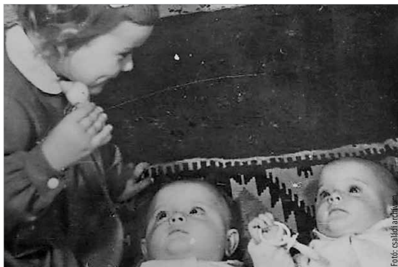
A kis Vali és az ikrek

idő: „A házhoz senki nem akart kijönni, mert mindenki félt. Olyan világ volt Fehérváron! Lövöldöztek össze-vissza, tankok jártak az utcákon. A férjem meg apukám biciklire pattant, és bement a kórházba. Egy mentős mondta neki, hogy behoz minket a kórházba, de csak akkor,