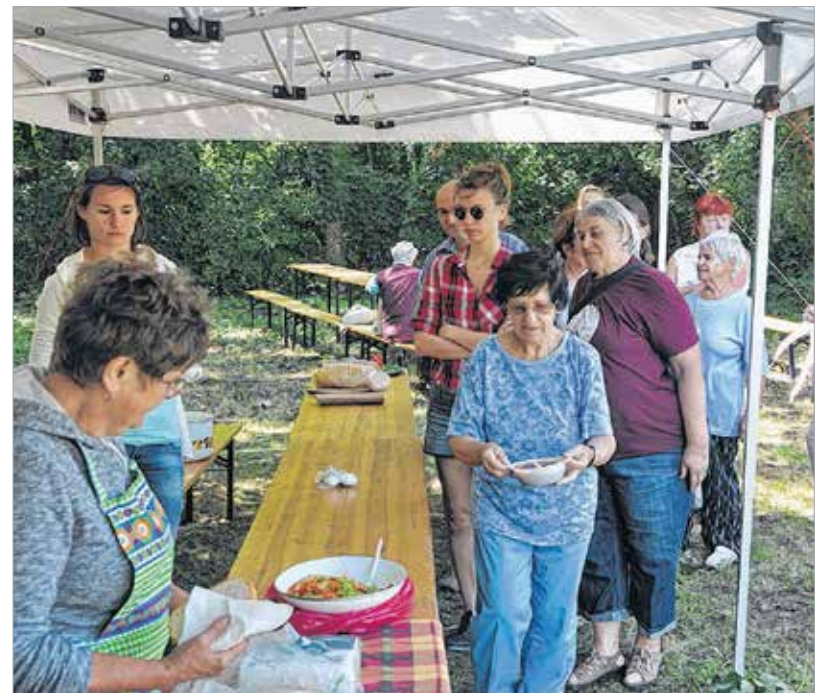
A gulyás idén is rendkívül finomra sikeredett

A szombati programon különböző egészségügyi szűréseket is szerveztek a Vöröskereszt munkatársainak jóvoltából. Az eseményen ezen kívül aláírásgyűjtést is tartottak, amit Székesfehérvár Önkormányzata hirdetett meg a koronázási palást hazahozataláért és Székesfehérváron történő kiállításáért.