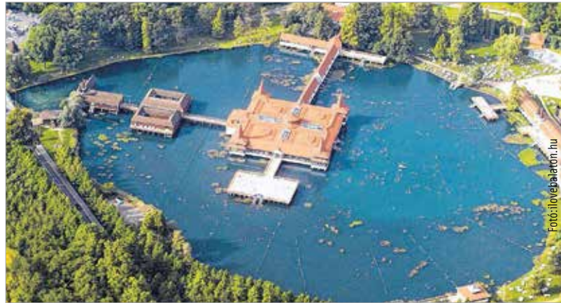
A magyarországi termásvíz nemzetközi híré

Etimológiailag nem vizsgáltam Hévíz nevének kialakulását, de a fentebb jelzett felkiáltás ebben a szépen kialakított, jelentős zöld területekkel körülvett városkában szinte bármikor megáll. Tudják ezt a keletről érkező turisták is: nincs nap, hogy ne érkezzen egy-két busznyi kínai vagy koreai csoport. A szmogfelhővel körülvett milliós nagyvárosokból érkezett turistáknak a friss levegő és a kék ég már önmagában szanatóriumi körülmény, és ha hozzátesszük ehhez a gyógyító, állandóan virágzó tavat, akkor ez maga a paradicsom! Érdekes, hogy a keleti kultúrákban a nyilvános fürdés még mindig mint-ha tabunak számítana. Nem egy-