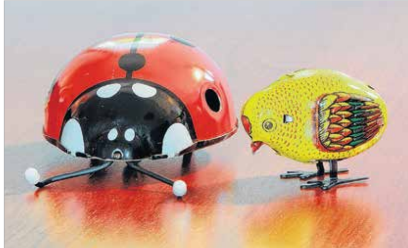
A felhúzható állatfigurák pusztája megjelenésükkel megidéz egy letűnt kor szellemét

tagozatos tanár, majd hozzátette: „Szerencsére még mindig népszerűek a gondolkodtató, fejlesztő játékok, a legó, a babák, az autók. Nagyon szeretnek focizni, kosarazni, kidobózni, fogócskázni, és mivel a gyerekek fantáziája