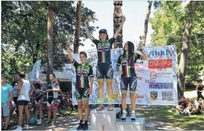
A lányok versenyében taroltak a Szingo Balaton Team bringásai

kiváló atmoszféra és a magyar kerékpársport krémjének izgalmas küzdelme jellemezte a Kincsesháza-Gúttamási-Fehérvárcsurgó útvonalú, 17,4 km-es, 166 méter szintkülönbségű pályán megrendezett megmérettetést. Az esemény rangját emelte, hogy ez évben is ezen a versenyen dőlt el, ki viselheti a magyar bajnoki trikót a Senior kategóriákban. A győzelmet – tavalyi sikerét megismételve –