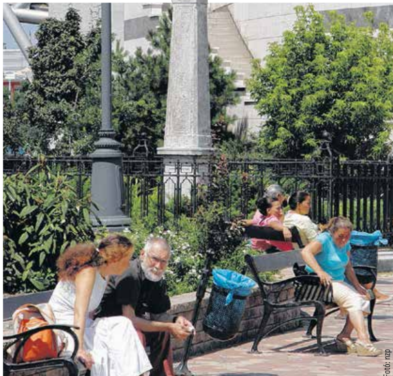
A Máriáról készült szobrot 1700-ban állították fel arra a területre, ahol Szapolyai János eltemették. E helyet mára elnyomja a bevásárlóközpont fala, de Szűz Mária szobrának hiteles másolata ma is áll az eredeti posztamenten. Az 1700-ban felállított eredeti szobor a városháza első emeletén látható.

ünnepét is más magyarázatot kap, hiszen számukra nincsenek a Földről felköltöző szentek. Az egyház-erősítés viszont a protestáns egyházaknak is fontos volt, azért István földi érdemeit elfogadják, amely az őskeresztény elveken alapult, amihez a reformációt követően a protestánsok is igyekeztek visszatérni. Ezért Szent István ünnepét a reformátusoknak, evangélikusoknak és baptistáknak is.