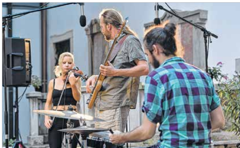
A Santa Diver számára a siker mércéje a közönség szeretete

be. Figyeltünk arra, hogy csak azokat hívjuk, akik mögött ott van a munka. Az alkalmi zenekarokat mellőztük, hiszen a közönségnek is fontos, hogy professzionális, színvonalas műsorokat hallhasson.”