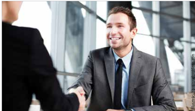
Kézfogásnál nézzünk mindig a HR-es szemébe!

Következő lépésként nézzük át a közösségi médiában megtalálható adatlapjainkat! A magyar DGS Global Research kutatócég felméréséből kiderült, a személyzetiek közel negyven százaléka a közösségi oldalakon is rákeres a pályázókra. Néhány féktelenül bulizós fénykép vagy az önéletrajznak teljesen ellentmondó információ pedig nem segít abban, hogy miénk legyen az állás! A ruhát is érdemes jól megválasztani. A férfiak lehetőleg inget, nyakkendő és öltönynadrágot, a hölgyek pedig kiskosztümöt válasszanak az interjú-