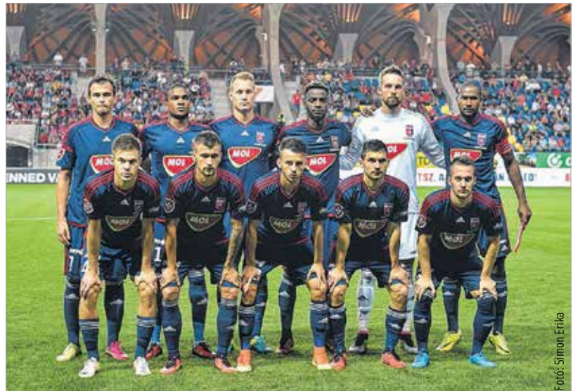
A Videoton gyirmóti sikerével elmozdult a tabella aljától, az élmezőnyhöz történő felzárkózás azonban a Mezőkövesd elleni három pontot is be kellene gyűjteni!

Az alap tehát megvan a jó folytatáshoz, mely egyben a szezon első hazai sikerét jelentené a magyar bajnokságban. Az Európa Liga selejtezőjében a Zaria Bálfi és a Csukaricski is behódolt Felcsúton a Vidinek, a bajnokságban azonban a DVTK és a Vasas is nyerni tudott a Pancho Arénában, így a cél nem lehet más a piros-kékek számára, mint a szintén újonc, négy forduló alatt öt pontot szerző Mezőkövesd legyőzése a szombat 18 órakor kezdődő találkozón.