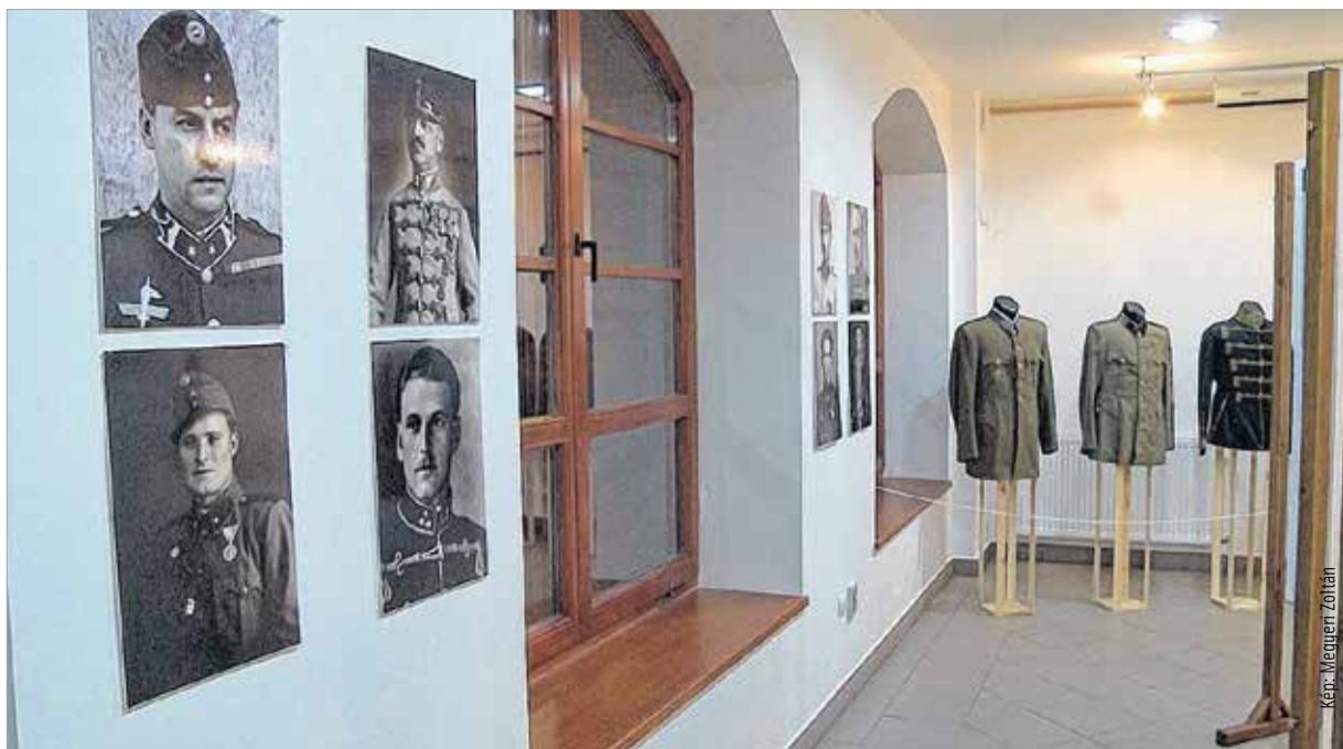
A világháborús egyenruhák és arcok üzennek a mának