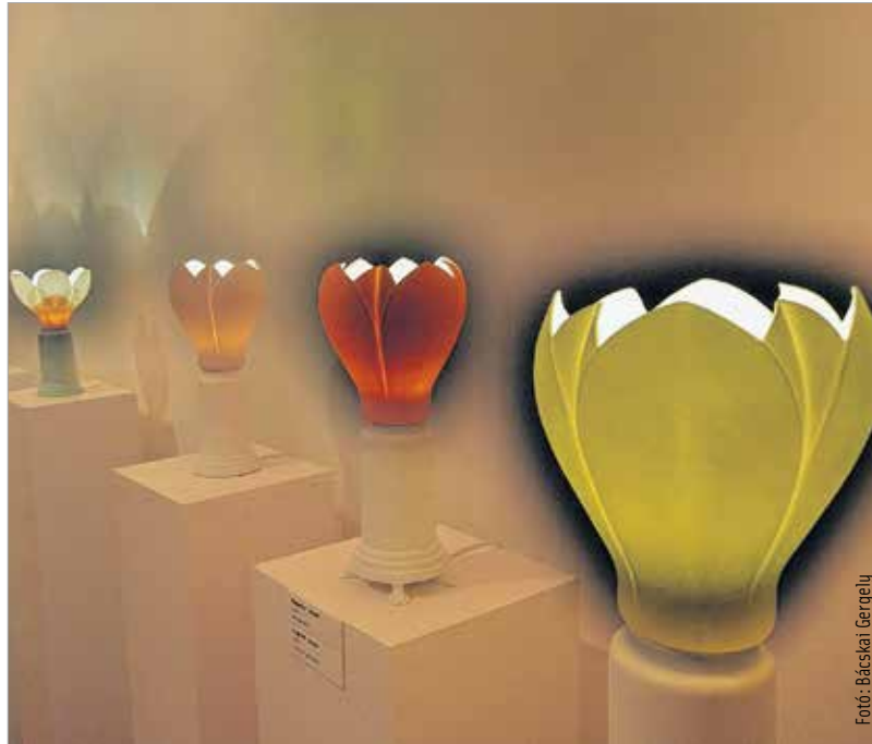
A friss és stílusos alkotások a fiatalabb generációt közelebb hozzák a herendi porcelánhoz

Az egyedüli, hártavékonyaságú, áttetsző szíromtálak, színes intarziás vázák, organikus dísz tárgyak, lámpák hamar népszerűek lettek főként Olaszországban, Görögországban és Svájcban, de eljutottak Londontól Izraelen és Hong-Kongon át egészen Új-Zélandig. Friss szemléletű, stílussteremtő műveivel célzottan a fiatalabb generáció érdeklődését szeretné a herendi porcelán felé fordítani.