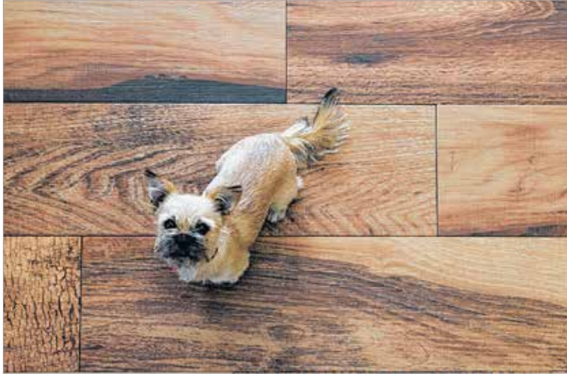
A fa vagy famintázatú burkolat otthonosságot kölcsönöz a teraszoknak

rajtuk elcsúszni. Ha a teraszt sokat süti nap, akkor a világosabb kerámiaburkolat mellett érdemes dönteni, mert a sötétebb válto-