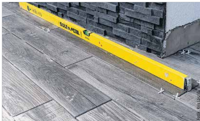
A sötét ötven árnyalata jól mutat kültéren is

A terasz alaphangulatát a burkolat határozza meg, amely lehet többek között fa, kerámia vagy éppenséggel kompozit műanyag. Kotroba Dénes üzletvezető és burkolattanácsadó kiemelte, hogy a fa igazi otthonosságot, melegséget sugároz, viszont folyamatosan karban kell tartani, többek között olajozni, csiszolni kell, hogy ne keletkezzenek rajta repedések, színváltozások. A kompozit műanyagból készült WPC-burkolatok a teraszon vagy